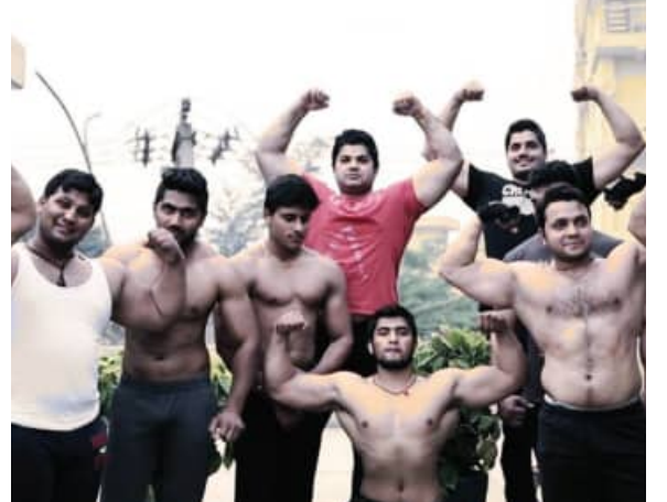
ପାଇବାକୁ ଅଳ୍ପକେ ବଞ୍ଚିତ ହୋଇଥିଲେ । ପରେ ସେ ଜଣେ ବାଉଁଶର ଭାବେ ନିଜ ଜୀବିକା ନିର୍ବାହ କରିଥିଲେ । ତାଙ୍କ ସଫଳତା ଗାଁର ଅନ୍ୟ ଲୋକଙ୍କୁ ପ୍ରେରଣା ଦେଇଥିଲା । ସେମାନେ ମଧ୍ୟ ବାଉଁଶର ଭାବେ କାର୍ଯ୍ୟ କରି ନିଜ ଶାରୀରିକ ଶକ୍ତିକୁ ଜୀବିକାରେ ପରିଣତ କରିବାକୁ ନିଷ୍ପତ୍ତି ନେଇଥିଲେ ।