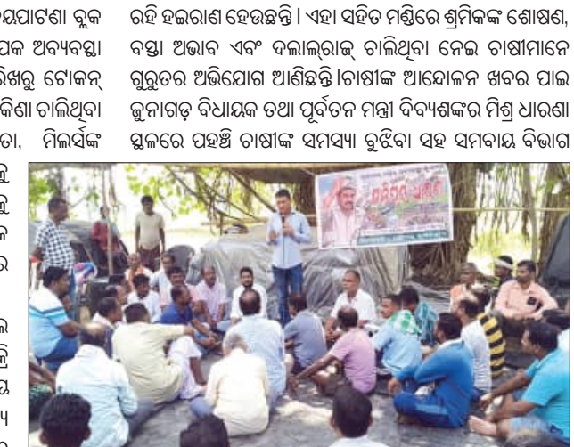
ରହି ହଜାରୋ ହେଉଛନ୍ତି। ଏହା ସହିତ ମଣ୍ଡିରେ ଶ୍ରମିକଙ୍କ ଶୋଷଣ, ବସ୍ତା ଅଭାବ ଏବଂ ଦକାଲରାଜ ଚାଲିଥିବା ଦେଖାଯାଇଛି।

ଜୟପାଟଣା, ୧୪।୬(ସମିପ): କଳାହାଣ୍ଡି ଜିଲ୍ଲା ଜୟପାଟଣା ବ୍ଲକ୍ ଅଧୀନ ରଣମାଳ ମଣ୍ଡିରେ ଧାନ ଉଠାଣରେ ବ୍ୟାପକ ଅବ୍ୟବସ୍ଥା ଦେଖାଦେଇଛି। ଚାଷୀମାନେ ଗତ ମେ ୨୦ ତାରିଖରୁ ଟୋକନ୍ ପାଇଥିଲେ ମଧ୍ୟ ଏଠାରେ ଅତି ମଜୁର ଗରିବ ଧାନ କିଣା ଚାଲିଥିବା ଅଭିଯୋଗ ହୋଇଛି। ପ୍ରଶାସନିକ ଉଦ୍‌ଯୋଗ୍ୟ, ମିଳିତ ସହଯୋଗର ଅଭାବ ଏବଂ ମଣ୍ଡିରେ ଦକାଲ ରାଜକୁ ସିରୋଧ କରି ଶେଷରେ ଚାଷୀମାନେ ଧାରଣାକୁ ଓହ୍ଲାଇଥିଲେ। କୁନାଗଡ଼ ବିଧାୟକ ତଥା ପ୍ରଶାସନିକ ଅଧିକାରୀଙ୍କ ହସ୍ତକ୍ଷେପ ଏବଂ ପ୍ରତିଶ୍ରୁତି ପରେ ବର୍ତ୍ତମାନ ଆୟୋଜନ ସ୍ଥଗିତ ରହିଛି।