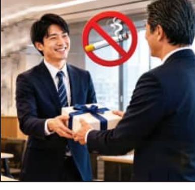
ସିଲ୍‌ଓ ଟାଙ୍କା ଓ ଆୟୁକାଙ୍କ କହିବା ଅନୁଯାୟୀ, 'ସେ କର୍ମଚାରୀଙ୍କ ଉପରେ କୋରୋନାବିରୁଦ୍ଧ କୌଣସି ଜରିମାନା କିମ୍ବା ନିଷେଧାଦେଶ ନ ଲଗାଇ, ପୁରସ୍କାର ମାଧ୍ୟମରେ ସେମାନଙ୍କୁ ଭଲ ଅଭ୍ୟାସ ଆପଣାଇବାକୁ ଉତ୍ସାହିତ କରିବାକୁ ଚାହୁଁଥିଲେ ।' ଅନ୍ୟପଟେ ଜାପାନର ଏହି ପରକ୍ଷେପ ବିଶ୍ୱର ଅନ୍ୟ କମ୍ପାନୀଗୁଡ଼ିକର ଦୃଷ୍ଟିଆକର୍ଷଣ କରିଛି । ଅନ୍ୟ କମ୍ପାନୀ ମଧ୍ୟ କର୍ମଚାରୀଙ୍କୁ ସ୍ୱାସ୍ଥ୍ୟକର ଜୀବନଶୈଳୀ ଆପଣାଇବା ଲାଗି ଅଲଗା ଅଲଗା ପ୍ରକାର ପ୍ରୋତ୍ସାହନ ଦେବା ଆରମ୍ଭ କରିଛନ୍ତି । କେଉଁଠି ପିଟ୍‌ନେସ୍ ବୋନସ୍ ପ୍ରଦାନ କରାଯାଉଛି ତ ଆଉ କେଉଁଠି ସ୍ୱାସ୍ଥ୍ୟ ସମ୍ବନ୍ଧିତ ଲକ୍ଷ୍ୟକୁ ପୂରା କରିବା ଲାଗି ଅତିରିକ୍ତ ସୁବିଧା ଦିଆ ଯାଉଛି ।

ଆଜିକାଲି କମ୍ପାନୀଗୁଡ଼ିକ କର୍ମଚାରୀଙ୍କ ସ୍ୱାସ୍ଥ୍ୟ ତଥା କାର୍ଯ୍ୟ ଦକ୍ଷତାକୁ ଉନ୍ନତ କରିବାକୁ ନୂଆ ନୂଆ ନୀତି ଆପଣାଉଥିବାର ଦେଖାଯାଉଛି । ଏହି କ୍ରମରେ ଜାପାନର ମାଟେଟି କମ୍ପାନୀ ପିଆଲା ଇଙ୍କ୍ ମୁଖ୍ୟତଃ ଏହାର 'ନନ୍-ସ୍ମୋକର୍ସ୍ ପେଡ଼ୁ ଲିଭ୍' ନୀତି ପାଇଁ ବିଶ୍ୱବ୍ୟାପି ଚର୍ଚ୍ଚିତ । କମ୍ପାନୀ ଏହି ନିୟମ ୨୦୧୬ ମସିହାରେ ଆଣିଥିଲା । ନିୟମ ଅନୁଯାୟୀ, କମ୍ପାନୀରେ ଧୂମପାନ କରୁ ନ ଥିବା କର୍ମଚାରୀଙ୍କୁ ପ୍ରତିବର୍ଷ ୬ଟି ଅତିରିକ୍ତ ଛୁଟି ମିଳିଥାଏ । ଏହି କମ୍ପାନୀର କାର୍ଯ୍ୟାଳୟ ୨୯ ତମ ମହଲାରେ ଥିବାରୁ, ଧୂମପାନ କରୁଥିବା କର୍ମଚାରୀମାନେ ତଳକୁ ଯିବା-ଆସିବା କରିବାରେ ପ୍ରତିପ୍ରାୟ ୧୫ ମିନିଟ୍ ସମୟ ନେଉଥିଲେ । ଏହି ସମସ୍ତ ନଷ୍ଟ ନ କରିବା ପାଇଁ କର୍ମଚାରୀଙ୍କୁ ୬ ଦିନର ଅତିରିକ୍ତ ଛୁଟି ପ୍ରଦାନ କରାଯାଏ । ସେହିଭଳି ଧୂମପାନ କରୁଥିବା କର୍ମଚାରୀମାନେ ବାରମ୍ବାର 'ସ୍ମୋକିଂ ବ୍ରେକ୍' ନେଇଥାନ୍ତି, ଯାହାଫଳରେ ନନ୍-ସ୍ମୋକର୍ କର୍ମଚାରୀଙ୍କ ଉପରେ କାମର ଚାପ ବଢ଼ିଥାଏ । ଏହି ନିୟମ ଲାଗୁ ହେବା ପରେ କମ୍ପାନୀରେ ଏକ ବଡ଼ ସୁଧାର ଦେଖିବାକୁ ମିଳିଥିଲା । କମ୍ପାନୀ ଏହି ନୀତି ଆରମ୍ଭ କରିବା ପରେ ଅନେକ ଧୂମପାନ କରୁଥିବା କର୍ମଚାରୀ ଅତିରିକ୍ତ ଛୁଟି ପାଇବା ଆଶାରେ ସିଗାରେଟ୍ ଛାଡ଼ିବାକୁ ନିଷ୍ପତ୍ତି ନେଇଥିଲେ । ଏନେଇ କମ୍ପାନୀର