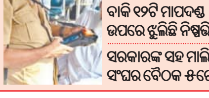
ବାକି ୧୨ଟି ମାପଦଣ୍ଡ ଉପରେ ଝୁଲିଛି ନିଷ୍ପତ୍ତି ସରକାରଙ୍କ ସହ ମାଲିକ ସଂଘର ବୈଠକ ଫରେ

■ କଟକ, ୨୬ (ସମିସ): ତିଳେଇ ଦର ବୃଦ୍ଧିକୁ ଦୃଷ୍ଟିରେ ରଖି ସରକାର ପୁଣି ବସ୍ ଉଡ଼ା ବୃଦ୍ଧି କରିଛନ୍ତି। ରାଜ୍ୟ ପରିବହନ ପ୍ରାଧିକରଣ ପକ୍ଷରୁ ଉଡ଼ା ବୃଦ୍ଧି ନେଇ ଆଜି ବିଜ୍ଞପ୍ତି ପ୍ରକାଶ ପାଇଛି। ଗତ ମେ ୧୫ରେ ରାଜ୍ୟରେ ତିଳେଇ ଦର ଲିଟର ପିଛା ୯୫ ଟଙ୍କା ୮୭ ପଇସା ଥିଲା। ମେ ୩୧ ସୁଦ୍ଧା ତାହା ୧୦୦ ଟଙ୍କା ୬୮ ପଇସାରେ ପହଞ୍ଚିଛି। ତିଳେଇ ଦରରେ ସିଧାସଳଖ ୪ ଟଙ୍କା ୮୧ ପଇସା ବୃଦ୍ଧି ହୋଇଥିବାରୁ ବସ୍ ଉଡ଼ା ବୃଦ୍ଧି କରାଯାଇଛି। ବର୍ଦ୍ଧିତ ଉଡ଼ା ଅନୁସାରେ, ସାଧାରଣ ଯାତ୍ରାବାହୀ (ଅର୍ଡିନାରି) ବସ୍ ଉଡ଼ା କିଲୋମିଟର ପିଛା ୯୦ ପଇସା ଥିବା ବେଳେ ଏବେ ଏହା ୯୨ ପଇସାକୁ ବୃଦ୍ଧି ପାଇଛି। ସେହିଭଳି, ଏକ୍ସପ୍ରେସ୍ ଚାର୍ଜ ବସ୍‌ଗୁଡ଼ିକ ପାଇଁ ଲାଗୁ ହେବ ନାହିଁ ବସ୍ ଉଡ଼ା କିଲୋମିଟର ପିଛା ୯୪ ପଇସାକୁ ବୃଦ୍ଧି ପାଇଛି। ଏହି ତିଳେଇ ଦର ଉଡ଼ା କିଲୋମିଟର ପିଛା ୯୯ ଟଙ୍କା ୮୯ ପଇସା ଥିବା ବେଳେ ଏବେ ଏହା ୧୦୧ ଟଙ୍କା ୮୯ ପଇସାକୁ ବୃଦ୍ଧି ପାଇଛି। ଏହାପରେ ପରବର୍ତ୍ତୀ ଯାତ୍ରା କଳେ ଏବେ କିଲୋମିଟର ପିଛା ୧୦୨ ଟଙ୍କା ୮୯ ପଇସା ବଦଳରେ ୧୦୪ ଟଙ୍କା ୮୯ ପଇସା ହେବ। ତେବେ ଏବେ ଏହା ୯୨ ପଇସାକୁ ବୃଦ୍ଧି ପାଇଛି। ସେହିଭଳି, ଏକ୍ସପ୍ରେସ୍ ଚାର୍ଜ ବସ୍‌ଗୁଡ଼ିକ ପାଇଁ ଲାଗୁ ହେବ ନାହିଁ ବସ୍ ଉଡ଼ା କିଲୋମିଟର ପିଛା ୯୪ ପଇସାକୁ ବୃଦ୍ଧି ପାଇଛି।