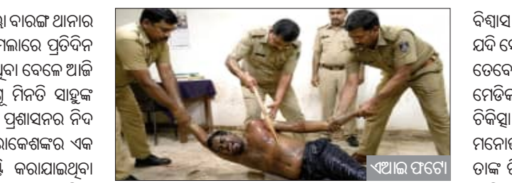
ପୋଷାକ ଜନସାଧାରଣଙ୍କୁ ସୁରକ୍ଷା ଦେବା କଥା, ସେମାନେ ନିଜ ପାପ ଛୁଟାଇବା ପାଇଁ ଯଦି ଏଭଳି ସ୍ତ୍ରୀକୁ ବଦଳାଇ ମିଛ କାହାଣୀ ରଚନା କରିବେ, ତେବେ ସାଧାରଣ ଜନତା କାହାକୁ