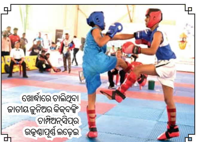
ଖୋର୍ଦ୍ଧାରେ ଚାଲିଥିବା ଜାତୀୟ କ୍ରୁର୍ ଅଥଲେଟିକ୍ସ ଚାମ୍ପିଅନସିପ୍ରେ ଉତ୍ତରାଖଣ୍ଡ ଲଢ଼େଇ