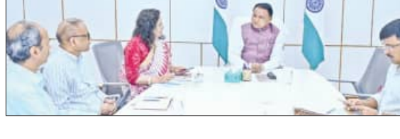
ଆସନ୍ତା ୨୦ ତାରିଖରେ ମୟୂରଭଞ୍ଜ ଜିଲ୍ଲା ରାଜରଙ୍ଗପୁର ଠାରେ ଅନୁଷ୍ଠିତ ହେବ ସ୍ୱତନ୍ତ୍ର କାର୍ଯ୍ୟକ୍ରମ। ଏହି କାର୍ଯ୍ୟକ୍ରମରେ ରାଷ୍ଟ୍ରପତି ଦ୍ରୌପଦୀ ମୂର୍ମୁ ଓ ପ୍ରଧାନମନ୍ତ୍ରୀ ନରେନ୍ଦ୍ର ମୋଦୀ ଯୋଗଦେବା ପାଇଁ ସ୍ୱୀକୃତି ଦେଇଛନ୍ତି। କାର୍ଯ୍ୟକ୍ରମ ସଫଳ ଆୟୋଜନ ପାଇଁ ଆଜି ଲୋକସଭା ଭବନରେ ମୁଖ୍ୟମନ୍ତ୍ରୀ

■ ଭୁବନେଶ୍ୱର / ରାଜରଙ୍ଗପୁର, ୨୬ (ସମିସ): ରାଜ୍ୟ ବିକେପି ସରକାରଙ୍କ ୨ ବର୍ଷ ପୂର୍ତ୍ତି ଅବସରରେ ବରିଷ୍ଠ ଅଧିକାରୀଙ୍କ ସହ ମୁଖ୍ୟମନ୍ତ୍ରୀଙ୍କ ଆଲୋଚନା