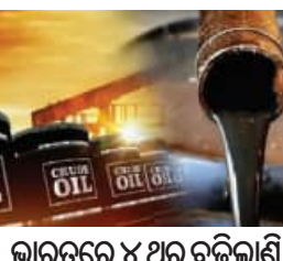
ଭାରତରେ ୪ ଥର ବଢ଼ିଲାଣି

■ ନୂଆଦିଲ୍ଲୀ, ୧୩।୬ (ଏକେନ୍ଦ୍ରି): ଅନ୍ତର୍ଜାତୀୟ ବଜାରରେ ଅଶୋଧିତ ତୈଳ ମୂଲ୍ୟରେ ବୃହତ ହ୍ରାସ ଘଟିଛି। ପଶ୍ଚିମ ଏସିଆରେ ଶାନ୍ତି ଆଣା ମଧ୍ୟରେ ଅଶୋଧିତ ତୈଳ ମୂଲ୍ୟ ଦ୍ରୁତ ଗତିରେ ହ୍ରାସ ପାଇ ତିନି ମାସର ସର୍ବନିମ୍ନ ସ୍ତରକୁ ଖସିଯାଇଛି। ବିଶ୍ଵ ବଜାରରେ ଅଶୋଧିତ ତୈଳ ମୂଲ୍ୟ ପ୍ରତି ବ୍ୟାରେଲ ୩୪୨୦ ଡଲାର ହ୍ରାସ ପାଇ ୮୪୨୯୦ ଡଲାରକୁ ଖସିଯାଇଛି। ତୈଳ ଦରରେ ହ୍ରାସର ଲାଭ କିନ୍ତୁ ଖାଉଟିଙ୍କୁ ମିଳିପାରିନାହିଁ। ବିଶ୍ଵ ବଜାରରେ ମହଙ୍ଗା ତେଲ ଦର ଯୋଗୁ ଭାରତରେ ପେଟ୍ରୋଲ ଏବଂ ଡିଜେଲ ମୂଲ୍ୟ ବଢ଼ିଯାଇଥିଲା। ହେଲେ ଏବେ ଦର କମିଯିବାବେଳେ ତେଲ କମ୍ପାନୀ ନିରବ। ଭାରତରେ ତୈଳ ବିପଣନକାରୀ କମ୍ପାନୀ(ଓଏମ୍ପି)