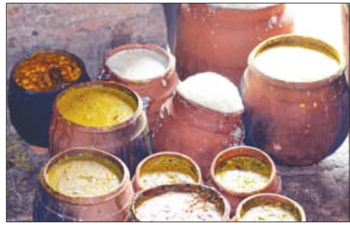
ପ୍ରାୟ ଦେଢ଼ବର୍ଷ ପରେ ଏହା ବନ୍ଦ ହୋଇଯାଇଥିଲା।

ପୁରୀ, ୧୩.୬ (ସମ୍ବିଧ): ଭକ୍ତଙ୍କୁ ବଣ୍ଟାଯିବ ମାରଣା ମହାପ୍ରସାଦ। ଆଜନ ମନ୍ତ୍ରୀ ପୃଥ୍ୱୀରାଜ ହରିଚନ୍ଦନଙ୍କ ଏପରି ଘୋଷଣାକୁ ଆଉ କିଛି ଦିନ ପରେ ୨ବର୍ଷ ପୂରିବ। ହେଲେ ଏଥାକୁ ଭକ୍ତଙ୍କୁ ମିଳିପାରିଲାନି ମାରଣା ମହାପ୍ରସାଦ। ତେବେ ଏ ଦିଗରେ ଅଧିକାରିତଙ୍କୁ ପୃଥ୍ୱୀରାଜ ମହାପ୍ରସାଦ ନିୟୋଗ। ରଥଯାତ୍ରା ପରେ ନିୟୋଗ ପକ୍ଷରୁ ଭକ୍ତଙ୍କୁ ଉତ୍ତର ଦ୍ୱାରରେ ମହାପ୍ରସାଦ ବଣ୍ଟନ କରାଯିବ ବୋଲି କହିଛନ୍ତି ନିୟୋଗ ସଭାପତି ନାରାୟଣ ମହାପ୍ରସାଦ।