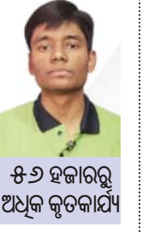
୫୬ ହଜାରରୁ ଅଧିକ କୃତକାର୍ଯ୍ୟ