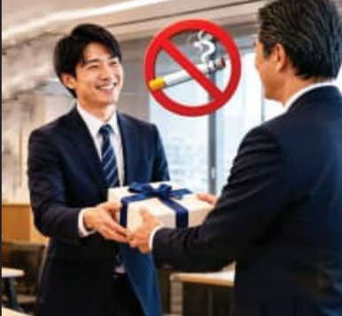
ସିଲ୍ଡ ଟାଙ୍କା ଓ ଆସ୍କାକା କହିବା ଅନୁଯାୟୀ, 'ସେ କର୍ମଚାରୀଙ୍କ ଉପରେ କୋରୋନାବିରୁଦ୍ଧ କୌଣସି ଜରିମାନା କିମ୍ବା ନିଷେଧାଦେଶ ନ ଲଗାଇ, ପୁରସ୍କାର ମାଧ୍ୟମରେ ସେମାନଙ୍କୁ ଭଲ ଅଭ୍ୟାସ ଆପଣାଇବାକୁ ଉତ୍ସାହିତ କରିବାକୁ ଚାହୁଁଥିଲେ ।' ଅନ୍ୟପଟେ ଜାପାନର ଏହି ପଦକ୍ଷେପ ବିଶ୍ଵର ଅନ୍ୟ କମ୍ପାନୀଗୁଡ଼ିକର ଦୃଷ୍ଟିଆକର୍ଷଣ କରିଛି । ଅନ୍ୟ କମ୍ପାନୀ ମଧ୍ୟ କର୍ମଚାରୀଙ୍କୁ ସ୍ଵାସ୍ଥ୍ୟକର ଜୀବନଶୈଳୀ ଆପଣାଇବା ଲାଗି ଅଲଗା ଅଲଗା ପ୍ରକାର ପ୍ରୋତ୍ସାହନ ଦେବା ଆରମ୍ଭ କରିଛନ୍ତି । କେଉଁଠି ପିଠୁନେମ୍ ବୋନସ୍ ପ୍ରଦାନ କରାଯାଇଛି ତ ଆଉ କେଉଁଠି ସ୍ଵାସ୍ଥ୍ୟ ସମ୍ବନ୍ଧିତ ଲକ୍ଷ୍ୟକୁ ପୂରା କରିବା ଲାଗି ଅତିରିକ୍ତ ସୁବିଧା ଦିଆ ଯାଉଛି ।

ଆଜିକାଲି କମ୍ପାନୀଗୁଡ଼ିକ କର୍ମଚାରୀଙ୍କ ସ୍ଵାସ୍ଥ୍ୟ ତଥା କାର୍ଯ୍ୟ ଦକ୍ଷତାକୁ ଉନ୍ନତ କରିବାକୁ ନୂଆ ନୂଆ ନୀତି ଆପଣାଉଥିବାର ଦେଖାଯାଇଛି । ଏହି କ୍ରମରେ ଜାପାନର ମାଟେଟି କମ୍ପାନୀ ପିଆଲା ଇଙ୍କ ମୁଖ୍ୟତଃ ଏହାର 'ନନ୍-ସ୍ମୋକର୍ସ ପେଡୁ ଲିଭ' ନୀତି ପାଇଁ ବିଶ୍ଵାସୀ ପର୍ଯ୍ୟନ୍ତ । କମ୍ପାନୀ ଏହି ନିୟମ ୨୦୧୭ ମସିହାରେ ଆଣିଥିଲା । ନିୟମ ଅନୁଯାୟୀ, କମ୍ପାନୀରେ ଧୂମପାନ କରୁ ନ ଥିବା କର୍ମଚାରୀଙ୍କୁ ପ୍ରତିବର୍ଷ ୩ଟି ଅତିରିକ୍ତ ଛୁଟି ମିଳିଥାଏ । ଏହି କମ୍ପାନୀର କାର୍ଯ୍ୟାଳୟ ୨୯୯୯ ମହଲରେ ଥିବା, ଧୂମପାନ କରୁଥିବା କର୍ମଚାରୀମାନେ ତଳକୁ ଯିବା ଆସିବା କରିବାରେ ପ୍ରତିପଦ ପ୍ରାୟ ୧୫ ମିନିଟ୍ ସମୟ ନେଉଥିଲେ । ଏହି ସମୟକୁ ନଷ୍ଟ ନ କରିବା ପାଇଁ କର୍ମଚାରୀଙ୍କୁ ୩ ଦିନର ଅତିରିକ୍ତ ଛୁଟି ପ୍ରଦାନ କରାଯାଏ । ସେହିଭଳି ଧୂମପାନ କରୁଥିବା କର୍ମଚାରୀମାନେ ବାରମ୍ବାର 'ସ୍ମୋକିଂ ବ୍ରେକ୍' ନେଇଥାନ୍ତି, ଯାହାଫଳରେ ନନ୍-ସ୍ମୋକର୍ କର୍ମଚାରୀଙ୍କ ଉପରେ କାମର ଚାପ ବଢ଼ିଥାଏ । ଏହି ନିୟମ ଲାଗୁ ହେବା ପରେ କମ୍ପାନୀରେ ଏକ ବଡ଼ ସୁଧାର ଦେଖିବାକୁ ମିଳିଥିଲା । କମ୍ପାନୀ ଏହି ନୀତି ଆରମ୍ଭ କରିବା ପରେ ଅନେକ ଧୂମପାନ କରୁଥିବା କର୍ମଚାରୀ ଅତିରିକ୍ତ ଛୁଟି ପାଇବା ଆଶାରେ ସିଗାରେଟ୍ ଛାଡ଼ିବାକୁ ନିଷ୍ପତ୍ତି ନେଇଥିଲେ । ଏନେଇ କମ୍ପାନୀର