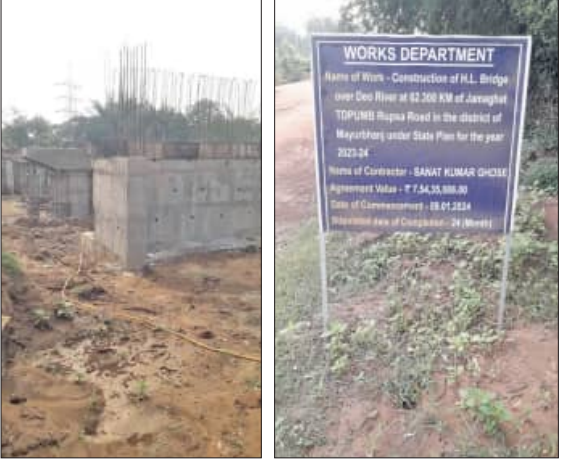
ବନ୍ୟା ଜଳ ପୋଲକୁ ଯୋଗ ନେଇଥିଲା। ପଲରେ ଜନସାଧାରଣ ଦୀର୍ଘ ୪ ବର୍ଷ ଧରି ନାନା ଅସୁବିଧାରେ ସମ୍ମୁଖୀନ ହେଉଛନ୍ତି। ବର୍ଷାରେ ପଲକୁ

ଉଦଳାକୁ ଜମିଦାର ଦେଇ ବାଲେଶ୍ଵରରେ ରେମୁଣା ଓ କୁଆମରା ହୋଇ ବୈଶିଙ୍ଗାକୁ ଫାସୋଗ କରୁଥିବା ପୂର୍ବ ବିଭାଗ ରାସ୍ତାରେ ଦେଓ ନଦୀ ଉପରେ ଜାମୁୟାଟ ସେତୁ ୨୦୨୨ ଜୁନ ମାସରେ ଭୁବନେଶ୍ଵର ପଡ଼ିବାକୁ ଯୋଗାଯୋଗର ବାଧା ଉଠିବ ବୋଲି ଅନୁମିତ। ଚେପେ ଏହି ପୋଲ ପୂର୍ବ ବିଭାଗ ଦ୍ଵାରା ୨୦୨୪ରେ ୬ କୋଟି ୫୪ ଲକ୍ଷ ୩୫ ହଜାର ଟଙ୍କା ଅର୍ଥ ବ୍ୟୟ ଅଟକଳ ମଧ୍ୟରେ ହେବା ପରେ କାର୍ଯ୍ୟ ଆରମ୍ଭ ହୋଇଥିଲା। କାମ ଶେଷ କରାଯିବାକୁ ୨୦୨୬ ଜାମୁୟାଟ ଥିବାବେଳେ ଅବଧୂର ୬ ମାସ ବିଚ୍ଛିନ୍ନ, ତଥାପି କାର୍ଯ୍ୟ ୩୦ ପ୍ରତିଶତ ବାକି ରହିଛି। ମୌସୁମୀ ଆଗମନ, ଆଗକୁ ବର୍ଷା ଉଡ଼ୁଥିବା ଏହା ଅଞ୍ଚଳବାସୀଙ୍କୁ ପୁଣି ଚିନ୍ତାରେ ପକାଇଛି। ପଲରେ ପୁଣି ବୈଶିଙ୍ଗା-ଉଦଳା ଓ ଉଦଳା-ରେମୁଣା ରାସ୍ତାରେ ଯୋଗାଯୋଗ ବିଚ୍ଛିନ୍ନ ହେବ। ଠିକାଦାରଙ୍କ ମନମୁଖା କାର୍ଯ୍ୟକୁ ନେଇ ଅଞ୍ଚଳବାସୀଙ୍କ ପକ୍ଷରୁ ଶେଷ ପ୍ରକାଶ ପାଇଛି। ୨୦୨୨ରେ ପୋଲ ଭୁବନେଶ୍ଵରୀଠାରୁ କୁମାରୀ ୪ ବର୍ଷ ଧରି ଉତ୍ତର ପାଶ୍ଚାତ୍ୟ ଅଞ୍ଚଳରେ ପୋଲ (ଭାଇଭୋର) ନିର୍ମାଣ କରାଯାଇଥିବା ଅଞ୍ଚଳରେ ୬ ମାସ ଯୋଗାଯୋଗ ହୋଇଥିଲା। ମାତ୍ର ବର୍ଷାରେ ଅଧିକେ