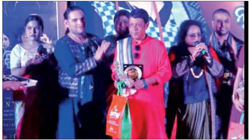
ଆନନ୍ଦପୁର: ଏକାମ୍ର ହାଟ' ସାଂସ୍କୃତିକ ମଞ୍ଚରେ ସଜରେ ସଜରେ ରଜ କାର୍ଯ୍ୟକ୍ରମରେ ଆନନ୍ଦପୁରର ବାଣୀପାଣି କଳା ନିକେତନ ନୃତ୍ୟ ଶିଳ୍ପୀଙ୍କୁ ନୃତ୍ୟ ଓ ଜଣାଶୁଣା ଧଳାକ ଫାଗାଟ ପରିବେଷଣ ।

ଅନ୍ୟାନ୍ୟ ସ୍ଥାନରେ ରଜପର୍ବ ଜାକଜମକରେ ପାଳିତ ହେଉଛି । ଗ୍ରାମର ପୂଜାରୀ ଦୋଳି ପାଖେନାରେ ମୂର୍ତ୍ତି ସ୍ଥାପନ କରି ପୂଜାପାଠ କରି ରଜଦୋଳି ଶୁଭାରମ୍ଭ କରିଥିବାବେଳେ ମଝି ରଜ ଦିନ ରଜବତୀକୁ କନିଆ ଦେଖିବା ପାଇଁ ଗ୍ରାମ ପରିକ୍ରମା କରିଥାନ୍ତି ।