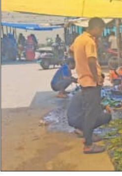
ରୁପଲର ଚିକେନ କିଲୋ ପ୍ରତି ୨୫୦ ଟଙ୍କା, ଦେଶୀ ଚିକେନ ୬୦୦/୬୦୦ ସମେତ ସୋମବାର ରଜଫଳାନ୍ତି ଛୁଟି ଥିବାରୁ ବାହାରେ ଥିବା ବାକିରିଆ ଘରକୁ ଯେଉଁଠି ସେମାନେ ପରିବାର

ବାରିପଦା, ୧୪।୬ (ସମିପ): ସାରା ରାଜ୍ୟରେ ରଜପର୍ବକୁ ନେଇ ଉତ୍ସାହରେ ମାହୋଳ ରହିଛି। ସବୁଠି ଧୂମଧାମରେ ରଜ ପର୍ବକୁ ଲୋକେ ପାଳନ କରୁଛନ୍ତି। ରବିବାର ଆମିଷ ବାରରେ ପହିଲି ରଜ ପଡ଼ିଥିବାରୁ ଆମିଷ ବଜାରରେ ଭିଡ଼ ଜମିଛି। ସୋମବାର ଫଳାନ୍ତି ଥିବାରୁ ଲୋକେ ଆମିଷ ଖାଇବେ ନାହିଁ, ତେଣୁ ରବିବାର ପହିଲି ରଜକୁ ନେଇ ଭିଡ଼ ହୋଇଛି। ଆମିଷ ବଜାରରେ ମାଛ ଓ ମାଂସ ବର ମଧ୍ୟ କିଛି ମାତ୍ରରେ ଦୃଷ୍ଟି ପାଇଛି। ବାରିପଦା ସହରର କଟେରା ପରିବା ମାର୍କେଟ, ପୁଲିସ ଲାଇନ, ପୋତା ଅସ୍ଥିଆ ସମେତ ଅନ୍ୟାନ୍ୟ ସ୍ଥାନରେ ଥିବା ଆମିଷ ବୋକାଳରେ ସକାଳୁ ସକାଳୁ ଲୋକଙ୍କ ପ୍ରବଳ ଗହଳ ରହିଥିଲା। ବିତୀକ୍ଷା ଶିବିରରେ ଓ ରବିବାର ସମେତ ସୋମବାର ରଜଫଳାନ୍ତି ଛୁଟି ଥିବାରୁ ବାହାରେ ଥିବା ବାକିରିଆ ଘରକୁ ଯେଉଁଠି ସେମାନେ ପରିବାର