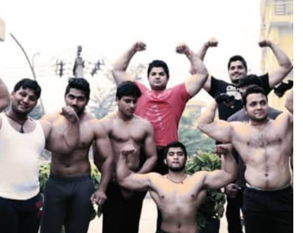
ପାଇବାକୁ ଅଳ୍ପକେ ବଞ୍ଚିତ ହୋଇଥିଲେ । ପରେ ସେ ଜଣେ ବାଉଁଶର ଭାବେ ନିଜ ଜୀବିକା ନିର୍ବାହ କରିଥିଲେ । ତାଙ୍କ ସଫଳତା ଗାଁର ଅନ୍ୟ ଲୋକଙ୍କୁ ପ୍ରେରଣା ଦେଇଥିଲା । ସେମାନେ ମଧ୍ୟ ବାଉଁଶର ଭାବେ କାର୍ଯ୍ୟ କରି ନିଜ ଶାରୀରିକ ଶକ୍ତିକୁ ଜୀବିକାରେ ପରିଣତ କରିବାକୁ ନିଷ୍ପତ୍ତି ନେଇଥିଲେ ।