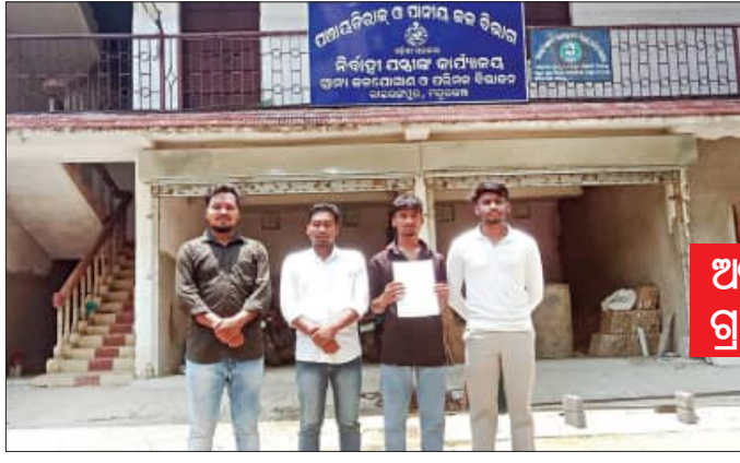
ଅସହ୍ୟ ଗରମରେ ନଜାଳଶିଳା ଗ୍ରାମବାସୀ ପାଣି ପାଇଁ ହତସ୍ତ

ଗ୍ରାମର ବିକାଶକୁ ନେଇ ତିନିମାସ ପୂର୍ବରୁ ବିକେମି ସରକାରରେ ଗ୍ରାମର ପାନୀୟଜଳ ସମସ୍ୟା ଥିବାବେଳେ ନୂଆଁ ୪୦ ଡିଗ୍ରୀର ଅସହ୍ୟ ଗ୍ରୀଷ୍ମ ପ୍ରବାହରେ ଗ୍ରାମବାସୀ ପାଣି ଚୋପାଏ ପାଇଁ ହତସ୍ତ ହେଉଛନ୍ତି। ଏକଳ ସମସ୍ୟା ବାମନଦାଟି ଉପଖଣ୍ଡର କୁସୁପା ବ୍ଲକ୍