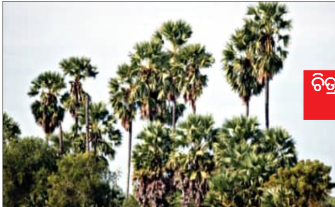
ଚିତ୍ରତ୍ୱ ଓ ହଳଦୀପାଳ ଅଞ୍ଚଳରେ ଗୋଟାଏ ବି ନାହିଁ ଗଛ