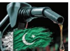
କ୍ରମାଗତ ୫ ଥର କମିଲା ପେଟ୍ରୋଲ-ଡିଜେଲ ଦର ଭାରତରେ ୪ ଥର ବଢ଼ିଲାଣି

■ ନୂଆଦିଲ୍ଲୀ, ୧୩।୬ (ଏକେଡି): ଅନ୍ତର୍ଜାତୀୟ ତୈଳ ବଜାରରେ ଅଶୋଧିତ ତୈଳ ମୂଲ୍ୟରେ ବୃହତ ହ୍ରାସ ଘଟିଛି । ପଶ୍ଚିମ ଏସିଆରେ ଶାନ୍ତି ଆଶା ମଧ୍ୟରେ ଅଶୋଧିତ ତୈଳ ମୂଲ୍ୟ ଦ୍ରୁତ ଗତିରେ ହ୍ରାସ ପାଇ ତିନି ମାସର ସର୍ବନିମ୍ନ ସ୍ତରକୁ ଖସିଆସିଛି । ତୈଳ ଦରରେ ଏହି ହ୍ରାସ ଭାରତ ପାଇଁ ବଡ଼ ଆଶ୍ଚର୍ଯ୍ୟ ଆଣିଛି, ଯେ କି ବହୁ ପରିମାଣରେ ଅଶୋଧିତ ତୈଳ ଆମଦାନୀ କରିଥାଏ । ଆଜି କମୋଡିଟି ବଜାରରେ ଅଶୋଧିତ ତୈଳ ମୂଲ୍ୟ ଏକ ବଡ଼ ବିପର୍ଯ୍ୟୟର ସମ୍ମୁଖୀନ ହୋଇଛି । ଅଶୋଧିତ ତୈଳ ମୂଲ୍ୟ ପ୍ରତି ବ୍ୟାରେଲ ୩୪୨୦ ଡଲାର ହ୍ରାସ ପାଇ ୮୪୨୦ ଡଲାରକୁ ଖସିଆସିଛି । ଏହି ହ୍ରାସ ବିଶ୍ୱବ୍ୟାପୀ