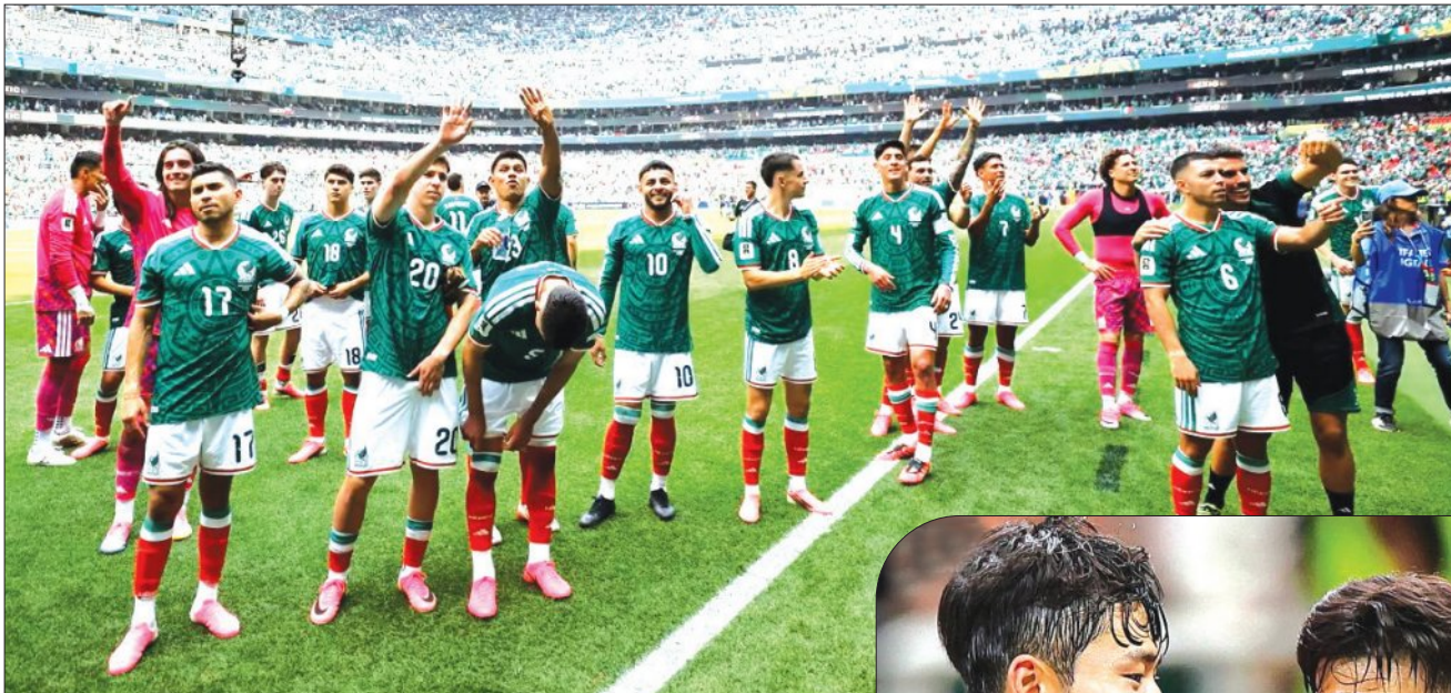
ମେକ୍ସିକୋ ବିଜିତ, ୧୨.୧୨ (ଏକେଡ଼ି)

ମୁଗୁଆୟୋକ ମେକ୍ସିକୋ ଏବଂ ଦକ୍ଷିଣ କୋରିଆ ୨୩ତମ ଫିଫା ବିଶ୍ୱକପର ଉଦଘାଟନା ଦିବସରେ ବିଜୟ ହାସଲ କରିଛନ୍ତି। ମେକ୍ସିକୋ ବିଜିତରେ ଖେଳାଯାଇଥିବା ଉଦଘାଟନା ମୁକାବିଲାରେ ମେକ୍ସିକୋ ୨-୦ ଗୋଲରେ ଦକ୍ଷିଣ ଆଫ୍ରିକାକୁ ପରାସ୍ତ କରିଛି। ବିଜୟୀ ଦଳ ପକ୍ଷରୁ ଲୁଇଆନ୍ କ୍ରିନୋନ୍ସ ଓ ରେଟେରାନ ଷ୍ଟାଲକର ରଲ କିନିନେଜ୍ ଗୋଟିଏ ଲେଖାଏଁ ଗୋଲ ଘୋର କରିଥିଲେ। ଦଳ ଏହି ବିଜୟ ସହ ଗ୍ରୁପ୍-ଏର ପ୍ରଥମ ଲିଗ ମୁକାବିଲାରେ ପୁରା ୩ ପଏଣ୍ଟ ପାଇଛି।