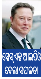
ସ୍ୱେସ୍‌ସ୍କ ଆଇପିଓ ଦେଲି ସଫଳତା

■ ଖଞ୍ଜିଟ୍, ୧୨.୬ (ଏକେସ୍): ବିଶ୍ୱର ସବୁଠାରୁ ଧନୀ ବ୍ୟକ୍ତି ଏଲନ୍ ମସ୍କ ହୋଇଛନ୍ତି ବିଶ୍ୱର ପ୍ରଥମ ଟ୍ରିଲିୟନେୟାର ବା ଖବରପତ୍ର। ତାଙ୍କର ରକେଟ୍ ଏବଂ ସାଟେଲାଇଟ୍ କମ୍ପାନୀ ସ୍ପେସ୍ ଏକ୍ସପ୍ଲୋରେଟିଭ୍ ୧.୧ ବିଲିୟନ ଡଲାରର ଆଇପିଓ ଆସିବା ପରେ ମସ୍କ ଟ୍ରିଲିୟନେୟାର ପାଲଟିଛନ୍ତି।