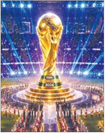
କାନାଡାରେ ମଧ୍ୟ ଏକ ସଙ୍ଗେ ଉତ୍ସବର ଆୟୋଜିତ ହେବାର କାର୍ଯ୍ୟକ୍ରମ ରହିଛି। ପ୍ରଖ୍ୟାତ ଗାୟିକା ସାଲିବା ଉଦ୍‌ଘାଟନା ଉତ୍ସବର ମୁଖ୍ୟ ଆକର୍ଷଣ ସାଜିବେ। କାନାଡାରେ ଚରଣେ ଓ ଆମେରିକାରେ ମଧ୍ୟ ଉଦ୍‌ଘାଟନା ଉତ୍ସବର କାର୍ଯ୍ୟକ୍ରମ ଅନୁଷ୍ଠିତ ହେବ।

■ ମେକ୍ସିକୋ ସିଟି, ୧୦।୬ (ସମ୍ବେଦ): ଫିଫା ବିଶ୍ୱକପ ପ୍ରତିଯୋଗିତା ଆରମ୍ଭ ହେବ। ବିଶ୍ୱର ଏହି ସର୍ବାଧିକ ଲୋକପ୍ରିୟ ପ୍ରତିଯୋଗିତାକୁ ପ୍ରଥମଥର ଗର୍ବ ଦେଖି ପୁରୁଣା ଆମେରିକା, ମେକ୍ସିକୋ ଏବଂ କାନାଡା ମିଳିତ ଭାବେ ଆୟୋଜନ କରୁଛନ୍ତି। କୁନ୍ ୧୯୯୯ ଏହି ପ୍ରତିଯୋଗିତା ଆରମ୍ଭ ହୋଇ କୁଲାଇ ୧୯୯୯ରେ ଶେଷ ହେବ। ଏହି ସଂସ୍କରଣରେ ମଧ୍ୟ ସର୍ବାଧିକ ୪୮ଟି ଦେଶ ଅଂଶଗ୍ରହଣ କରୁଥିଲେବେଳେ ସର୍ବାଧିକ ୧୦୪ଟି ମ୍ୟାଚ୍ ଗର୍ବ ଦେଖିବେ। ୧୬ଟି ଖ୍ରୀଷ୍ଟିୟନ ଖେଳାୟିତାଙ୍କ କାର୍ଯ୍ୟକ୍ରମ ପ୍ରସ୍ତୁତ ହୋଇଛି। ଏହା ମଧ୍ୟରୁ ଆମେରିକାର ସର୍ବାଧିକ ୧୧ଟି ଭେକ୍ସିକୋ ପାଇନାଲ ଓ କାର୍ଡିନାଲ୍‌ସ୍ ପରଠାରୁ ସମସ୍ତ ନୂଆଦେଶ ମ୍ୟାଚ୍ ସମେତ ମୋଟ ୬୮ଟି, ଅନ୍ୟ ଦୁଇ ସହ ଆୟୋଜକ ଦେଶ ୧୩ଟି ଲେଖାଏଁ ମ୍ୟାଚ୍ ଆୟୋଜନ କରିବେ। କୁଲାଇ ୧୯୯୯ ଚାରିଟି ରାତି ୧୨ଟା ୩୦ ମିନିଟ୍ରେ ପାଇନାଲ ପ୍ରକାଶିତ ହେବ। କୁନ୍ ୧୯୯୯ ଫେଡ୍ରେଲ୍ ଖ୍ରୀଷ୍ଟିୟନ ଖେଳାୟିତା ଭାବରେ ମ୍ୟାଚ୍ ଗୁଡ଼ିକର ସିଧାସଳଖ ପ୍ରସାରଣ କା ଏକ୍ସପ୍ରେସ୍‌ମେଣ୍ଟ୍ ନେଟୱାର୍କରେ ପ୍ରସାରଣ କରାଯିବ। କା ରିଲି ପକ୍ସରୁ ଯୁନିଟ୍-୮-୧୧୧୯ ନାମରେ ୪ଟି ଚ୍ୟାନେଲ୍ ହିସାବରେ ଉପଲବ୍ଧ ହେବ। ଆୟୋଜକ ଦେଶ ଗୁରୁତ୍ୱପୂର୍ଣ୍ଣ ଭାବେ ମେକ୍ସିକୋ ସିଟିରେ ଭାରତୀୟ ସମୟ ରାତି ୧୦ଟା ୩୦ ମିନିଟ୍ରେ ଦେବୁ ଘଣ୍ଟା ଲାଗି ରଙ୍ଗାଭଙ୍ଗ ଉଦ୍‌ଘାଟନା ଉତ୍ସବର ଆୟୋଜନ କରାଯାଇଛି। ଆମେରିକା ଓ କାନାଡାରେ ମଧ୍ୟ ଏକ ସଙ୍ଗେ ଉତ୍ସବର ଆୟୋଜିତ ହେବାର କାର୍ଯ୍ୟକ୍ରମ ରହିଛି। ପ୍ରଖ୍ୟାତ ଗାୟିକା ସାଲିବା ଉଦ୍‌ଘାଟନା ଉତ୍ସବର ମୁଖ୍ୟ ଆକର୍ଷଣ ସାଜିବେ। କାନାଡାରେ ଚରଣେ ଓ ଆମେରିକାରେ ମଧ୍ୟ ଉଦ୍‌ଘାଟନା ଉତ୍ସବର କାର୍ଯ୍ୟକ୍ରମ ଅନୁଷ୍ଠିତ ହେବ।