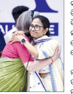
ସହଯୋଗୀ ଥିବା ନେତାମାନେ ବିପଦ ସମୟରେ ତାଙ୍କୁ ଛାଡ଼ିଦେଇ ବିରୋଧୀ ଶିବିରରେ ମିଶିବାରେ ଲାଗିଛନ୍ତି। ଏଥିରେ ହତାଶ ହୋଇ ସେ କଂଗ୍ରେସରେ ମିଶିବା ଲାଗି ଯୋଜନା କରୁଥିବା କୁହାଯାଉଛି। ରାଜନୀତିରେ କିଛି ଅସମ୍ଭବ ନାହିଁ। ରାଜନୀତିରେ ତିର ଦିନ ପାଇଁ କେହି ଶତ୍ରୁ କି ମିତ୍ର ନାହାନ୍ତି। ଗତ ଏକ ମାସ ମଧ୍ୟରେ ଟିଏମ୍‌ସିକୁ ନେଇ ଯାହା ସବୁ ଘଟିଯାଉଛି, ତାହା ଏହି ଉକ୍ତିକୁ ସତ ପ୍ରମାଣିତ କରିବାରେ ଲାଗିଛି। କଂଗ୍ରେସରୁ ନିଜର ରାଜନୈତିକ ଜୀବନ ଆରମ୍ଭ କରିଥିବା ମମତା ବାନାର୍ଜୀ ୧୯୯୭ରେ କଂଗ୍ରେସ ସହ ସଂଘର୍ଷ ଛିନ୍ନ କରି ଟିଏମ୍‌ସି ଗଠନ କରିଥିଲେ। ଦୀର୍ଘ ୧୫ ବର୍ଷ ଧରି

■ ନୂଆଦିଲ୍ଲୀ, ୧୦।୬ (ଏକ୍ସପ୍ରେସ୍): ମମତା ବାନାର୍ଜୀଙ୍କ ଘର ବାହୁଡ଼ା ହେବ କି? ୧୯୯୮ରେ ଗଠିତ ଚୁଣମୁଳ କଂଗ୍ରେସ ବା ଟିଏମ୍‌ସି କଣ କଂଗ୍ରେସରେ ମିଶିବ? ସଂପ୍ରତି ଏଭଳି ଅନେକ ପ୍ରଶ୍ନ ଜାତୀୟ ରାଜନୀତିକୁ ସରଗରମ କରି ରଖିଛି। ଦୀର୍ଘ ୨୮ ବର୍ଷ ଧରି ପଶ୍ଚିମ ବଙ୍ଗ ରାଜନୀତିରେ ଛାଇ ହୋଇ ରହିଥିବା ମମତା ବାନାର୍ଜୀଙ୍କୁ ନେଇ ଅନେକ କଳ୍ପନାଜଗନ୍ନା ଲାଗି ରହିଛି। କୁମ୍ଭାଙ୍ଗ ୧୫ ବର୍ଷ ଧରି ମୁଖ୍ୟମନ୍ତ୍ରୀ ଥିବା ମମତା ହାରିଯିବା ପରେ ତାଙ୍କ ବିରୋଧରେ ଦଳ ଭିତରେ ଏମିତି ବିଦ୍ରୋହ ହେବ ବୋଲି କେହି କେବେହେଲେ କଳ୍ପନା କରିନଥିଲେ। ଗତ ୨୮ ବର୍ଷ ଧରି ତାଙ୍କର ଅତି ଘନିଷ୍ଠ ଓ ନିର୍ଭରଯୋଗ୍ୟ