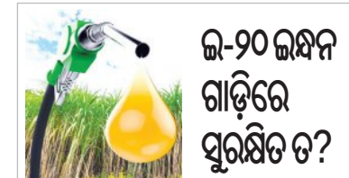
ଅବା ବେଳେ ଏହା ଇ-୮୫ରେ ଚାଲିପାରିବ ତ? ଇ-୨୦ ପେଟ୍ରୋଲ ଗାଡ଼ିକୁ ନେଇ ସେମାନଙ୍କର ଚିନ୍ତା ବଢ଼ିଲାଣି। ସୂଚନାଯୋଗ୍ୟ ଯେ ଇ-୮୫ ଇନ୍ଦ୍ରନି ହେଉଛି ଏକ ସ୍ୱତନ୍ତ୍ର ପ୍ରକାର ପେଟ୍ରୋଲ

■ ନୂଆଦିଲ୍ଲୀ, ୧୦।୬ (ଏକ୍ସପ୍ରେସ୍): ସମ୍ପ୍ରତି ଇ-୮୫ ଇନ୍ଦ୍ରନିକୁ ନେଇ ସାରା ଦେଶରେ ଚର୍ଚ୍ଚା ହେଉଛି। ଏହି ନୂଆ ଇନ୍ଦ୍ରନି କେବଳ ପରିବେଶ ଅନୁକୂଳ ହେବ ନାହିଁ, ବରଂ ଲୋକଙ୍କ ଖର୍ଚ୍ଚ ମଧ୍ୟ କମ୍ କରିବ। ଏହା ବର୍ତ୍ତମାନର ଇ-୨୦ ଇନ୍ଦ୍ରନି ଅପେକ୍ଷା ଲିଟର ପିଛା ୨୦ ଟଙ୍କା ଶୁଣ୍ଠା ହେବ। ଅର୍ଥାତ୍ ଏହାର ମୂଲ୍ୟ ବର୍ତ୍ତମାନ ପ୍ରଚଳିତ ପେଟ୍ରୋଲ ତୁଳନାରେ ୨୦ ଟଙ୍କା କମ୍। ଦିଲ୍ଲୀରେ ପ୍ରଚଳନ ହୋଇଥିବା ଏହି ଇନ୍ଦ୍ରନିକୁ ନେଇ ସରକାର ଏଭଳି ଯୁକ୍ତି ବାହୁଡ଼ିବା ବେଳେ ଗାଡ଼ି ମାଲିକ କିନ୍ତୁ ଚିନ୍ତାରେ। ସେମାନଙ୍କର ଗାଡ଼ି ଇ-୨୦ ପେଟ୍ରୋଲ ଅନୁକୂଳ