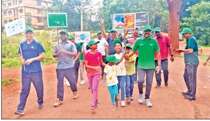
କେନ୍ଦୁଝର/ବଡ଼ବିଲ, ୮.୧ (ସମ୍ବିଧ)

ଜିନ୍ଦଲ ଷ୍ଟିଲ୍ ପକ୍ଷରୁ ବଡ଼ବିଲ ପେଲେଟ୍ ପ୍ଲାଣ୍ଟ, କାଶିଆ ଓ ଟେନ୍ସା ମାଲ୍‌ହୁରେ ବିଶ୍ଵ ପରିବେଶ ଦିବସ ପାଳିତ ହୋଇଯାଇଛି । ଏହି ଅବସରରେ ବ୍ୟାପକ ବୃକ୍ଷରୋପଣ ଓ ସଚେତନତା କାର୍ଯ୍ୟକ୍ରମ ଅନୁଷ୍ଠିତ ହୋଇଥିଲା । ବିଶ୍ଵ ପରିବେଶ ଦିବସ ଅବସରରେ ଜିନ୍ଦଲ ଷ୍ଟିଲର ଅଧ୍ୟକ୍ଷ ତଥା କୁରୁକ୍ଷେତ୍ର ସଂସଦ ନବାନ ଜିନ୍ଦଲ ଯୋସିଆଇ ମିଡିଆରେ ଶୁଭେଚ୍ଛା ଜଣାଇବା ଅବସରରେ କହିଛନ୍ତି, ଭବିଷ୍ୟତ ପିଢ଼ି ପାଇଁ ଆମେ ଅବସରରେ କେମିତି ପୃଥିବୀ ଛାଡ଼ିଯିବୁ, ତାହା କେବଳ ଆମେ