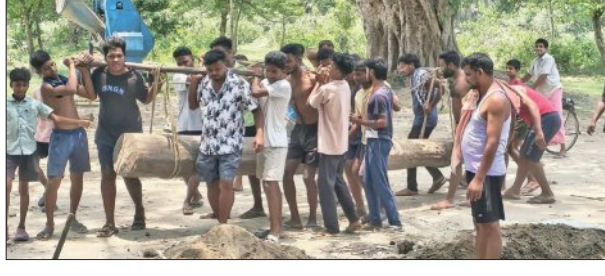
ଆନନ୍ଦପୁର, ୮.୧ (ସମ୍ବିଧ): ଯଦିପୁରା ବୁକ୍ ଭଣ୍ଡାରିଡିହା ପଞ୍ଚାୟତ ନରସିଂହପୁର ଗ୍ରାମର ପ୍ରସିଦ୍ଧ ରଜ ଉତ୍ସବ ପାଳନ ପାଇଁ ପ୍ରସ୍ତୁତି ଆରମ୍ଭ ହୋଇଛି । ବଜରଙ୍ଗବାଲି