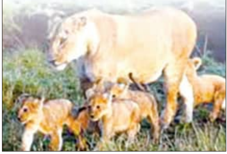
ପେରିବେ । ସିଂହମାନଙ୍କ ସୁସ୍ଥ ପାଇଁ ଆଖ୍ୟାୟ ଅଞ୍ଚଳର ପ୍ରାୟ ୬୦୦ ସିଂହଙ୍କୁ ପରଜାବା ମୁକ୍ତ ଅର୍ଥାତ୍ ତିଆରି କରାଯାଇଛି ।