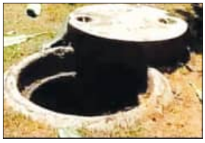
ନିୟମର ଉଲ୍ଲଙ୍ଘନ ଏବଂ କାହାର ଅବହେଳା ଯୋଗୁଁ ଏହି ଦୁର୍ଘଟଣା ଘଟିଲା, ଯେ ନେଇ ପୋଲିସ୍ ସିଭିଲିଟି ପୁଡ଼େନ୍ସ ଯାଞ୍ଚ କରିବା ସହ ଏକ ଅପମୃତ୍ୟୁ ମାମଲା ରୁଜୁ କରି ଅଧିକ ତଦନ୍ତ ଚଳାଇଛି ।

ସୁରଟ, ୭।୬ (ଏକେଡ଼ି): ଗୁଜରାଟର ସୁରଟ ସହରରେ ରବିବାର ସକାଳେ ଏକ ଆବାସନୀୟ ଘଟଣା ଘଟିଛି । ଅଗ୍ନିଶମ କୁମାର ଅଞ୍ଚଳରେ ଥିବା ଏକ ଅଳଙ୍କାର ନିର୍ମାଣ କାରଖାନାର ସେପ୍ଟିକ୍ ଟାଙ୍କି ସଫା କରିବାକୁ ଭିତରକୁ ଯିବାବେଳେ ୪ ଜଣଙ୍କ ମୃତ୍ୟୁ ଘଟିଥିବା ଜଣାପଡ଼ିଛି । ସୁରଟର ସୁପରଭାଇକରଙ୍କର ବିଷାକ୍ତ ଗ୍ୟାସ୍ ଗ୍ୟାସ୍‌ରୁ ହେବା ଯୋଗୁଁ ମୃତ୍ୟୁ ଘଟିଛି । ପୋଲିସ୍ ଡିଭିଜନ୍ ଆଲୋକ କୁମାରଙ୍କ ସୂଚନା ଅନୁଯାୟୀ, ପ୍ରାଥମିକ ସୂଚନାରୁ ଜଣାପଡ଼ିଛି ଯେ ଶ୍ରମିକମାନେ କୌଣସି