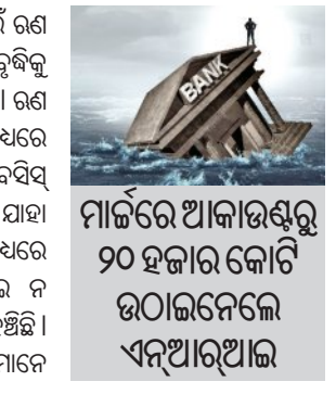
ମାର୍କେଟର ଆକାଉଣ୍ଟରୁ ୨୦ ହଜାର କୋଟି ଉଠାଇନେଲେ ଏନଆରଆଇ

■ ନୂଆଦିଲ୍ଲୀ, ୪।୬ (ଏକେଡି): ଭାରତୀୟ ବ୍ୟାଙ୍କଗୁଡ଼ିକ ବର୍ତ୍ତମାନ ଏକ ଘଟଣାକୁ ମୁହାଁ ଦେଇ ଗତି କରୁଛନ୍ତି। ଗୋଟିଏ ପର୍ଯ୍ୟନ୍ତ ବ୍ୟାଙ୍କର କ୍ରେଡିଟ୍ ବା ରଣ ରେକର୍ଡ ଉନ୍ନତ ହେବାବେଳେ, ଅନ୍ୟପର୍ଯ୍ୟନ୍ତ ଜମା ଅଭିଭୂକ୍ତି ପଛରେ ପଡ଼ିଛି। ଭାରତୀୟ ରିଜର୍ଭ ବ୍ୟାଙ୍କ (ଆର୍ବିଆଇ)ର ସଦସ୍ୟ ଡାକ୍ ଡିସର୍ ଅନୁଯାୟୀ, ମେ ୧୫ ପର୍ଯ୍ୟନ୍ତ ବର୍ଷିକ ମଧ୍ୟରେ ବ୍ୟାଙ୍କ ରଣ ୧୬.୨ ପ୍ରତିଶତ ହାରରେ ବୃଦ୍ଧି ପାଇଛି, ଯାହା ଗତ ଦୁଇ ବର୍ଷ ମଧ୍ୟରେ ସର୍ବାଧିକ। ଏହି ସମୟରେ କୁମାରତ