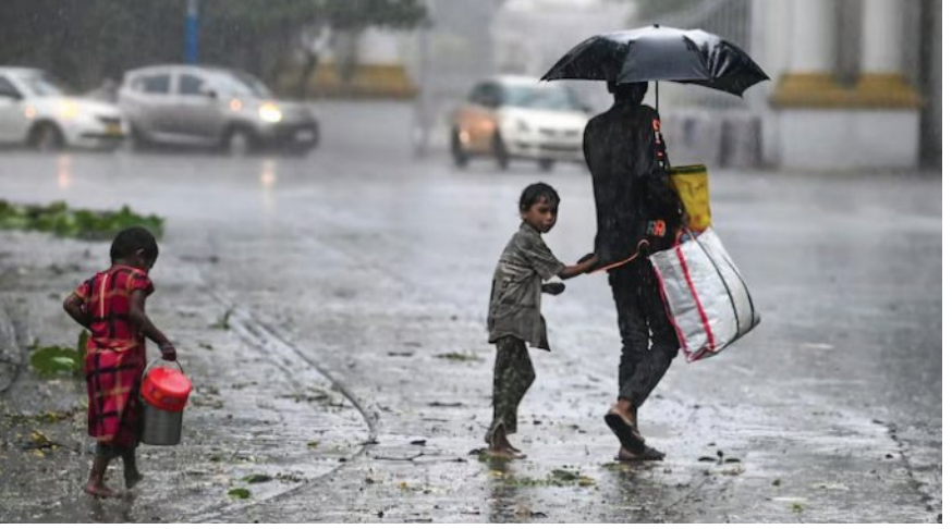
କେରଳର ଅଳ୍ପପାଣି, କୋଟାୟମ ଏବଂ ଏରନାକୁଲମ ଭଳି ଜିଲ୍ଲାଗୁଡ଼ିକ ପାଇଁ ଅରୋଜି ଆଲର୍ଟ ସୂଚନା ବା ଜରୁରୀକାଳୀନ ସତର୍କତା ଜାରି କରାଯାଇଛି।

ବାଦଲ ସଂଖ୍ୟା ବୃଦ୍ଧିବା ସହ ପଶ୍ଚିମ ବାୟୁର ପ୍ରବାହ ଶକ୍ତିଶାଳୀ ହୋଇଛି, ଯାହା ମୌସୁମୀକୁ ସକ୍ରିୟ କରିବାରେ ସାହାଯ୍ୟ କରିଛି। ଏହାର ପ୍ରଭାବରେ କେରଳର ଅଧିକାଂଶ ସ୍ଥାନରେ ମଧ୍ୟମରୁ ପ୍ରବଳ ବର୍ଷା ରେକର୍ଡ କରାଯାଇଛି। ମୌସୁମୀର ପ୍ରବେଶ ଯୋଗୁଁ କେରଳର ଅଳ୍ପପାଣି, କୋଟାୟମ ଏବଂ ଏରନାକୁଲମ ଭଳି ଜିଲ୍ଲାଗୁଡ଼ିକ ପାଇଁ ଅରୋଜି ଆଲର୍ଟ ସୂଚନା ବା ଜରୁରୀକାଳୀନ ସତର୍କତା ଜାରି କରାଯାଇଛି। ଏହି ଅଞ୍ଚଳଗୁଡ଼ିକରେ ଘଡ଼ଘଡ଼ି ସହ ପ୍ରବଳ ବର୍ଷା ଏବଂ ଘଣ୍ଟାପୂର୍ତ୍ତ ପ୍ରାୟ ୪୦ କିଲୋମିଟର ବେଗରେ ପବନ