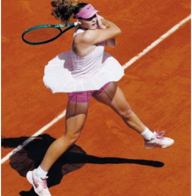
ପାରିଆ, ୪।୬ (ଏକେନ୍ଦ୍ରି): ରୁଷିଆର ଯୁବ ଖେଳାଳି ମାରିଆ ଆଣ୍ଡିରା ଏଠାରେ ଚାଲିଥିବା ବର୍ଷର ଦ୍ୱିତୀୟ ଗ୍ରାଣ୍ଡସ୍ଲାମ୍ ପ୍ରେଷ୍ଟ ଓପନ୍

ମହିଳା ସିଙ୍ଗଲ୍ସ ଫାଇନାଲରେ ପ୍ରବେଶ କରିଛନ୍ତି। ଗୁରୁବାର ଅନୁଷ୍ଠିତ ସେମିଫାଇନାଲ ମୁକାବିଲାରେ ମାରିଆ ୬-୧, ୬-୩ ସିଧାସଳଖ ସେଟ୍‌ରେ ଯୁକ୍ତେନ ଲକ୍‌ନା ମାଟି କୋଷ୍ଟୁକ୍‌ଙ୍କୁ ହରାଇଛନ୍ତି। ଏହି ମ୍ୟାଚ୍ ଜିତିବାକୁ ମାରିଆଙ୍କୁ ମାତ୍ର ଏକ ଘଣ୍ଟା ୧୨ ମିନିଟ୍ ସମୟ ଲାଗିଥିଲା। ୧୯ ବର୍ଷୀୟ ମାରିଆଙ୍କ କ୍ୟାରିୟରରେ ଏହା ପ୍ରଥମ ଗ୍ରାଣ୍ଡସ୍ଲାମ୍ ଫାଇନାଲ। ବିଜୟ ସହ ମାରିଆ ପ୍ରେଷ୍ଟ ଓପନ ଫାଇନାଲ ଖେଳିବାରେ ଚତୁର୍ଥ ସର୍ବନିମ୍ନ ମହିଳା ଖେଳାଳି ହୋଇଛନ୍ତି। ତାଙ୍କ ପୂର୍ବରୁ ଗତ ୩୦ ବର୍ଷ ମଧ୍ୟରେ ମାରିଆ ହିଜ୍‌ସ୍, କିମ୍ କୁକ୍‌ସ୍‌ ଓ କୋକୋ ଗସ୍ ସର୍ବନିମ୍ନ ଖେଳାଳି ଭାବେ ଏଠାରେ ଫାଇନାଲ ଖେଳିଥିଲେ। ଶିନିବାର ଖେଳାଯିବାକୁ ଥିବା ଫାଇନାଲରେ ଆଣ୍ଡିରାଙ୍କ ମୁକାବିଲା ତାଏନା ସ୍ନାଜଡର କିମ୍ପା ପୋଲାଣ୍ଡର ମାକା ବଖାଲିସ୍କଙ୍କ ସହ ହେବ। ତାଏନା ଓ ମାକାଙ୍କ ମଧ୍ୟରେ ମହିଳା ସିଙ୍ଗଲ୍ସ ଦ୍ୱିତୀୟ ସେମିଫାଇନାଲ ଖେଳାଯିବାର କାର୍ଯ୍ୟସୂଚୀ ରହିଛି।