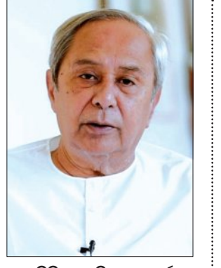
ପ୍ରସ୍ତୁତିଦିବ୍ୟାର ବିଫଳତା ଦର୍ଶାଇ ଲୋକଙ୍କ ନାୟ ଅଧିକାରୀଙ୍କୁ ବୁଝିତ କରାଯାଇ ପାରିବ ନାହିଁ । ୨୪ ବର୍ଷ ଧରି ମୋ ସରକାର ପ୍ରତି ୧୫ ଚାରିଖରେ ଦେଉଥିଲା ଭଉଁ । ଏହି ମତେଲ ସୁପ୍ରିମକୋର୍ଟ ଦ୍ୱାରା ହୋଇଥିଲା ପ୍ରଶଂସିତ

ସମାଜର ଦୁର୍ବଳ ବର୍ଗର ଅନେକ ଲୋକେ ନିଜର ଦୈନିକ ଜୀବନଧାରଣ ପାଇଁ ଏହି ଭଉଁ ଟଙ୍କା ଉପରେ ସମ୍ପୂର୍ଣ୍ଣ ଭାବେ ନିର୍ଭରଶୀଳ ଥାଆନ୍ତି । ତେଣୁ ଭୁବନେଶ୍ୱର ମାନ୍ୟତା ବନ୍ଧନ ପକ୍ଷରେ ହିତାଧିକାରୀଙ୍କୁ ଭଉଁ ଟଙ୍କା ପ୍ରଦାନ ସହ ଭବିଷ୍ୟତରେ ଯେପରି ଏପରି ତ୍ରୁଟିର ପୁନରାବୃତ୍ତି ନହୁଏ, ତାହା ସୁନିଶ୍ଚିତ କରିବାକୁ ଚିଠିରେ ନବୀନ ଦାବି କରିଛନ୍ତି । ଚିଠିରେ ଶ୍ରୀ ପଟ୍ଟନାୟକ ଉଲ୍ଲେଖ କରି କହିଛନ୍ତି ଯେ ଓଡ଼ିଶାର ପ୍ରାୟ ୧୮ ଲକ୍ଷ ହିତାଧିକାରୀଙ୍କୁ ଗତ ତିନି ମାସ ହେଲା ଭଉଁ ପ୍ରଦାନ ନ କରାଯିବା ନେଇ ମୁଁ ଗଭୀର ଉଦବେଗ ଓ ଖୋଲା ପ୍ରକାଶ