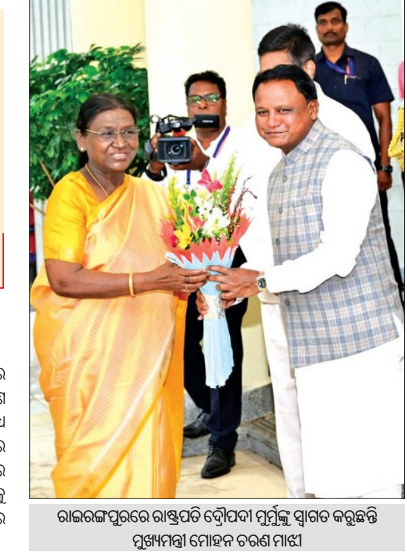
ରାଇରଙ୍ଗପୁରରେ ରାଷ୍ଟ୍ରପତି ଦ୍ରୌପଦୀ ମୁର୍ମୁଙ୍କୁ ସ୍ୱାଗତ କରୁଛନ୍ତି ମୁଖ୍ୟମନ୍ତ୍ରୀ ମୋହନ ଚରଣ ମାଝୀ

■ ବାରିପଦା, ୧୯।୬ (ସମିସ): ଦୁଇଦିନିଆ ଓଡ଼ିଶା ଗନ୍ତାଘରରେ ଶୁକ୍ରବାର ସନ୍ଧ୍ୟାରେ ମୟୂରଭଞ୍ଜ ଜିଲ୍ଲାର ରାଇରଙ୍ଗପୁରରେ ପହଞ୍ଚିଛନ୍ତି ରାଷ୍ଟ୍ରପତି ଦ୍ରୌପଦୀ ମୁର୍ମୁ । ପ୍ରତିକୂଳ ପାଗ ଯୋଗୁଁ କେଳେକକୃଷ୍ଣାକୁ ସତ୍ତ୍ୱେ ପଥରେ ଆସି ରାଇରଙ୍ଗପୁରରେ ପହଞ୍ଚିବାବେଳେ ରାଜ୍ୟପାଳ ହରିବାବୁ କମ୍ପନୀପାଠୀ ଓ ମୁଖ୍ୟମନ୍ତ୍ରୀ ମୋହନ ଚରଣ ମାଝୀ ପ୍ରମୁଖ ରାଷ୍ଟ୍ରପତିଙ୍କୁ ଭବ୍ୟ ସ୍ୱାଗତ ଜଣାଇଛନ୍ତି । ଆସନ୍ତାକାଲି ପ୍ରଧାନମନ୍ତ୍ରୀ ନରେନ୍ଦ୍ର ମୋଦୀ ରାଇରଙ୍ଗପୁର ଆସିବେ ଏବଂ ରାଷ୍ଟ୍ରପତି ଓ ପ୍ରଧାନମନ୍ତ୍ରୀ ୪୭ ହଜାର କୋଟି ଟଙ୍କାର ବିଭିନ୍ନ ପ୍ରକଳ୍ପର ଉଦ୍‌ଘାଟନ ଓ ଶିଳାନିଧି ସମ୍ପାଦନା କରିବେ । ନିଜ ଜନ୍ମଭୂମି ଓ ପ୍ରଥମ କର୍ମଭୂମିରେ ପହଞ୍ଚିବା ପରେ ରାଷ୍ଟ୍ରପତି ଏମ୍ ଭୁବନେଶ୍ୱରର ସହାଧିକାରୀତାରେ ଆୟୋଜିତ ପ୍ରଥମ ମାଗଣା ସ୍ୱାସ୍ଥ୍ୟ ଶିବିରର ଶୁଭାରମ୍ଭ କରିଛନ୍ତି । ଏହାପରେ ରାଷ୍ଟ୍ରପତି କୁସୁମା ବୁକ ପାର୍କ ମେଘା ପାଠ୍ୟ ପୃଷ୍ଠା-୭