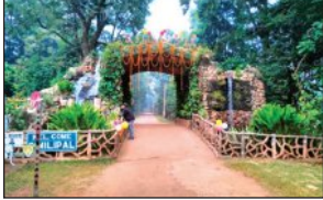
ଖୋଲା ରହିବ ୨ଟି ଲକ୍ଷେ ହିରିମିମି କମ୍ପ୍ଲେକ୍ସ

ବାରିପଦା, ୨୨।୬ (ସମ୍ବିଧ): ପ୍ରକୃତିପ୍ରେମୀ ପର୍ଯ୍ୟଟକଙ୍କ ପାଇଁ ଏସିଆ ମହାଦେଶର ବିଦିଆରୁ ବନ୍ଦ ହେବା ପରେ ଶିମିଳିପାଳ ଜାତୀୟ ଅଭୟାରଣ୍ୟ ଚଳିତ ଜୁନ ମାସ ୨୯ ତାରିଖରୁ ପର୍ଯ୍ୟଟକ ଓ ଭ୍ରମଣକାରୀଙ୍କ ପାଇଁ ବନ୍ଦ ରହିବ । ଏ ନେଇ ଶିମିଳିପାଳ ବ୍ୟାପ୍ ଆରକ୍ଷଣ ପ୍ରକଳ୍ପର କ୍ଷେତ୍ର ନିର୍ଦ୍ଦେଶକ ତଥା ବାରିପଦା ସର୍କାରୀ ଅଧିକାରୀଙ୍କ ଦ୍ଵାରା ଏହା ଘୋଷଣା କରାଯାଇଛି ।