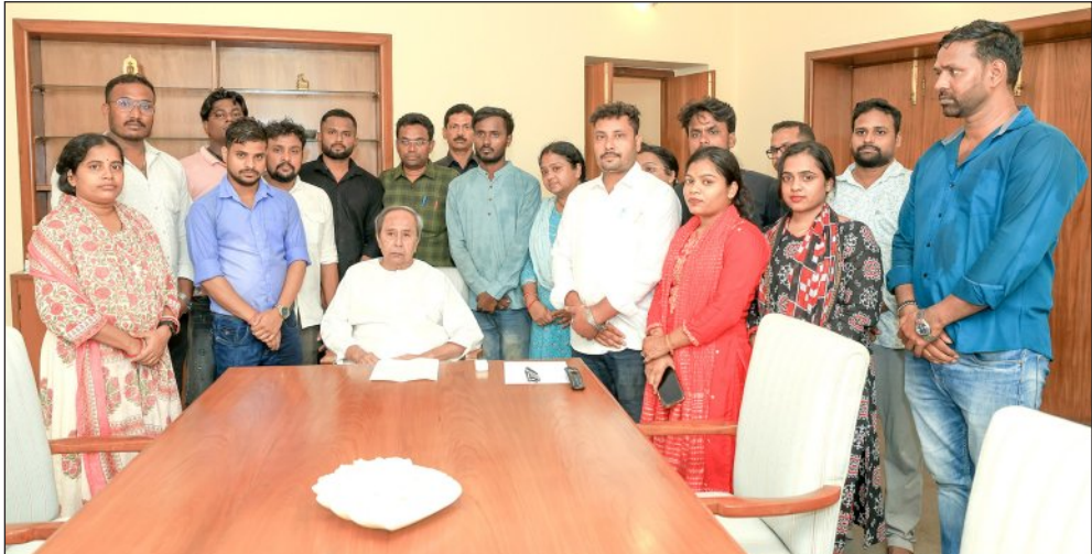
ପୂର୍ବତନ ମୁଖ୍ୟମନ୍ତ୍ରୀ ତଥା ବିରୋଧୀ ଦଳ ନେତା ନବୀନ ପଟ୍ଟନାୟକଙ୍କୁ ନବୀନ ନିବାସରେ ସାକ୍ଷାତ କରି ରାଜ୍ୟର ସାମ୍ବ୍ୟମିତ୍ରମାନଙ୍କର ଏକ ପ୍ରତିନିଧିମଣ୍ଡଳୀ ସେମାନଙ୍କ ସମସ୍ୟା ସମ୍ବନ୍ଧରେ ଆଲୋଚନା କରୁଛନ୍ତି