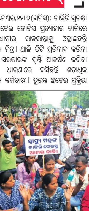
ବନ୍ଦ କରିବା, ଚାକିରିରେ ସୁରକ୍ଷା ପ୍ରଦାନ ଓ ଆଇଡିଏସି ବ୍ୟବସ୍ଥା ଉଲ୍ଲେଖ କରି ସିଧାସଳଖ ବିଭାଗ ଆଧାନକୁ ନେବାକୁ ସେମାନେ ଦାବି କରିଛନ୍ତି । ସାମ୍ବ୍ୟ ମିତ୍ରମାନେ କହିଛନ୍ତି ଯେ ୨୦୧୯ ମସିହାରୁ ମିତ୍ରମାନେ କହିଛନ୍ତି ଯେ ୨୦୧୯ ମସିହାରୁ ରାଜ୍ୟର ବିଭିନ୍ନ ପଞ୍ଚାୟତ ବେସରକାରୀ ହସ୍ତିକାଳରେ ବିକୃତ ସାମ୍ବ୍ୟ କଲ୍ୟାଣ ଯୋଜନା