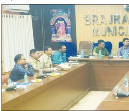
ବ୍ରଜରାଜନଗରରେ ଜିଲ୍ଲାପାଳଙ୍କ ଅଭିଯୋଗ ଶୁଣାଣି ଶିବିରର ଏକ ଦୃଶ୍ୟ।

ବ୍ରଜରାଜନଗର, ୨୨।୬ (ସମ୍ବିଧ): ବ୍ରଜରାଜନଗରରେ ଜିଲ୍ଲାପାଳ କୁଶାଳ ମୋତିରାମ ଚନ୍ଦ୍ରଶେଖର ଅଧ୍ୟକ୍ଷତାରେ ଏକ ଯୁଗ୍ମ ଅଭିଯୋଗ ଶୁଣାଣି ଶିବିର ଅନୁଷ୍ଠିତ ହୋଇଯାଇଛି।