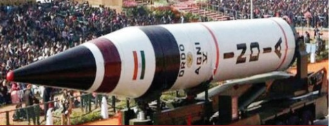
ବିଶ୍ୱର ପରମାଣୁ ଅସ୍ତ୍ରଶସ୍ତ୍ର ଭଣ୍ଡାର

କେନ୍ଦ୍ରୀୟ ହେଉଛି। ସିପ୍ରିର ତଥ୍ୟ ଅନୁଯାୟୀ, ଚାନ୍ ମଧ୍ୟ ନିଜର ନିୟୋଜିତ ମୁକ୍ତାସ୍ତ୍ର ସଂଖ୍ୟାକୁ ୨୪ ରୁ ୩୪କୁ ବୃଦ୍ଧି କରିଛି। ପୂର୍ବରୁ ଭାରତର ପ୍ରାୟ ସମସ୍ତ ପରମାଣୁ ଅସ୍ତ୍ର 'ଷ୍ଟକପାଇଲ୍' ବା ଭଣ୍ଡାରରେ ସୁରକ୍ଷିତ ରଖାଯାଉଥିଲା। ସେଗୁଡ଼ିକୁ ସୁଦ୍ଧ ସମୟରେ ନିଆଯାଇ ବା ବିନାମରେ ଖଞ୍ଜାଯିବା ବ୍ୟବସ୍ଥା ରହିଥିଲା। ତେଣୁ ଏଗୁଡ଼ିକ ହଠାତ୍ ଆମେରିକା ଓ ରୁଷ ପାଖରେ ସର୍ବାଧିକ ବର୍ତ୍ତମାନ ସୁଦ୍ଧା କୌଣସି ପରମାଣୁ ଅସ୍ତ୍ର ନିୟୋଜିତ କରିନଥିଲେ ମଧ୍ୟ ଭବିଷ୍ୟତ ପାଇଁ ନିଜର ପରମାଣୁ ଭଣ୍ଡାର ବୃଦ୍ଧି କରିବାକୁ ଲକ୍ଷ୍ୟ ରଖୁଥିବା ରିପୋର୍ଟରେ କୁହାଯାଇଛି। ଭାରତ ବର୍ତ୍ତମାନ ବିଶ୍ୱର ଦ୍ୱିତୀୟ ବୃହତ୍ତମ ଅସ୍ତ୍ରଶସ୍ତ୍ର ଆମଦାନୀକାରୀ ଦେଶ ହୋଇ ରହିଛି। ବିଶ୍ୱର ୯ଟି ପରମାଣୁ ସମ୍ପନ୍ନ ଦେଶ ନିଜର ଶକ୍ତି ବୃଦ୍ଧି କରିବାରେ ଲାଗିଛନ୍ତି। ଭାରତ ଓ ଇସ୍ରାଏଲ୍ ପ୍ରମୁଖତଃ ପୁରୋଦାୟୀ ବ୍ୟବହାର କରି ନିଜର ପରମାଣୁ ଶକ୍ତିକୁ ବୃଦ୍ଧି କରୁଛନ୍ତି।