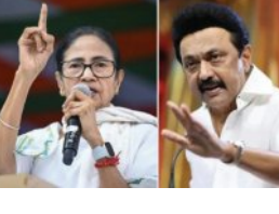
ପ୍ରତିଶୋଧ ପାଇଁ ବିଜେପିର ଯୋଜନା ଲୋକସଭାରେ ଟାର୍ଗେଟ୍ ୩୫୨

ଥର ଲାଗି ସଂସଦ ଭିତରେ ସରକାର ଏକାଧିକ ପ୍ରତିକରଣ ପରିସ୍ଥିତିର ସମ୍ମୁଖୀନ ହୋଇଥିଲେ। ଏହାର ପ୍ରତିଶୋଧ ପାଇଁ ୨୦୨୯ ସାଧାରଣ ନିର୍ବାଚନ ପୂର୍ବରୁ ଏହି ଦୁଇଟି ବିଳମ୍ବ ସଂସଦରେ ଆଗତ ବି ହୋଇଥିଲା। କିନ୍ତୁ ଗତ ଏପ୍ରିଲ ୧୭ ତାରିଖରେ ଆବଶ୍ୟକ ସଂଖ୍ୟା ଅଭାବକୁ ଏହା କାର୍ଯ୍ୟ ହୋଇନଥିଲା। ୫୪୩ ସଭ୍ୟ ବିଶିଷ୍ଟ ଲୋକସଭାରେ ଏହି ସମ୍ପୂର୍ଣ୍ଣ ସଂଖ୍ୟାଧୀନ ବିଳମ୍ବରେ ପାଇଁ ଦୁଇ ତୃତୀୟାଂଶ (୩୫୨) ସଭ୍ୟଙ୍କ ସମର୍ଥନ ଦରକାର ଥିବା ବେଳେ ସରକାରଙ୍କ ପାଖରେ ଥିଲେ ମାତ୍ର ୨୯୮ ସଂସଦ। ବିରୋଧୀ ମେଣ୍ଟର ୨୩୦ ସଂସଦ ଏହାର ବିରୋଧ କରିଥିଲେ। ମୋଦୀଙ୍କ ୧୨ ବର୍ଷ କାର୍ଯ୍ୟକାଳ ମଧ୍ୟରେ ପ୍ରଥମ