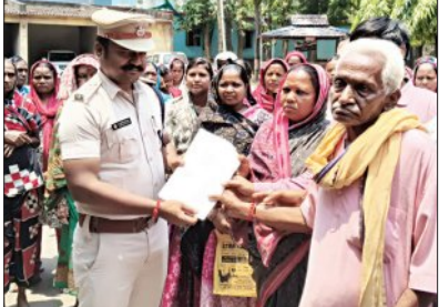
କୋଟିଆ ମଦ ବେଦାରୀଙ୍କ ବିରୋଧରେ ହଲ୍ଲାବୋଲ

କବିଶର୍ମା, ୪।୬(ସମିପ): ବନହରପାଲି ବେଆଇନ ମଦଭାଟି ଚାଲିଛି। ପଲ୍ଲରେ ଆନା ତେଲେନପାଲି ପଞ୍ଚାୟତରାଜୀ ସ୍ତରରେ ସ୍ତର ସ୍ତର ଭାଙ୍ଗି ଦିଆଯାଇଛି।