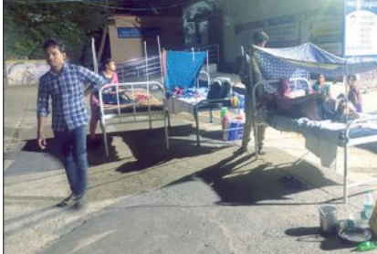
ଓଡ଼ିଆ ଭିତରେ ଅସହ୍ୟ ଗରମ

ନୂଆପଡ଼ା/ଭୋମନା, ୪।୬(ସମ୍ବିଧ): ସରକାରୀ ସ୍ୱାସ୍ଥ୍ୟକେନ୍ଦ୍ରର ଅଧିକ ଚେହେରା ପଦାରେ ପକାଇଛି ନୂଆପଡ଼ା ଜିଲ୍ଲା ଭେଲ୍ଲା ଗୋଷ୍ଠୀ ସ୍ୱାସ୍ଥ୍ୟକେନ୍ଦ୍ର (ସିଏସ୍ଏସ୍)।