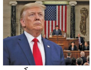
ସମର୍ଥନ ଦେଲେ ଶାସକ ଦଳର ୪ ସଂସଦ

ଗତ ଦିନ ମାସ ଧରି ଚାଲିଥିବା ଏହି ଅନିଶ୍ଚିତ ଯୁଦ୍ଧକୁ ନେଇ ଶାସକ ଦଳ ମଧ୍ୟରେ ବହୁଥିବା ଅସନ୍ତୋଷକୁ ଏହି ଘଟଣା ସ୍ପଷ୍ଟ କରିଛି। ଏହି ନିଷ୍ପତ୍ତି ପ୍ରାଥମିକ ସ୍ତରରେ ପ୍ରତିକାମ୍ପକ ମନେହେଉଥିଲେ ମଧ୍ୟ ଏହାର ରାଜନୈତିକ ମହତ୍ତ୍ୱ ଅନେକ ରହିଛି। ବର୍ତ୍ତମାନ ଏହି ପ୍ରସ୍ତାବକୁ ସଂସଦର