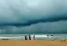
୨୦ ଯାଏଁ ବିଭିନ୍ନ ଜିଲ୍ଲାରେ ବର୍ଷା ସହ ପବନ ସମ୍ଭାବନା ଆଜି ୨୭ ଜିଲ୍ଲାକୁ ପାଣିପାଗ ବିଭାଗର ସତର୍କ ସୂଚନା

■ ଭୁବନେଶ୍ୱର, ୧୪.୬ (ସମ୍ବାଦ): ଉତ୍ତର ଉପକୂଳ ଅଞ୍ଚଳ ଦେଇ ଗତ ଶୁକ୍ରବାର ଦକ୍ଷିଣ-ପଶ୍ଚିମ ମୌସୁମୀ ବାୟୁ ଓଡ଼ିଶାକୁ ପ୍ରବେଶ କରିଥିଲେ ହେଁ ଏହାର ପ୍ରଭାବ ସେପରି ଅନୁଭୂତ ହେଉନାହିଁ। ଓଡ଼ିଶା ଆକାଶରେ ବର୍ଷାପ୍ରାୟତଃ ଗାଏବ ରହିଛି। ତେବେ ଆସନ୍ତା ୪ରୁ ୫ ଦିନ ମଧ୍ୟରେ ମୌସୁମୀ ବାୟୁ ଓଡ଼ିଶାର ଅଧିକ ଅଞ୍ଚଳକୁ ଅଗ୍ରସର ହେବ ବୋଲି ଭୁବନେଶ୍ୱର ଆଞ୍ଚଳିକ ପାଣିପାଗ କେନ୍ଦ୍ର ପକ୍ଷରୁ ଆକଳନ କରାଯାଇଛି। ପାଣିପାଗ କେନ୍ଦ୍ରର ସୂଚନା ଅନୁଯାୟୀ, ସୋମବାର ରାଜ୍ୟର ବିଭିନ୍ନ ସ୍ଥାନରେ ବିଲୁଳି, ଘଡ଼ଘଡ଼ି ସହ ବର୍ଷା ହେବାର ସମ୍ଭାବନା ରହିଛି। ବାଲେଶ୍ୱର, କେନ୍ଦୁଝର, ମୟୂରଭଞ୍ଜ, ରାୟଗଡ଼ା, କୋରାପୁଟ, ଗଞ୍ଜାମ ଓ ଗଜପତି ଜିଲ୍ଲାରେ ୫-୧୦ରୁ ୬-୧୨ ଇଞ୍ଚି ବେଗରେ ପବନ ସହ ଏକାଧିକ ସ୍ଥାନରେ ବର୍ଷା ଓ ବିଲୁଳି ହୋଇପାରେ।