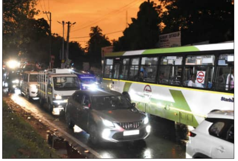
ରବିବାର ଅପରାହ୍ନରେ କାଳବୈଶାଖୀ ବର୍ଷାରେ ବେହାଲ କଟକର ରାଜପଥ ଓ ଜନବସତି