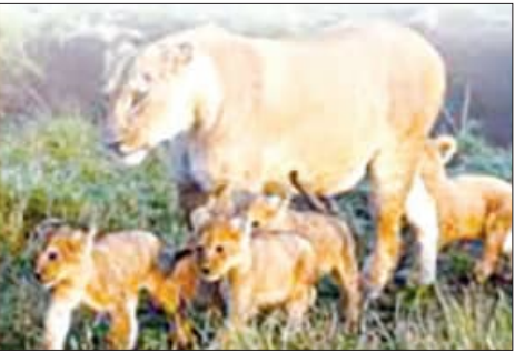
ପେରିବେ। ସିଂହମାନଙ୍କ ସୁସ୍ଥ ପାଇଁ ଆଖ୍ୟାୟ ଅଞ୍ଚଳର ପ୍ରାୟ ୬୦୦ ସିଂହଙ୍କୁ ପରଜାବା ମୁକ୍ତ ଅର୍ଥାତ୍ ତିଆରି କରାଯାଇଛି।