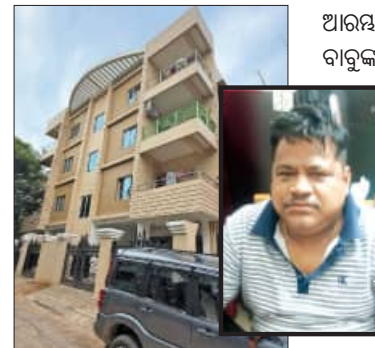
୯ଟି ସ୍ଥାନରେ ଭିକିଲାନ୍ସ ଚତୁର ୫ ବିକ୍ରି, ୧୩ଟି ଦାମା ପୁର ଠାବ

■ ଭୁବନେଶ୍ଵର/ପୁଲକାଣା/ବାଲିଗୁଡ଼ା, ୬।୬ (ସମିତ୍): ଯନ୍ତ୍ରୀଙ୍କ ବ୍ୟାଙ୍କ ଲକରରେ ନଗଦ ୨ କୋଟି ଟଙ୍କା। ଖାଲି ସେତିକି ନୁହେଁ; ଭୁବନେଶ୍ଵର ଓ ଯାଜପୁରର ପ୍ରମୁଖ ଜାଗାରେ ୫ଟି ବହୁତଳ ବିକ୍ରି ସାଜକୁ ଭୁବନେଶ୍ଵର, ଯାଜପୁର ଧର୍ମଶାଳା ଓ ବାରିପଦାକୁ ମିଶାଇ ୧୩ଟି ଦାମା ପୁର। ଆଉ ବହିର୍ଭୂତ ସମଗ୍ର ଠୁଳ ଅଭିଯୋଗରେ ଚତୁର କରୁକରୁ ଭିକିଲାନ୍ସ କାଳରେ ପୁଣିଥରେ ଏକ ବଡ଼ ମାଛ ପଡ଼ିଛି। ୧୯୯୯ ମସିହାରେ କନିଷ୍ଠ ଯନ୍ତ୍ରୀ ଭାବେ ମାତ୍ର ୬ ହଜାର ଟଙ୍କା ଦରମାରେ ଚାକିରି