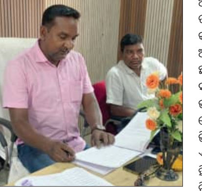
ନୂଆପଡ଼ା, ୨।୬ (ସମ୍ପାଦକ): ସରକାର ସାମାଜିକ ସୁରକ୍ଷା ଯୋଜନାରେ ବାର୍ଷିକ କୋଟି କୋଟି ଟଙ୍କା ବରାଦ କରିଥିବା ବେଳେ କେତେକ ଲାଭହୋଇ ଆଧିକାରୀ, କର୍ମଚାରୀ ଏବଂ ଜନ ପ୍ରତିନିଧିଙ୍କ ମଧ୍ୟରେ ହୋଇଥିବା ଯୋଗୁଁ ମୃତ୍ୟୁବରଣ କରିଥିବା କିମ୍ବା ଭୁତ ହିତାଧିକାରୀଙ୍କ ନାଁରେ ଅଞ୍ଚଳରେ କିଛି ବାର୍ଷିକ କୋଟିଏରୁ ଅଧିକ ଟଙ୍କା ସରକାରୀ ତହଲିକୁଳୁ ଚଳୁ କରିଥିବା ପ୍ରାଥମିକ ତଦନ୍ତରୁ ଜଣାପଡ଼ିଛି। ଏହା ଉପରେ ସୁରକ୍ଷା ପାଇ କିଲ୍ଲାପାଳ ମିଶନ ମୋଡ଼ରେ ଜିଲ୍ଲାରେ କେତେକ

ଅନିୟମିତତା ହୋଇଛି ତାର ଫର୍ମ ଖୋଲିବାକୁ ଜିଲ୍ଲା ବ୍ୟାପି ତଦନ୍ତ ଚଳାଇଛନ୍ତି। ପ୍ରକାଶ ଯେ ଜିଲ୍ଲାର ସମସ୍ତ ପଞ୍ଚାୟତରେ କାର୍ଯ୍ୟନିର୍ବାହୀ ଅଧିକାରୀମାନେ ସ୍ଥାନୀୟ ଜନ ପ୍ରତିନିଧି, ଅଜ୍ଞାନତା କର୍ମୀ, ଖର୍ଚ୍ଚ ମେମ୍ବରଙ୍କ ଉପସ୍ଥିତିରେ ତାଲିକାର ଛାନଭିନ କରୁଛନ୍ତି। ଆମେ ଏହି କ୍ରମରେ ନୂଆପଡ଼ା ଜିଲ୍ଲା ସଦର ମହକୁମାର କେଉଁମୋଡ଼ାପଞ୍ଚାୟତକୁ ଉଦାହରଣ ଭାବେ ନେଇଥିଲେ ଏହି ପଞ୍ଚାୟତରେ ମଧୁବାବୁ ପେନସନ ଯୋଜନାରେ ୯୧ ହିତାଧିକାରୀ ଥିବାବେଳେ ୫୫୫ ଜଣ ଲକ୍ଷ୍ମଣ, ୮୦୦୪୪୦ ଉର୍ଦ୍ଧ୍ୱ ବୟସରେ ୬୫୫ ହିତାଧିକାରୀ ଏବଂ ୧୧୩୫୫ ଜାତୀୟ ବାର୍ଦ୍ଧକ୍ୟ ଭଣ୍ଡା ଯୋଜନାରେ ହିତାଧିକାରୀ ସାମିଲ ଅଛନ୍ତି। ଏଥିରୁ ୬୫୫ ହିତାଧିକାରୀଙ୍କ ବିଗତ ଦିନରେ ମୃତ୍ୟୁ ଘଟିଥିବା ଜଣାପଡ଼ିଛି। ଏହିଭଳି ସାଧିତା ପଞ୍ଚାୟତରେ ୨୦୫୫ ହିତାଧିକାରୀଙ୍କ ମୃତ୍ୟୁ ଘଟିଥିବା ତଥ୍ୟ ଜଣାପଡ଼ିଛି। କିଲ୍ଲାବାସୀଙ୍କ ସଂସ୍ଥାରେ ତଦନ୍ତ କଲେ ଅନୁମିତ ହୁଇ ହଜାର ହିତାଧିକାରୀଙ୍କ ତାଲିକା ଆସିବ ବୋଲି ଏକ ସୂତ୍ରରୁ ଜଣାପଡ଼ିଛି। ମାସିକ ୧୦୯୪ ୨୦ଲକ୍ଷ ଟଙ୍କାର ରୋଷପୋତ ହେଉଥିଲା। ଏସବୁ ତାଲିକାରୁ ବାଦ ପଡ଼ିଲେ ଆହୁରି ନିରାହ ହିତାଧିକାରୀଙ୍କୁ ସାମିଲ କରାଯାଇପାରିବ ବୋଲି କୁହାଯାଇଛି। କିଲ୍ଲାପାଳଙ୍କ ଭଣ୍ଡା ଭ୍ରାଉଡ଼କୁ ବିଭିନ୍ନ ମହଲରେ ସାଗତ କରାଯାଇଛି।