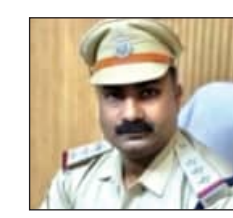
ଦଲାଲକୁ କୋର୍ଟ ଚାଲାଇ