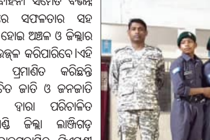
ସେନାବାହିନୀ ସମେତ ବିଭିନ୍ନ କ୍ଷେତ

ଶିବିରରେ କ୍ୟାଡେଟମାନେ ଡ୍ରାଇଭିଂ ପ୍ରଥମ, କ୍ରୀଡ଼ାରେ ପ୍ରଥମ, ଦଳଗତ କ୍ରୀଡ଼ାରେ ପ୍ରଥମ ଏବଂ ଏକକ କ୍ରୀଡ଼ାରେ ବିଜିତ ହୋଇ ସ୍ଥାନୀୟ କ୍ରୀଡ଼ାରେ ପ୍ରଥମ ଏବଂ ଏକକ କ୍ରୀଡ଼ାରେ ସାମଗ୍ରିକ ପ୍ରଦର୍ଶନରେ ମଧ୍ୟ ବିଜିତ ହୋଇ ସ୍ଥାନୀୟ କ୍ରୀଡ଼ାରେ ପ୍ରଥମ ହୋଇଛନ୍ତି।