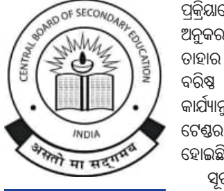
ଓଏସ୍‌ଏମ୍ ସେବାର ମାଷ୍ଟ ପାଇଁ କମିଟି ଗଠିତ