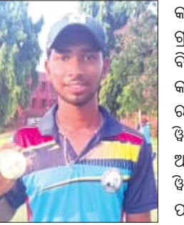
ରନ୍ ବଳରେ ଭୁବନେଶ୍ୱର ଦଳ ୨୫.୧ ଓକେଟ୍‌ରେ ୫ଟି ଓକେଟ୍ ହରାଇ ଲକ୍ଷ୍ୟ ହାସଲ କରି ଲେଖାଏଁ ଓକେଟ୍ ନେଇଥିଲା ।