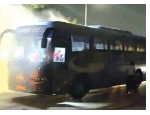
ଲାଗି ହୁଇଥିବା କାଳ ରକ୍ଷିତରେ ଅଟକି ରହିଥିଲେ । ପରେ ଏକ ଚାର୍‌ଜର ଫାଇର ଯୋଗେ ଶନିବାର ବିକଳରୁ ରାତିରେ ଟିକି ବାହିନୀ ଅହମ୍ମଦାବାଦରେ ଫାଇନାଲ ଖେଳିବାକୁ ପହଞ୍ଚିଥିଲା । ଫଳରେ ସେମାନଙ୍କୁ ଫାଇନାଲ ପୂର୍ବରୁ ପ୍ରସ୍ତୁତି ଲାଗି ସମୟ ମିଳି ନ ଥିଲା ।