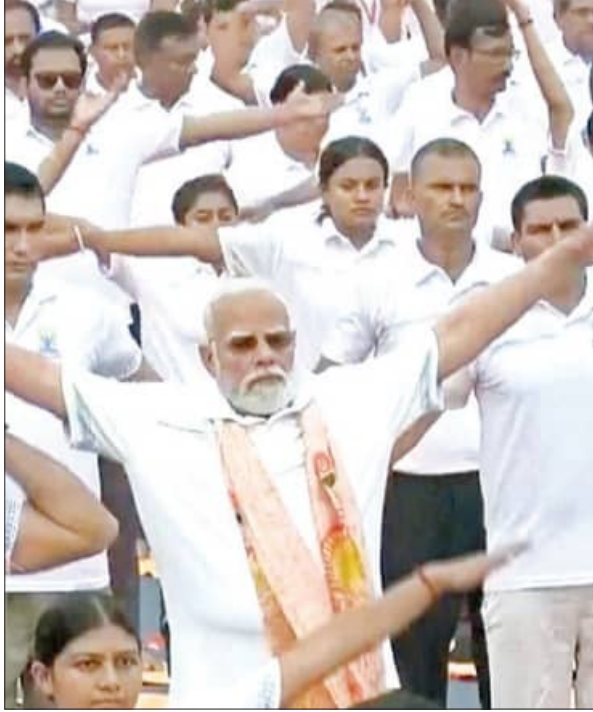
ଅନ୍ତର୍ଜାତୀୟ ଯୋଗ ଦିବସ ଅବସରରେ କୋଲକାତାର ରେଭୁ ଭୋଡ଼ରେ ପ୍ରଧାନମନ୍ତ୍ରୀ ନରେନ୍ଦ୍ର ମୋଦୀଙ୍କ ଯୋଗାବଧ୍ୟା