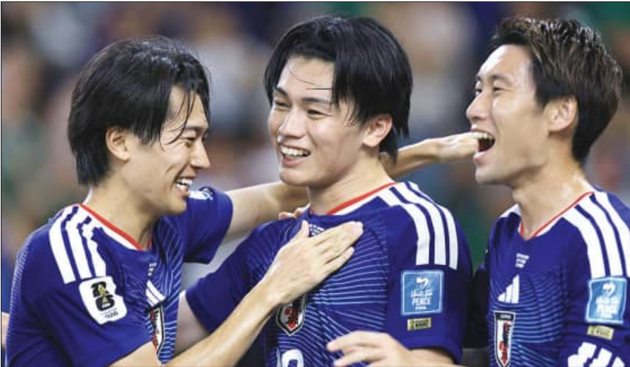
ମହାଦେଶର ଏହି ଶୀର୍ଷ ଦେଶକୁ ନକ୍ସାଭଙ୍ଗରେ ପ୍ରବେଶ କରିବାକୁ ହେଲେ ଶେଷ ଲିଗ୍ ମ୍ୟାଚ୍‌ରେ ଲକ୍ଷ୍ୟତର ସହ ଗୋଟିଏ ପଏଣ୍ଟ ବା ମ୍ୟାଚ୍ ତ୍ରୁ କରିବାର ଆବଶ୍ୟକତା ରହିଛି। ମକ୍ସୋରା ଷ୍ଟାଡ଼ିୟମରେ ଖେଳାଯାଇଥିବା ଏହି

ଏସିଆ ମହାଦେଶର ଜାପାନ ଓ ଆଫ୍ରିକାର ଟ୍ୟୁନିସିଆ ମଧ୍ୟରେ ସ୍ଥାନୀୟ ମୋକ୍ସୋରା ଷ୍ଟାଡ଼ିୟମରେ ଭାରତୀୟ ସମୟ ଅର୍ଥାତ୍ ସକାଳ ୯ଟା ୩୦ ମିନିଟ୍‌ରେ ଫିଫା ବିଶ୍ୱକପର ୧୦୦୦ତମ ମ୍ୟାଚ୍ ଖେଳାଯାଇଛି। ୯୬ବର୍ଷ ପୂର୍ବେ ଉତ୍କଳରୁ ମହାଶୂରୀଓଠାରେ ଜୁଲାଇ ୧୩ ତାରିଖ ଦିନ ଫିଫା ବିଶ୍ୱକପର ପ୍ରଥମ ମ୍ୟାଚ୍ ଖେଳାଯାଇଥିଲା। ଏହି ମ୍ୟାଚ୍‌ରେ ଫ୍ରାନ୍ସ ୪-୧ରେ ମେକ୍ସିକୋକୁ ହରାଇଥିଲା। ଏବେ ୧୦୦୦ତମ ମ୍ୟାଚ୍‌ରେ ଟ୍ୟୁନିସିଆକୁ ୪-୦ ଗୋଲରେ ଟ୍ୟୁନିସିଆକୁ ପରାସ୍ତ କରି ଜାପାନ ଏକାଧିକ ରେକର୍ଡ୍ ସହ ବୃହତ୍ ବିଜୟ ହାସଲ କରି ଏହି ମୁକାବିଲାକୁ ସ୍ମରଣୀୟ କରିପାରିଛି। ବିଜୟୀ ଦଳ ପକ୍ଷରୁ ଆୟତ୍ତ ସ୍ୱତନ୍ତ୍ର ଖେଳର ମ୍ୟାଚ୍‌ରେ ଓ ୮ମ ଚାନ୍ଦ ମିନିଟ୍‌ରେ ୨ଟି, ଦାକ୍ତରୀ କାମାଡ଼ା ୪ର୍ଥ ମିନିଟ୍‌ରେ ଓ କୁନ୍ୟା ଇଟୋ ୬୯ତମ ମିନିଟ୍‌ରେ ଗୋଟିଏ ଲେଖାଏଁ ଗୋଲ ସ୍କୋର କରିଥିଲେ। ବୃହତ୍ ବିଜୟ ସହ ଜାପାନ ୨ଟି ମ୍ୟାଚ୍‌ରୁ ୪ ପଏଣ୍ଟ ପାଇ ଗ୍ରୁପ୍-ଏଫ୍‌ରେ ନେତୃତ୍ୱାଧିକାର ସହ ସମାପ୍ତରେ ରହିଛି। ଏସିଆ