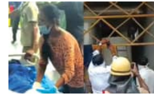
୬୭ ଅସୁସ୍ଥ, ମୃତାହତଙ୍କ ମଧ୍ୟରେ ଓଡ଼ିଆ ଶ୍ରମିକ

■ ବେଲୁଗୁଡ଼ା, ୨୧।୬ (ଏକେନ୍ଦ୍ର): ଚାମିଲନାଦୁର ତିରୁଭାଲୁର ଜିଲ୍ଲାରେ ଥିବା ସେଣ୍ଟ ପିଟର୍ସ ପଲ୍ ସାମୁଦ୍ରିକ ଖାଦ୍ୟ (ମାଛ) ରପ୍ତାନୀ କାରଖାନାରେ ହଠାତ୍ ଆମୋନିଆ ଗ୍ୟାସ୍ ଲିକ୍ ହେବା ଯୋଗୁଁ ୭ ଜଣ ମହିଳା ଶ୍ରମିକଙ୍କର ମୃତ୍ୟୁ ଘଟିଥିବା ବେଳେ ପ୍ରାୟ ୬୭ ଜଣ ଶ୍ରମିକ ଅସୁସ୍ଥ ହୋଇଛନ୍ତି । ଆହତମାନଙ୍କ ମଧ୍ୟରୁ ୯ ଜଣଙ୍କ ଅବସ୍ଥା ଅତ୍ୟନ୍ତ ସଙ୍କଟାପନ୍ନ ଥିବାରୁ ସେମାନଙ୍କୁ ଭେଣ୍ଟିଲେଟରରେ ରଖାଯାଇଛି । ମୃତାହତଙ୍କ ମଧ୍ୟରେ କିଛି ଓଡ଼ିଆ ଶ୍ରମିକ ରହିଥିବା ଜଣାପଡ଼ିଛି । ଏହି ଦୁର୍ଘଟଣା