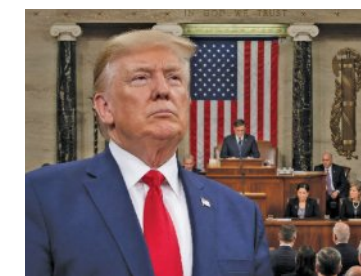
ସମର୍ଥନ ଦେଲେ ଶାସକ ଦଳର ୪ ସଂସଦ

ଗତ ତିନି ମାସ ଧରି ଚାଲିଥିବା ଏହି ଅନିଶ୍ଚିତ ମୁକ୍ତ ବନ୍ଦ ଶାସକ ଦଳ ମଧ୍ୟରେ ବଜୁଥିବା ଅସନ୍ତୋଷକୁ ତୀବ୍ର ହେବାରେ ଲାଗିଛି । ଏହି ନିଷ୍ପତ୍ତି ପ୍ରାଥମିକ ସ୍ତରରେ ପ୍ରତିକାମ୍ପକ ମନେହେଉଥିଲେ ମଧ୍ୟ ଏହାର ରାଜନୈତିକ ମହତ୍ତ୍ୱ ଅନେକ ରହିଛି । ବର୍ତ୍ତମାନ ଏହି ପ୍ରସ୍ତାବକୁ ସଂସଦର