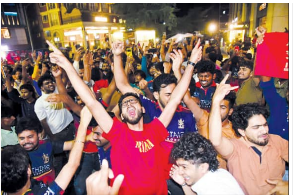
ବେଙ୍ଗାଲୁରୁରେ ଆରସିବି ସମର୍ଥକଙ୍କ ବିକ୍ରମ ଉତ୍ସବ