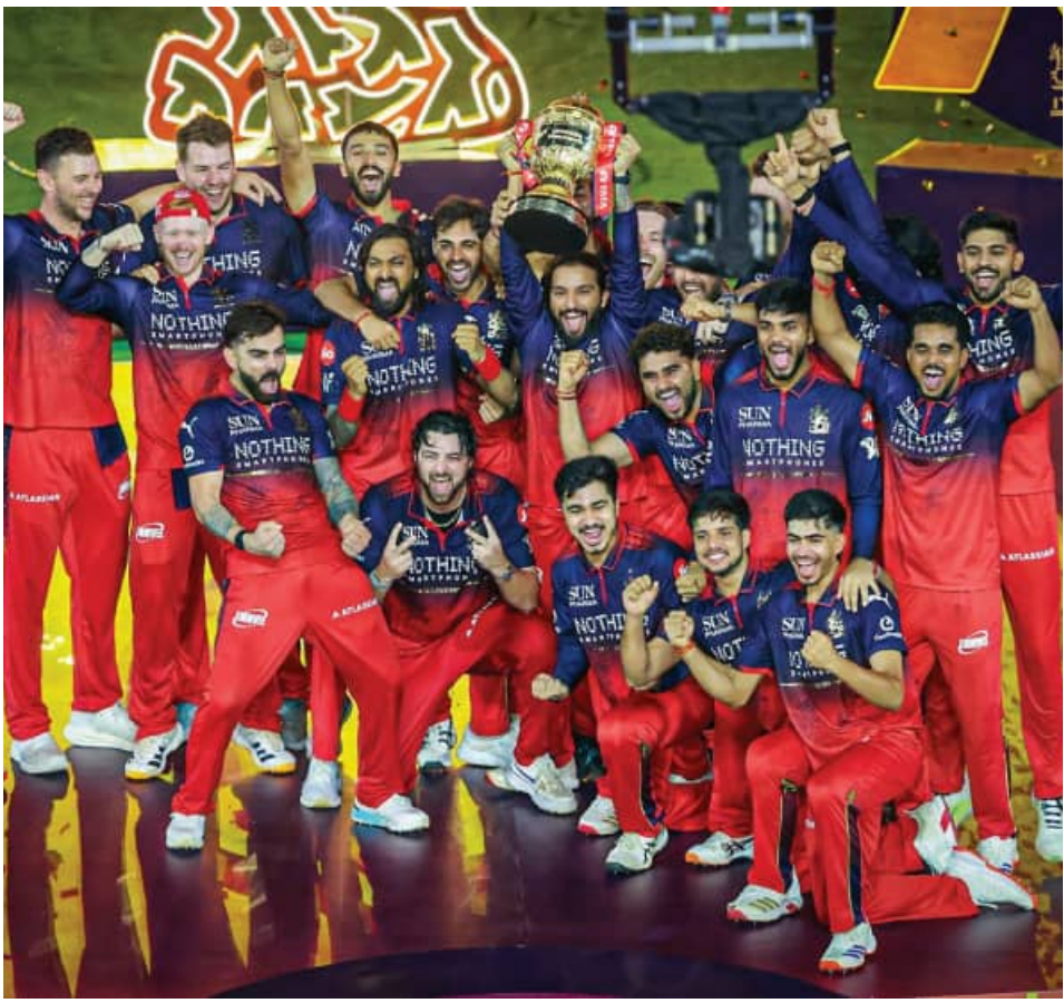
ଆଇପିଏଲ୍-୧୯ ସଂସ୍କରଣ: ୫ ଡିକେମ୍ବର ଗୁଜରାଟ ପରାସ୍ତ କିମ୍ବଦନ୍ତୀ କୋହଲିକ ଅପରାଜିତ ୬୫ ରନ୍

■ ଅହମ୍ମଦାବାଦ, ୩୧୫ (ଏକେନ୍ଦ୍ର): ଡିପେଣ୍ଡି ଚାମ୍ପିଅନ ରୟାଲ ଚ୍ୟାଲେଞ୍ଜର୍ସ ବେଙ୍ଗାଲୁରୁ (ଆରସିବି) ୨୦୨୬-ଆଇପିଏଲ୍ (ଇଣ୍ଡିଆନ୍ ପ୍ରିମିୟର ଲିଗ୍) ଚାମ୍ପିଅନ ହେବା ସହ ଦୀର୍ଘ ଅକ୍ଟୋ ପାଞ୍ଚ ଧରି ଚାଲିଥିବା ଫଟାଫଟ କ୍ରିକେଟରେ ସର୍ବଦୃଶ୍ୟ ମହୋତ୍ସବର ପରିସମାପ୍ତି ଘଟିଛି। ବିଶ୍ୱର ଏହି ସର୍ବଦୃଶ୍ୟ ଓ ସହଠାରୁ ଲୋକପ୍ରିୟ ଟୁର୍ଣ୍ଣାମେଣ୍ଟର ୧୯ତମ ସଂସ୍କରଣର ଆଜି ଖେଳାଯାଇଥିବା ଫାଇନାଲରେ ଆରସିବି ୫ ଡିକେମ୍ବର ଗୁଜରାଟ ଟାଇଟାନ୍ସକୁ ପରାସ୍ତ କରିଛି। ଏହା