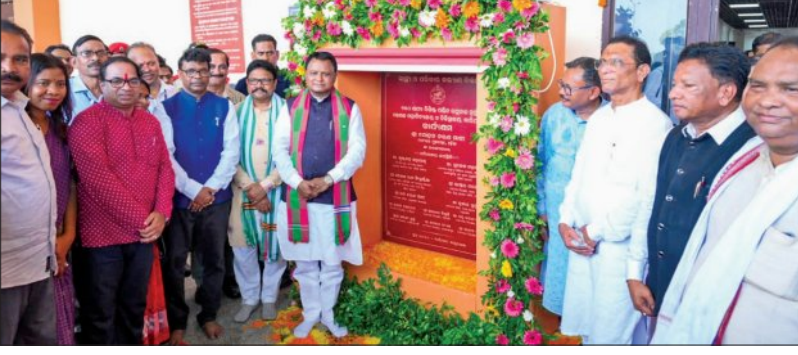
୩୯ଟି ପ୍ରକଳ୍ପର ଶୁଭାରମ୍ଭ, ୧୦୦ କୋଟିର ପାନାୟତ୍ତଳ ପ୍ରକଳ୍ପ ଉଦ୍ଘାଟିତ କ୍ଷେତ୍ର ସହ ଜଡ଼ିତ ୩୯ଟି ପ୍ରମୁଖ ଉନ୍ନୟନମୂଳକ କାର୍ଯ୍ୟକ୍ରମର ଶୁଭାରମ୍ଭ ଓ ଭିଡିପ୍ରସାର ସ୍ଥାପନ କରାଯାଇଛି। ଏହି ପ୍ରକଳ୍ପଗୁଡ଼ିକ ଫଳରେ ଆଗାମୀ ଦିନରେ ସ୍ଥାନୀୟ ଅଞ୍ଚଳରେ ବ୍ୟାପକ ସୁଧାର ଆସିବ ବୋଲି ସରକାରଙ୍କ ପକ୍ଷରୁ କୁହାଯାଇଛି। ଉକ୍ତ କାର୍ଯ୍ୟକ୍ରମ ମଧ୍ୟରେ ୨୮୨ କୋଟିରୁ ଅଧିକ ଟଙ୍କା ମୂଲ୍ୟର ୨୯ଟି ପ୍ରକଳ୍ପର ଭିଡିପ୍ରସାର ସ୍ଥାପନ କରାଯାଇଥିବା ବେଳେ ୧୪୯ କୋଟିରୁ ଅଧିକ

■ ବାରିପଦା, ୮।୬ (ସମ୍ପାଦକ): ମୟୂରଭଞ୍ଜ ଓ ସମଗ୍ର ଉତ୍ତର ଓଡ଼ିଶାର ସ୍ୱାସ୍ଥ୍ୟସେବା କ୍ଷେତ୍ରରେ ଆଜି ଏକ ଐତିହାସିକ ଅଧ୍ୟାୟ ଯୋଡ଼ି ହୋଇଛି। ପୂର୍ବତନ ମୁଖ୍ୟମନ୍ତ୍ରୀ ନବୀନ ପଟ୍ଟନାୟକଙ୍କ ପରିକଳ୍ପନା ପ୍ରକଳ୍ପ ଆଜି ପୂର୍ଣ୍ଣାଙ୍ଗ ରୂପ ପାଇଛି। ମୁଖ୍ୟମନ୍ତ୍ରୀ ମୋହନ ଚରଣ ମାଝି ବାରିପଦାକୁ ବିଦିନିଆ ଗସ୍ତରେ ଆସି ପଶ୍ଚିତ ରତ୍ନନାଥ ମୁର୍ମୁ ମେଡିକାଲ କଲେଜର ନୂତନ ୬୫୦ ଶଯ୍ୟା ବିଶିଷ୍ଟ ଟିଟିଜ୍ ହସ୍ପିଟାଲ ଉଦ୍ଘାଟନ କରିବା ସହିତ ଜିଲ୍ଲାର ସର୍ବାଙ୍ଗୀନ ବିକାଶ ପାଇଁ ୪୩୦ କୋଟିରୁ ଅଧିକ ଟଙ୍କାର ବିଭିନ୍ନ ଉନ୍ନୟନମୂଳକ ପ୍ରକଳ୍ପର ଶୁଭାରମ୍ଭ ଓ ଭିଡିପ୍ରସାର ସ୍ଥାପନ କରିଛନ୍ତି। ମୟୂରଭଞ୍ଜ ଜିଲ୍ଲାର ଭିଡିପ୍ରସାରକୁ ଅଧିକ ସୁଦୃଢ଼ କରିବା ଲକ୍ଷ୍ୟରେ ସରକାରଙ୍କ ପକ୍ଷରୁ ମୋଟ ୪୩୦.୨୬ କୋଟି ଟଙ୍କା ବିନିଯୋଗ କରାଯାଇଛି। ଏହି ବୃହତ୍ ବ୍ୟୟଭରଣ ଆଧୀନରେ ଗମନାଗମନ, ସ୍ୱାସ୍ଥ୍ୟ, ପାନାୟତ୍ତଳ ଓ ଅନ୍ୟାନ୍ୟ ଜନକଲ୍ୟାଣକାରୀ