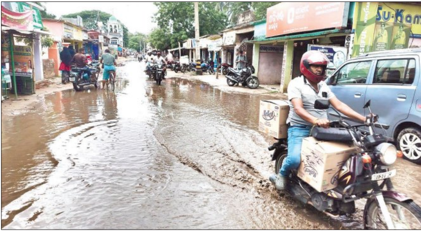
ବ୍ରହ୍ମବରଦା ବ୍ୟାଙ୍କ ଛକ ଗ୍ରାମର ଏକ ପ୍ରମୁଖ ବ୍ୟବସାୟ ସ୍ଥଳୀ ହୋଇଥିବା ବେଳେ ଏଠାରେ ଷ୍ଟେଟ୍ ବ୍ୟାଙ୍କ, ଏଟିଏମ୍ ସେଣ୍ଟର ଓ ଛୋଟବଡ଼ ଦୋକାନ ସହ ବହୁ ବ୍ୟବସାୟକ ପ୍ରତିଷ୍ଠାନମାନ ରହିଛି। ଯେଉଁ

ବହୁଆଁ ବାଲିଚନ୍ଦ୍ରପୁର ରାସ୍ତା ବ୍ରହ୍ମବରଦା ବ୍ୟାଙ୍କ ଛକ ଠାରୁ ମାଛ ମାର୍ଜେଟ୍ ପର୍ଯ୍ୟନ୍ତ ଏବେ ଦିନକୁ ଦିନ ଶୋଚନୀୟ ହେବାକୁ ଲାଗିଛି। ସାମାନ୍ୟ ବର୍ଷା ହେଲେ ରାସ୍ତା ଉପରେ ବର୍ଷା ଜଳ ଉଠୁଥିବା କୌଣସି ଡ୍ରେନେଜ ସୁବିଧା ନଥିବାରୁ ବର୍ଷା ଜଳ ନିଷ୍କାସନ ହୋଇ ନପାରି ରାସ୍ତାରେ ଦୀର୍ଘ ଦିନ ଧରି ପାଣି ଜମିରହୁଛି। ଫଳରେ ଗ୍ରାମବାସୀ ଯିବାଆସିବା କରିବାରେ ନାହିଁ ନଥିବା ଅସୁବିଧାର ସମ୍ମୁଖୀନ ହେଉଛନ୍ତି। ଯାହାକୁ ନେଇ ସାଧାରଣରେ ଅସନ୍ତୋଷ ପ୍ରକାଶ ପାଇଛି।