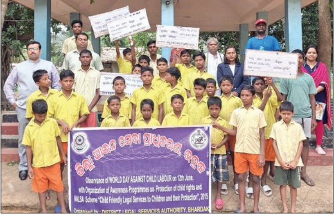
୬ ମାସରୁ ୧୨ ବର୍ଷ ପର୍ଯ୍ୟନ୍ତ କେଳବନ୍ଧ ଏବଂ ତଥା ଜୋରିମାନା ଦେବାକୁ ପଡ଼ିପରେ। ପୁନରାବୃତ୍ତି ଅପରାଧୀମାନଙ୍କୁ ୩ବର୍ଷ ପର୍ଯ୍ୟନ୍ତ ଅଧିକ କେଳବନ୍ଧ ହୋଇପାରେ। ବହୁଶିକ୍ଷା ବିଶ୍ଵାଳ, ପ୍ରତିପକ୍ଷ ଓକିଲ ଏବଂ ନ୍ୟାୟ ରକ୍ଷକ, ଭଦ୍ରକ, ଆଶ୍ରମ, ଶିଶୁ ଶ୍ରମିକ ପ୍ରସଙ୍ଗ, ଆଇନ ଏବଂ ନୀତି ଅନୁଯାୟୀ, ପିଲାମାନଙ୍କୁ ନିରୁକ୍ତି ଦେବା ଏକ କଠୋର ଅପରାଧ। ନିରୁକ୍ତିଦାତାମାନଙ୍କୁ

ଭଦ୍ରକ, ୧୨.୬ (ସମ୍ପାଦକ): ଶିଶୁ ଅଧିକାର ସୁରକ୍ଷା ଏବଂ ନାଲିଆ (ଶିଶୁଙ୍କ ଉପଯୋଗୀ ଆଇନଗତ ସେବା ଏବଂ ସେମାନଙ୍କ ସୁରକ୍ଷା) ଯୋଜନା, ୨୦୨୪ ଉପରେ ସଚେତନତା କାର୍ଯ୍ୟକ୍ରମ ଆୟୋଜନ ସହିତ 'ବିଶ୍ଵ ଶିଶୁ ଶ୍ରମ ନିରୋଧ ଦିବସ' କାର୍ଯ୍ୟକ୍ରମକୁ ପରିଚାଳନା କରିଥିଲେ ଏବଂ ଆଜିର ଏହି ଦିବସର ଆକାଶକୁ ସମ୍ପୂର୍ଣ୍ଣ ଭାବରେ କବିଥିଲେ ଯେ ଶିଶୁ ଶ୍ରମିକ ପ୍ରଥା ହେଉଛି କାତାୟ, ବିକାଶର ମୁଖ୍ୟ ପ୍ରତିବନ୍ଧକ।