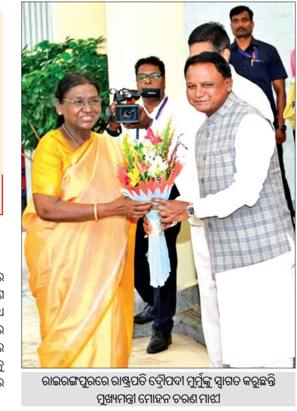
ରାଇରଙ୍ଗପୁରରେ ରାଷ୍ଟ୍ରପତି ଦ୍ରୌପଦୀ ମୁର୍ମୁଙ୍କୁ ସ୍ଵାଗତ କରୁଛନ୍ତି ମୁଖ୍ୟମନ୍ତ୍ରୀ ମୋହନ ଚରଣ ମାଝୀ

■ ବାରିପଦା, ୧୯।୬ (ସମିସ): ଦୁଇଦିନିଆ ଓଡ଼ିଶା ଗସ୍ତ ଅବସରରେ ଶୁକ୍ରବାର ସନ୍ଧ୍ୟାରେ ମୟୂରଭଞ୍ଜ ଜିଲ୍ଲାର ରାଇରଙ୍ଗପୁରରେ ପହଞ୍ଚିଛନ୍ତି ରାଷ୍ଟ୍ରପତି ଦ୍ରୌପଦୀ ମୁର୍ମୁ । ପ୍ରତିକୂଳ ପାଗ ଯୋଗୁଁ କେଳେକକୃଷ୍ଣାକୁ ସତ୍ତ୍ଵେ ପଥରେ ଆସି ରାଇରଙ୍ଗପୁରରେ ପହଞ୍ଚିବାବେଳେ ରାଜ୍ୟପାଳ ହରିବାବୁ କମ୍ପନୀପାଠୀ ଓ ମୁଖ୍ୟମନ୍ତ୍ରୀ ମୋହନ ଚରଣ ମାଝୀ ପ୍ରମୁଖ ରାଷ୍ଟ୍ରପତିଙ୍କୁ ଭବ୍ୟ ସ୍ଵାଗତ ଜଣାଇଛନ୍ତି । ଆସନ୍ତାକାଲି ପ୍ରଧାନମନ୍ତ୍ରୀ ନରେନ୍ଦ୍ର ମୋଦୀ ରାଇରଙ୍ଗପୁର ଆସିବେ ଏବଂ ରାଷ୍ଟ୍ରପତି ଓ ପ୍ରଧାନମନ୍ତ୍ରୀ ୪୭ ହଜାର କୋଟି ଟଙ୍କାର ବିଭିନ୍ନ ପ୍ରକଳ୍ପର ଉଦ୍‌ଘାଟନ ଓ ଶିଳାନ୍ୟାସ କରିବେ । ନିଜ ଜନ୍ମଭୂମି ଓ ପ୍ରଥମ କର୍ମଭୂମିରେ ପହଞ୍ଚିବା ପରେ ରାଷ୍ଟ୍ରପତି ଏମ୍ ଭୁବନେଶ୍ଵରର ସହାଧିକାରୀତାରେ ଆୟୋଜିତ ପ୍ରଥମ ମାଗଣା ସ୍ଵାସ୍ଥ୍ୟ ଶିବିରର ଶୁଭାରମ୍ଭ କରିଛନ୍ତି । ଏହାପରେ ରାଷ୍ଟ୍ରପତି କୁସୁମା ବୁକ ପାର୍କ ମେଘା ପାଠ୍ୟ ପୃଷ୍ଠା-୭