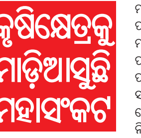
କୃଷିକ୍ଷେତ୍ରକୁ ମାଡ଼ିଆସୁଛି ମହାସଂକଟ

ମାତେନ୍-କୁଲିଆନ୍, ବୋକନ ଅନୁକୂଳ ପର୍ଯ୍ୟାୟରେ ନ ଥିବା ଯୋଗୁଁ ଭାରତ ମହାସାଗର ଅଞ୍ଚଳରେ ମେଘ ସୃଷ୍ଟି ହେବା ପାଇଁ କୌଣସି ସହଯୋଗ ମିଳିନଥିଲା । ପଶ୍ଚିମ ଉପକୂଳରେ ଦେଖାଦେଇଥିବା ସାମାନ୍ୟ ବର୍ଷାର ପ୍ରଭାବ ମଧ୍ୟ ଅଳ୍ପ ଦିନରେ ଶେଷ ହୋଇଯାଇଥିଲା । ସାମ୍ପ୍ରତିକ ସ୍ଥିତି ନିରାଶାଜନକ ଥିଲେ ମଧ୍ୟ ପାଣିପାଗ ପୂର୍ବାନୁମାନ ଅନୁଯାୟୀ ଆଗାମୀ ଦିନରେ ସ୍ଥିତି ସୁଧରିବାର ସମ୍ଭାବନା ରହିଛି । ଜୁନ୍ ଚତୁର୍ଥ ସପ୍ତାହ ଆଡ଼କୁ ବାୟୁମଣ୍ଡଳୀୟ ସ୍ଥିତି ଅନୁକୂଳ ହେବା ସହ ନିମ୍ନ ଭାଗର ବାୟୁ ପ୍ରବାହ ଏବଂ ପୂର୍ବାବାୟୁ ଶକ୍ତିଶାଳୀ ହେବ । ଏହି ପରିବର୍ତ୍ତନ ଶୁଣ୍ଠ ବାୟୁର ପ୍ରଭାବକୁ ଦୂର କରି ଭାରତରେ ମୌସୁମୀକୁ ପୁନର୍ବାର ସକ୍ରିୟ କରିବାର ସହାୟକ ହେବ ବୋଲି ଆଶା କରାଯାଇଛି ।