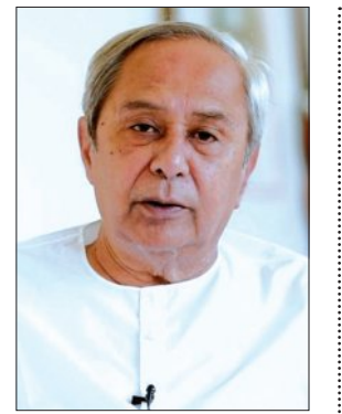
ପ୍ରସ୍ତୁତିଦିବ୍ୟାର ବିଫଳତା ଦର୍ଶାଇ ଲୋକଙ୍କୁ ନାୟ ଅଧିକାରୀରୁ ବଞ୍ଚିତ କରାଯାଇ ପାରିବ ନାହିଁ ୨୪ ବର୍ଷ ଧରି ମୋ ସରକାର ପ୍ରତି ୧୫ ଚାରିଖରେ ଦେଉଥିଲା ଭଉଁ ଏହି ମତେଲ ସୁପ୍ରିମକୋର୍ଟ ଦ୍ଵାରା ହୋଇଥିଲା ପ୍ରଶ୍ନାସିତ

■ ଭୁବନେଶ୍ଵର, ୧୯।୬ (ସମିସ): ରାଜ୍ୟରେ ଲକ୍ଷ ଲକ୍ଷ ଭଉଁ ହିତାଧିକାରୀ ଭଉଁ ଟଙ୍କା ନପାଇ ଦୁର୍ଦ୍ଦଶାରେ କାଳ କାଟୁଛନ୍ତି । ସରକାରଙ୍କ ଦାୟିତ୍ଵହୀନତାକୁ ନେଇ ବିଭିନ୍ନ ମହଲରେ ଖୋଲା ପ୍ରଶ୍ନ ଚାଲିଥିବା ବେଳେ ବିରୋଧୀ ଦଳ ନେତା ନବୀନ ପଟ୍ଟନାୟକ ମଧ୍ୟ ଏନେଇ ନିଜର ଚିନ୍ତା ପ୍ରକାଶ କରିଛନ୍ତି । ଏହିକ୍ରମରେ ଶୁକ୍ରବାର ମୁଖ୍ୟମନ୍ତ୍ରୀ ମୋହନ ଚରଣ ମାଝୀଙ୍କୁ ଚିଠି ଲେଖିଛନ୍ତି ନବୀନ । ଲଗାତାର ତିନି ମାସ ପାଇଁ ପେନସନ୍ ବନ୍ଦ କରିବା କେବଳ ଏକ ପ୍ରକ୍ରିୟାଗତ ବିଳମ୍ବ ନୁହେଁ; ଏହା ଶାସନ ବ୍ୟବସ୍ଥାର ଏକ ଗମ୍ଭୀର ବିଫଳତା ବୋଲି ଚିଠିରେ ନବୀନ ଖୋଲା ପ୍ରକାଶ କରିଛନ୍ତି । ସମାଜର ଦୁର୍ଦ୍ଦଶ ବର୍ଷର ଅନେକ ଲୋକେ ନିଜର ଦୈନିକ ଜୀବନଧାରଣ ପାଇଁ ଏହି ଭଉଁ ଟଙ୍କା ଉପରେ ସମ୍ପୂର୍ଣ୍ଣ ଭାବେ ନିର୍ଭରଶୀଳ ଥାଆନ୍ତି । ତେଣୁ ଦୂରନ୍ତ ମାନ୍ୟତା ବଞ୍ଚନ ପଦ୍ଧତିରେ ହିତାଧିକାରୀଙ୍କୁ ଭଉଁ ଟଙ୍କା ପ୍ରଦାନ ସହ ଭବିଷ୍ୟତରେ ଯେପରି ଏପରି ତ୍ରୁଟିର ପୁନରାବୃତ୍ତି ନହୁଏ, ତାହା ସୁନିଶ୍ଚିତ କରିବାକୁ ଚିଠିରେ ନବୀନ ଦାବି କରିଛନ୍ତି । ଚିଠିରେ ଶ୍ରୀ ପଟ୍ଟନାୟକ ଉଲ୍ଲେଖ କରି କହିଛନ୍ତି ଯେ ଓଡ଼ିଶାର ପ୍ରାୟ ୧୮ ଲକ୍ଷ ହିତାଧିକାରୀଙ୍କୁ ଗତ ତିନି ମାସ ହେଲା ଭଉଁ ପ୍ରଦାନ ନ କରାଯିବା ନେଇ ମୁଁ ଗଭୀର ଉଦବେଗ ଓ ଖୋଲା ପ୍ରକାଶ ପୃଷ୍ଠା-୭