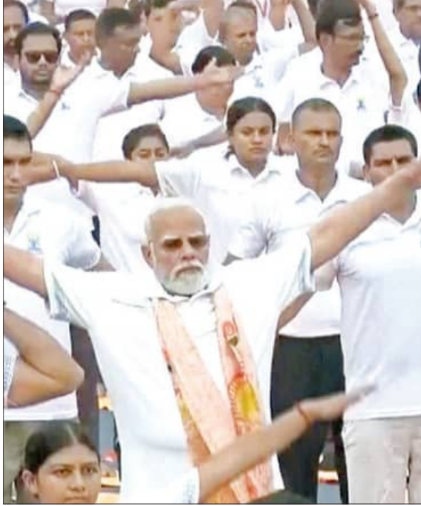
ଅନ୍ତର୍ଜାତୀୟ ଯୋଗ ଦିବସ ଅବସରରେ କୋଲକାତାର ରେଭୁ ଭୋଡ଼ରେ ପ୍ରଧାନମନ୍ତ୍ରୀ ନରେନ୍ଦ୍ର ମୋଦୀଙ୍କ ଯୋଗାଣସାଧ୍ୟ

ସତର୍କ କରାଯାଇଥିଲା। ଏହି ସମୟରେ ନାଗପୁରର ଜଣେ ପରୀକ୍ଷାର୍ଥୀଙ୍କୁ ବିଦେଶର ଅନୁସାଧିତ କେନ୍ଦ୍ର ମିଳିଥିବା ନେଇ ସୂଚି ହୋଇଥିବା ବିବାଦକୁ ଜାତୀୟ ପରୀକ୍ଷା ସଂସ୍ଥା ତୁରନ୍ତ ଯାଞ୍ଚ କରି ସମାଧାନ କରିଥିଲା ଏବଂ ଛାତ୍ରଙ୍କୁ ସ୍ଥାନୀୟ କେନ୍ଦ୍ର ଯୋଗାଇ ଦେଇଥିଲା। ଗତ ମେ ମାସର ପ୍ରଶ୍ନପତ୍ର ପ୍ରକାଶ ବିବାଦ ପରେ କେନ୍ଦ୍ର ସରକାର ଓ ଜାତୀୟ ପରୀକ୍ଷା ସଂସ୍ଥା ପାଇଁ ଏହି ପୁନଃ-ପରୀକ୍ଷା ସମ୍ପର୍କରେ ସହ ଶେଷ କରିବା ଏକ ବଡ଼ ଆହ୍ୱାନ ଥିଲା। ଏହି ବିଶାଳ ପରୀକ୍ଷାର ଶାନ୍ତିପୂର୍ଣ୍ଣ ସମାପ୍ତି ଦେଖି ଲକ୍ଷ ଲକ୍ଷ ଛାତ୍ରଛାତ୍ରୀ ଏବଂ ସେମାନଙ୍କ ଅଭିଭାବକଙ୍କ ମଧ୍ୟରେ ପରୀକ୍ଷା ପ୍ରକାଶ ପ୍ରତି ହଜିଯାଇଥିବା ବିଶ୍ୱାସକୁ ପୁଣିଥରେ ଫୋରାଇ ଆଣିବାରେ ସହାୟକ ହେବ ବୋଲି ଆଶା କରାଯାଉଛି।