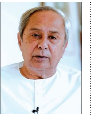
ପ୍ରସ୍ତୁତିଦିବ୍ୟାର ବିଫଳତା ଦର୍ଶାଇ ଲୋକଙ୍କୁ ନାୟମ ଅଧିକାରରୁ ବଞ୍ଚିତ କରାଯାଇ ପାରିବ ନାହିଁ । ୨୪ ବର୍ଷ ଧରି ମୋ ସରକାର ପ୍ରତି ୧୫ ତାରିଖରେ ଦେଉଥିଲା ଭଉଁ । ଏହି ମତେଲ ସୁପ୍ରିମକୋର୍ଟ ଦ୍ୱାରା ହୋଇଥିଲା ପ୍ରଶଂସିତ

ସମାଜର ଦୁର୍ଦ୍ଦଶ ବର୍ତ୍ତମାନ ଅନେକ ଲୋକେ ନିଜର ଦୈନିକ ଜୀବନଧାରଣ ପାଇଁ ଏହି ଭଉଁ ଟଙ୍କା ଉପରେ ସମ୍ପୂର୍ଣ୍ଣ ଭାବେ ନିର୍ଭରଶୀଳ ଥାଆନ୍ତି । ତେଣୁ ଦୁର୍ଦ୍ଦଶ ମାତ୍ରୁଆଳ ବନ୍ଧନ ପକ୍ଷରେ ହିତାଧିକାରୀଙ୍କୁ ଭଉଁ ଟଙ୍କା ପ୍ରଦାନ ସହ ଭବିଷ୍ୟତରେ ଯେପରି ଏପରି ତ୍ରୁଟିର ପୁନରାବୃତ୍ତି ନହୁଏ, ତାହା ସୁନିଶ୍ଚିତ କରିବାକୁ ଚିଠିରେ ନବୀନ ଦାବି କରିଛନ୍ତି । ଚିଠିରେ ଶ୍ରୀ ପଟ୍ଟନାୟକ ଉଲ୍ଲେଖ କରି କହିଛନ୍ତି ଯେ ଓଡ଼ିଶାର ପ୍ରାୟ ୧୮ ଲକ୍ଷ ହିତାଧିକାରୀଙ୍କୁ ଗତ ତିନି ମାସ ହେଲା ଭଉଁ ପ୍ରଦାନ ନ କରାଯିବା ନେଇ ମୁଁ ଗଭୀର ଉଦବେଗ ଓ ଖୋରା ପ୍ରକାଶ । ► ପୃଷ୍ଠା-୬