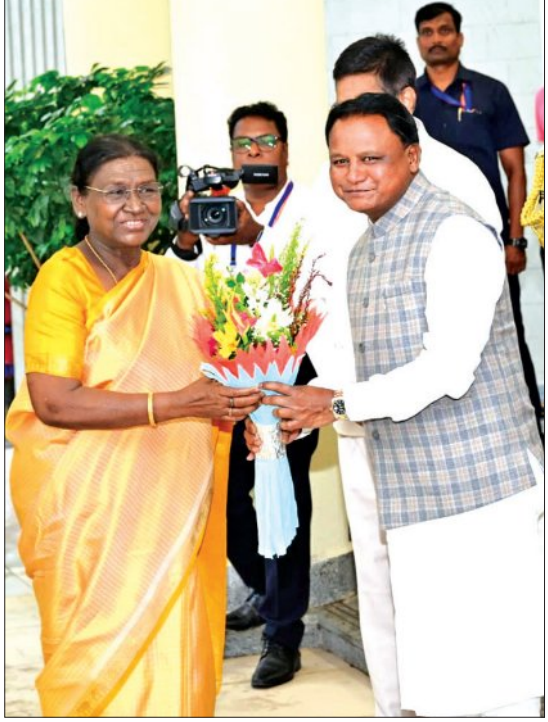
ରାଇରଙ୍ଗପୁରରେ ରାଷ୍ଟ୍ରପତି ଦ୍ରୌପଦୀ ମୂର୍ମୁଙ୍କୁ ସ୍ୱାଗତ କରୁଛନ୍ତି ମୁଖ୍ୟମନ୍ତ୍ରୀ ମୋହନ ଚରଣ ମାଝୀ

■ ବାରିପଦା, ୧୯।୬ (ସମ୍ପାଦକ): ଦୁଇଦିନିଆ ଓଡ଼ିଶା ଗସ୍ତ ଅବସରରେ ଶୁକ୍ରବାର ସନ୍ଧ୍ୟାରେ ମୟୂରଭଞ୍ଜ ଜିଲ୍ଲାର ରାଇରଙ୍ଗପୁରରେ ପହଞ୍ଚିଛନ୍ତି ରାଷ୍ଟ୍ରପତି ଦ୍ରୌପଦୀ ମୂର୍ମୁ । ପ୍ରତିକୂଳ ପାଗ ଯୋଗୁଁ କେଲେଜକୁଣ୍ଡା ସଡ଼କ ପଥରେ ଆସି ରାଇରଙ୍ଗପୁରରେ ପହଞ୍ଚିବାବେଳେ ରାଜ୍ୟପାଳ ହରିବାବୁ କମ୍ପ୍ୟୁଟର ଓ ମୁଖ୍ୟମନ୍ତ୍ରୀ ମୋହନ ଚରଣ ମାଝୀ ପ୍ରମୁଖ ରାଷ୍ଟ୍ରପତିଙ୍କୁ ଭବ୍ୟ ସ୍ୱାଗତ ଜଣାଇଛନ୍ତି । ଆସନ୍ତାକାଳି ପ୍ରଧାନମନ୍ତ୍ରୀ ନରେନ୍ଦ୍ର ମୋଦୀ ରାଇରଙ୍ଗପୁର ଆସିବେ ଏବଂ ରାଷ୍ଟ୍ରପତି ଓ ପ୍ରଧାନମନ୍ତ୍ରୀ ୪୭ ହଜାର କୋଟି ଟଙ୍କାର ବିଭିନ୍ନ ପ୍ରକଳ୍ପର ଉଦ୍‌ଘାଟନ ଓ ଶିଳାନ୍ୟାସ କରିବେ । ନିଜ ଜନ୍ମଭୂମି ଓ ପ୍ରଥମ କର୍ମଭୂମିରେ ପହଞ୍ଚିବା ପରେ ରାଷ୍ଟ୍ରପତି ଏମ୍ ଭୁବନେଶ୍ୱରର ସହାରିଗିଡ଼ାରେ ଆୟୋଜିତ ପ୍ରଥମ ମାଗଣା ସ୍ୱାସ୍ଥ୍ୟ ଶିବିରର ଶୁଭାରମ୍ଭ କରିଛନ୍ତି । ଏହାପରେ ରାଷ୍ଟ୍ରପତି କୁସୁମା ବୁକ ପାଲି ମେଘା ପାଠ୍ୟ । ► ପୃଷ୍ଠା-୬