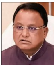
୧୨୮ ମେଡିକାଲ ଅଫିସର ଓ ଡେଭିଲ୍ ସର୍ଜନ ବିରୋଧରେ ଶୁଖିକାଗତ କାର୍ଯ୍ୟାନୁଷ୍ଠାନ ନିର୍ଦ୍ଦେଶ ଦେଲେ ମୁଖ୍ୟମନ୍ତ୍ରୀ