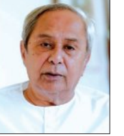
'ଓଡ଼ିଆ ଅକ୍ଷର' ନାମା ଦେଇ ଶିକ୍ଷକ ହାସଲ ପରେ ଓଡ଼ିଆ ଭାଷା ଓ ଲିପିକୁ ସର୍ବାଧିକ କଦର୍ଥ କରାଯାଇଛି

ଭୁବନେଶ୍ୱର, ୧୬।୬ (ଏକେନ୍ସି): ପ୍ରଥମରୁ ଅଷ୍ଟମ ଶ୍ରେଣୀ ପାଠ୍ୟପୁସ୍ତକରେ ଶହଶହ ତୁଟି ଘଟଣାରେ ରାଜ୍ୟ ସରକାରଙ୍କ ଉପରେ ବର୍ଷଛକ୍ତି ବିରୋଧୀ ଦଳ ନେତା ନବୀନ ପଟ୍ଟନାୟକ। ସେ କହିଛନ୍ତି ଯେ ପିଲାଙ୍କ ପଢ଼ା ବହିରେ ମାଳିଆ ତୁଟି ବାହାରିବା ବିକେପି ସରକାରର ଅତ୍ୟନ୍ତ ଦାୟିତ୍ୱହୀନ ତଥା ଖାମଖୁଆଳି ମନୋଭାବକୁ ଦର୍ଶାଉଛି। ପିଲାମାନଙ୍କୁ ରାଜ୍ୟ ସରକାର ଠିକ୍ ମୁଷା-୭