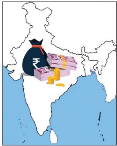
ସ୍ଥିତିର ତୁଟାୟ ବାର୍ଷିକ ସମାକ୍ଷାରେ ସ୍ଥାନ ପାଇଛି ଏପରି ବିଭାଜନକ ତଥ୍ୟ।

ନୂଆଦିଲ୍ଲୀ, ୧୬।୬ (ଏକେନ୍ସି): ବଡ଼ ବଡ଼ ଚାଲିଛି ରାଜ୍ୟଗୁଡ଼ିକର ରଣ ଭାର। ବର୍ଷକୁ ବର୍ଷ ରାଜ୍ୟ ନିଅଣ୍ଟିଆ ସ୍ଥିତି ରାଜ୍ୟଗୁଡ଼ିକର ଆର୍ଥିକ ସ୍ୱାସ୍ଥ୍ୟକୁ ଉନ୍ନତ କରିବାରେ ଲାଗିଛି। ବର୍ତ୍ତମାନ ଦେଶର ୨୮ଟି ରାଜ୍ୟର ମୋଟ ରଣ ଭାର ଗତ ୧୦ ବର୍ଷ ମଧ୍ୟରେ ପାଖାପାଖି ତିନିଗୁଣ ହୋଇଛି। ୨୦୧୫-୧୬ ଆର୍ଥିକ ବର୍ଷରେ ରାଜ୍ୟଗୁଡ଼ିକର ରଣଭାର ୩୧.୨୦ ଲକ୍ଷ କୋଟି ଟଙ୍କା ବୃଦ୍ଧି ପାଇ ୯୦.୫ ଲକ୍ଷ କୋଟି ଟଙ୍କା ଅତିକ୍ରମ କରିଛି। ଏହାମଧ୍ୟରୁ ୧୮ଟି ରାଜ୍ୟର ଆର୍ଥିକ ସ୍ୱାସ୍ଥ୍ୟ ଅତି ସକଟାପନ୍ନ; ଏହି ରାଜ୍ୟଗୁଡ଼ିକ ବିଭାୟନ ନିଅଣ୍ଟର ୩୯% ସୀମା ଅତିକ୍ରମ କରିଛନ୍ତି। ଓଡ଼ିଶା ମଧ୍ୟ ଏଥିରୁ ବାଦ ପଡ଼ିନାହିଁ। ମାତ୍ର ବର୍ଷକ ମଧ୍ୟରେ ଓଡ଼ିଶାର ବିଭାୟନ ନିଅଣ୍ଟ ୨୫% ଅଧିକ ବୃଦ୍ଧି ଘଟିଛି। ମହାଲୋକାଳ ନିୟନ୍ତ୍ରଣ ଏବଂ ମହା ସମାକ୍ଷାକ (ସିଏଜି)ଙ୍କ ଦ୍ୱାରା ଜାରି ରାଜ୍ୟଗୁଡ଼ିକର ଆର୍ଥିକ