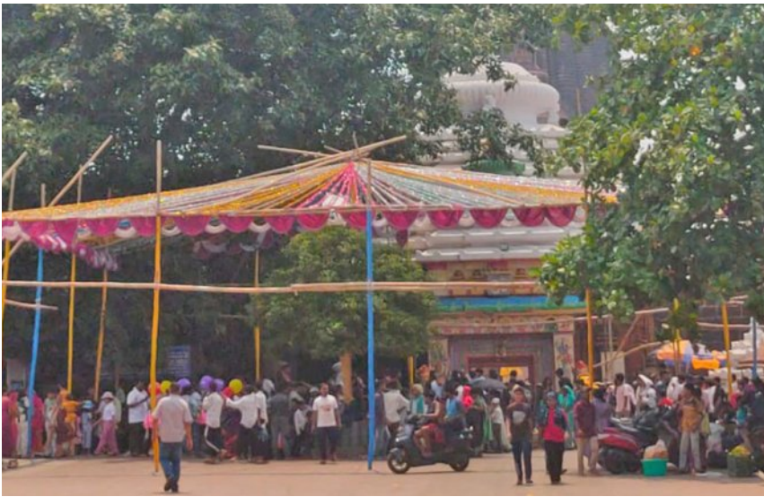
କରିବା ପାଇଁ ଘଣ୍ଟ ବାଦ୍ୟ, ମାଣ୍ଡଳ ଧରି ଲିଙ୍ଗରାଜଙ୍କ ସେବାୟତମାନେ ଖେଚୁଡ଼ି ଭୋଗ ସର୍ପପଟା କରି ଦିଅଁଙ୍କ ବିବାହ ପାଇଁ ନିମନ୍ତଣ କରି ଆସିଥାନ୍ତି ବୋଲି ସଚିତାନ୍ତ ପୂଜାପଣ୍ଡା କହିଛନ୍ତି। ଏହିପରି ଗୁରୁବାର ବିବାହ ସରିବା ପରେ ଶୁକ୍ରବାର କଦାବରୀର ମନ୍ଦିରରୁ ନବଦମ୍ପତିଙ୍କୁ ଶୋଭାଯାତ୍ରାରେ

■ ଆଜି ମଙ୍ଗଳ କାଳି ଲିଙ୍ଗରାଜଙ୍କ ବାହାଘର ■ ଘଣ୍ଟ ବାଦ୍ୟରେ ନଗର ପରିକ୍ରମା କରିବେ ଦେବ ଦମ୍ପତି