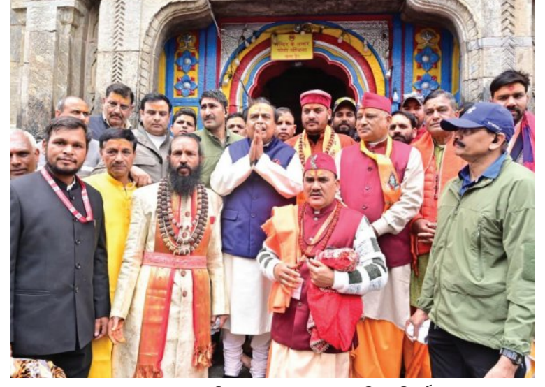
ମୁକେଶ୍ ଆମ୍ବାନୀଙ୍କ ବସ୍ତ୍ରଧାରଣ ଏବଂ କୋଚିରନାଥ ମନ୍ଦିର ପରିବର୍ତ୍ତନ

ନୂଆଦିଲ୍ଲୀ, ୧୫।୬ (ଏକେଡି): ଭାରତର ସର୍ବବୃହତ୍ କର୍ପୋରେଟ୍ ଗ୍ରୁପ୍ ରିଲାଏନ୍ସ ପାଇଁ ଆସିଛି ବଡ଼ ଉପଲବ୍ଧି । କମ୍ପାନୀର ଡିଜିଟାଲ୍ ଶାଖା ଜିଓ ପୁରୀପର୍ଯ୍ୟନ୍ତ ବିଶ୍ୱବୈଦିକ ସମ୍ପର୍କିତ ୨୦ କମ୍ପାନୀ ମଧ୍ୟରେ ସ୍ଥାନ ପାଇଛି । ଏହି ଖବର ଆସିବା ପରେ ଜିଓର ଶେୟାର ମୂଲ୍ୟ ପ୍ରାୟ ୨ ପ୍ରତିଶତ ବୃଦ୍ଧି ପାଇଛି । ଗତ କିଛି ବର୍ଷ ଧରି ଜିଓ ୫ଜି, କୃତ୍ରିମ ବୁଦ୍ଧିମତା ('ଏଆଇ'), ଭାଇଡ୍ କମ୍ପ୍ୟୁଟିଂ, ଡିଜିଟାଲ୍ ସେବା ଏବଂ ଟେଲିକମ୍ ପ୍ରଯୁକ୍ତି କ୍ଷେତ୍ରରେ ବ୍ୟାପକ ନିବେଶ କରିଆସୁଛି । ଏହି ଉଦ୍ଦେଶ୍ୟ ଓ ନବତ୍ୱକ ପ୍ରୟାସର ପରିଣାମ ସ୍ୱରୂପ କମ୍ପାନୀ ବିଶ୍ୱସ୍ତରୀୟ ପେଟେଣ୍ଟ ତାଲିକାରେ ଉଚ୍ଚ ସ୍ଥାନ ହାସଲ କରିପାରିଛି । ବଜାର ବିଶେଷଜ୍ଞମାନଙ୍କ ମତରେ ଏହି ସଫଳତା କମ୍ପାନୀର ଦୀର୍ଘମିଆଦୀ ଅଭିବୃଦ୍ଧି ସମାବେଶକୁ ଆହୁରି ମଜବୁତ କରିଛି ।