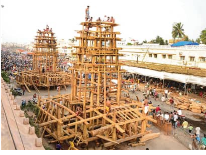
ବା ବଟେ ବାଡ଼ିଆ କାର୍ଯ୍ୟ ଜାରି ରହିଛି। ରୂପକାର ସେବକମାନେ ତୃତୀୟଭୂଇଁ ଉପରେ କାଠର ବାରି ନାହାକାକୁ ମଜଲୁତ କରିବା ପାଇଁ ବାରି ନାହାକାର ଉଭୟ ପାର୍ଶ୍ଵରେ ମୂଳ କଳସି ବାଡ଼ିଆ ଯିବ। ସେଥିପାଇଁ ମହାରଣା ସେବକମାନେ ୨୦ ଫୁଟିଆ କାଠ ପକିକୁ ଚଉପଟ ଆରମ୍ଭ କରିଛନ୍ତି। ସେଥିରେ ମାପ ପ୍ରକାରେ କାପ ଖୋଦେଇ ସହ ସୋମବାର ରଥରେ କଳସିକୁ ଲୁଚି କରି ବାଡ଼ାଯିବ। ଏଥିସହ ରବିବାର ରଥ ଉପର ଫିଙ୍ଗାସନ ବେଦୀ ଭଉଣ ପାର୍ଶ୍ଵରେ ତାରୁ

ପୁରୀ, ୧୪.୬ (ସମ୍ପାଦକ): ରଥଯାତ୍ରାକୁ ଆଉ ପାଖାପାଖି ମାସେରହିଲା। ବଡ଼ଦାଣ୍ଡରେ ଗଡ଼ିବ ତିନିରଥ। ଏପଟେ ରଥଖଳାରେ ବି କାମ ଆରମ୍ଭ ହେଇଛି। ରବିବାର ଅପରାହ୍ଣରେ ତିନି ରଥର ତୃତୀୟ ଭୂଇଁ ଉପରେ ସ୍ଥାପନ ହୋଇଛି ଏକ ନମ୍ବର ବଡ଼ ଥଳ ପୋଟଳ। ଏବେ ତିନି ରଥ ଚାଳିରେ ବାକି ପୋଟଳଗୁଡ଼ିକର ନିର୍ମାଣ କାର୍ଯ୍ୟ ଜାରି ରହିଛି। (ତିନି ରଥର ଏହି ପୋଟଳ ୧୩ ପରସ୍ତ ବିଶିଷ୍ଟ, ଏହା ରଥର ଶେଷ ଭୂଇଁ ଉପରୁ ନିର୍ମାଣ ହୋଇଥାଏ, ଏହାର ଗଠନ ଶୈଳୀ ଶ୍ରୀମନ୍ଦିର ଶାସ୍ତ୍ର ଭାଗ ଅଂଶ ନିର୍ମାଣମାନ ହୋଇଥାଏ)। ଏଥିସହ ତିନିରଥର ବାରି ନାହାକାକୁ ମଜଲୁତ କରିବା ପାଇଁ ବାରି ନାହାକାର ଉଭୟ ପାର୍ଶ୍ଵରେ ମୂଳ କଳସି ବାଡ଼ିଆ ଯିବ। ସେଥିପାଇଁ ମହାରଣା ସେବକମାନେ ୨୦ ଫୁଟିଆ କାଠ ପକିକୁ ଚଉପଟ ଆରମ୍ଭ କରିଛନ୍ତି। ସେଥିରେ ମାପ ପ୍ରକାରେ କାପ ଖୋଦେଇ ସହ ସୋମବାର ରଥରେ କଳସିକୁ ଲୁଚି କରି ବାଡ଼ାଯିବ। ଏଥିସହ ରବିବାର ରଥ ଉପର ଫିଙ୍ଗାସନ ବେଦୀ ଭଉଣ ପାର୍ଶ୍ଵରେ ତାରୁ