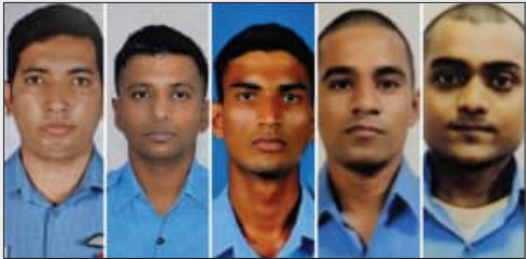
ଶୋକ ପ୍ରକାଶ କଲେ ନବୀନ