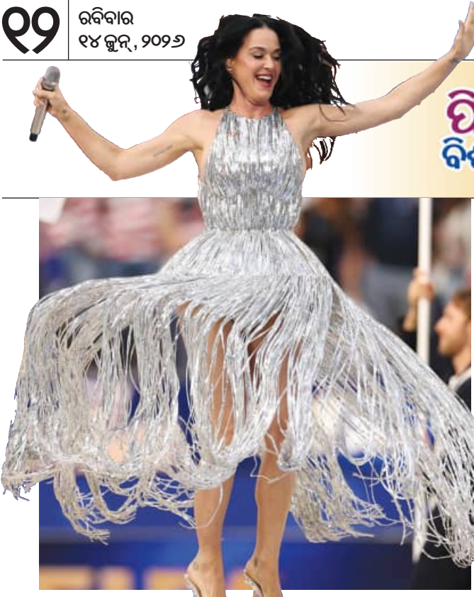
ଆମେରିକାରେ ଶନିବାର ସକାଳେ ଅନୁଷ୍ଠିତ ବିଶ୍ୱକପ ଉଦ୍‌ଘାଟନା ଉତ୍ସବରେ କେଟି ପେରା