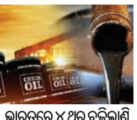
ଭାରତରେ ୪ ଥର ବଢ଼ିଲାଣି

■ ନୂଆଦିଲ୍ଲୀ, ୧୩।୬ (ଏକେଡି): ଅନ୍ତର୍ଜାତୀୟ ବଜାରରେ ଅଶୋଧିତ ତୈଳ ମୂଲ୍ୟରେ ବୃହତ ହ୍ରାସ ଘଟିଛି। ପଶ୍ଚିମ ଏସିଆରେ ଶାନ୍ତି ଆଣା ମଧ୍ୟରେ ଅଶୋଧିତ ତୈଳ ମୂଲ୍ୟ ଦ୍ରୁତ ଗତିରେ ହ୍ରାସ ପାଇ ତିନି ମାସର ସର୍ବନିମ୍ନ ସ୍ତରକୁ ଖସିଯାଇଛି। ବିଶ୍ୱ ବଜାରରେ ଅଶୋଧିତ ତୈଳ ମୂଲ୍ୟ ପ୍ରତି ବ୍ୟାରେଲ ୩୪୨୦ ଡଲାର ହ୍ରାସ ପାଇ ୮୪୨୯୦ ଡଲାରକୁ ଖସିଯାଇଛି। ତୈଳ ଦରରେ ହ୍ରାସର ଲାଭ କିନ୍ତୁ ଖାରଜକୁ ମିଳିପାରିନାହିଁ। ବିଶ୍ୱ ବଜାରରେ ମହଙ୍ଗା ତେଲ ଦର ଯୋଗୁ ଭାରତରେ ପେଟ୍ରୋଲ ଏବଂ ଡିଜେଲ ମୂଲ୍ୟ ବଢ଼ିଯାଇଥିଲା। ହେଲେ ଏବେ ଦର କମିଯିବାବେଳେ ତେଲ କମ୍ପାନୀ ନିରବ। ଭାରତରେ ତୈଳ ବିପଣନକାରୀ କମ୍ପାନୀ(ଓଏମ୍ପି)