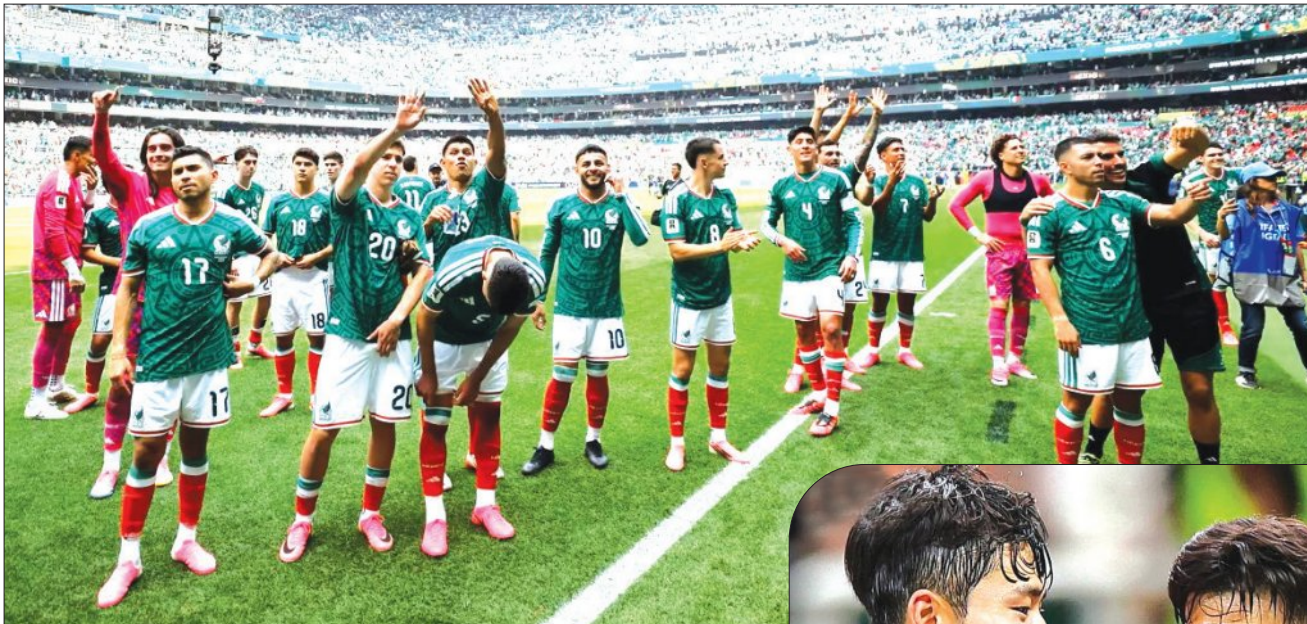
ମେକ୍ସିକୋ ସିରି, ୧୨.୧୨ (ଏକେଡ଼ି)

ମୁଗୁଆୟୋକ ମେକ୍ସିକୋ ଏବଂ ଦକ୍ଷିଣ କୋରିଆ ୨୩ତମ ଫିଫା ବିଶ୍ୱକପର ଉଦ୍‌ଘାଟନା ଦିବସରେ ବିଜୟ ହାସଲ କରିଛନ୍ତି। ମେକ୍ସିକୋ ସିରିରେ ଖେଳାଯାଇଥିବା ଉଦ୍‌ଘାଟନା ମୁକାବିଲାରେ ମେକ୍ସିକୋ ୨-୦ ଗୋଲରେ ଦକ୍ଷିଣ ଆଫ୍ରିକାକୁ ପରାସ୍ତ କରିଛି। ବିଜୟୀ ଦଳ ପକ୍ଷରୁ ଲୁଇଆନ୍ କ୍ରିନୋନ୍ସ ଓ ରେଟେରାନ ଷ୍ଟାଲକର ରଲ୍ କିମିନେଜ୍ ଗୋଟିଏ ଲେଖାଏଁ ଗୋଲ ଘୋର କରିଥିଲେ। ଦଳ ଏହି ବିଜୟ ସହ ଗ୍ରୁପ୍-ଏର