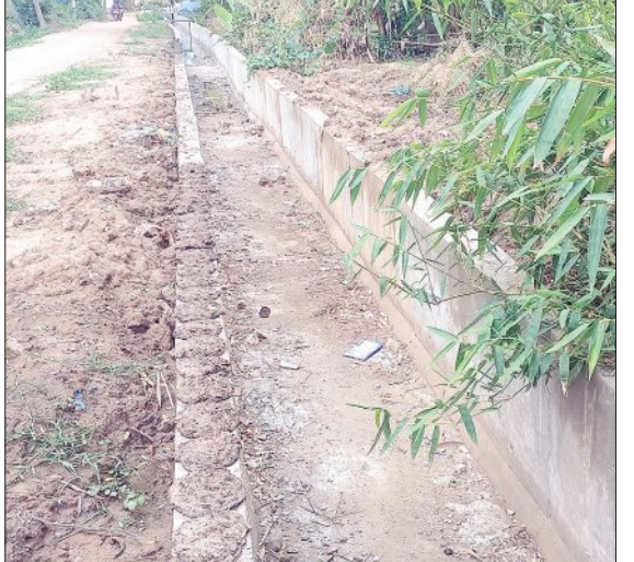
ଲେଭୁଲ କରି କାର୍ଯ୍ୟ କରୁଥିବାରୁ ବହୁ କେନାଲର ତଳ ପୃଷ୍ଠକୁ କୃଷକ ଗଭୀର ହୋଇଯାଇଛି । ଯାହାଦ୍ଵାରା କେନାଲର ସମତଳ ସ୍ତରର ବହୁ ଉପରେ ଚାଷ ଜମି ରହିଯାଉଥିବାରୁ କେନାଲରେ ପାଣି ଆସିଲେ ଜମିରେ ମାଡ଼ିବା ନେଇ

ରାଜ୍ୟ ସରକାର କୃଷି ଓ କୃଷକର ବିକାଶ ପାଇଁ ଜମିକୁ ଉପଯୁକ୍ତ ଜଳସେଚନ କରିବା ନିମନ୍ତେ କେନାଲଗୁଡ଼ିକୁ କ୍ୟୁଟ୍ ଲାଇନିଂ କରାଉଛନ୍ତି । ଚାଷ ଜମିକୁ ସହଜରେ ପାଣିମାଡ଼ିବା ଓ କେନାଲର ଶେଷ ପୃଷ୍ଠକୁ ପାଣି ପହଞ୍ଚିବା ଲକ୍ଷ୍ୟ ରଖି ସରକାରଙ୍କ ପକ୍ଷରୁ ଗୁରୁତ୍ଵ ଦିଆଯାଉଛି । ହେଲେ ବିଭାଗୀୟ ଯନ୍ତ୍ରାମାନଙ୍କର ଦୂରଦୂର୍ଷ୍ଟି ଅଭାବରୁ ଏହି କେନାଲ କ୍ୟୁଟ୍ ଲାଇନିଂ କାର୍ଯ୍ୟ ସଠିକ୍ ଭଙ୍ଗରେ କରାଯାଇ ନଥିବାରୁ ଆସନ୍ତା ଖରିପ ଧାନଚାଷ ପାଇଁ ଚାଷୀମାନଙ୍କ ଚାଷ କ୍ଷେତ୍ରକୁ ଠିକ୍ ଭାବେ ଜଳସେଚନ ହୋଇପାରିବ ନାହିଁ ବୋଲି ବହୁ ଚାଷୀ ପ୍ରକାଶ କରିଛନ୍ତି । ଫଳରେ ତଳିତ ବର୍ଷ ଖରିପ ଧାନଚାଷ ପାଇଁ ଚାଷୀମାନେ ଜଳସେଚନ ପାଇଁ ହଟହଟା ହେବାର ଆଶଙ୍କା ପ୍ରକାଶ ପାଇଛି । ଚାଷ ଜମିର ଉଚ୍ଚତାକୁ ଲକ୍ଷ୍ୟ କରାଯାଇ ତତ୍କାଳୀନ ବିଭିନ୍ନ ସରକାର କେନାଲଗୁଡ଼ିକୁ ଖୋଳି ଜଳସେଚନର ସୁବିଧା କରାଯାଇଥିଲା । ସେହି ଅନୁଭବ ଜଳସେଚନ କାର୍ଯ୍ୟକ୍ରମଗୁଡ଼ିକରେ କେନାଲଗୁଡ଼ିକର ସମତଳ ସ୍ତର (ଲେଭୁଲ) ଲିପିବଦ୍ଧ ହୋଇ ରହିଥିବା ବେଳେ ଏହାକୁ ଅନୁସରଣ ନକରି ବର୍ତ୍ତମାନର ଯନ୍ତ୍ରାମାନେ ମନଇଚ୍ଛା କାର୍ଯ୍ୟ କରୁଛନ୍ତି । ଯାହାଦ୍ଵାରା କ୍ୟୁଟ୍ ଲାଇନିଂ ହୋଇଥିବା କେନାଲଗୁଡ଼ିକର ସମତଳ ସ୍ତର ଠିକ୍ ରହୁନାହିଁ । ବର୍ତ୍ତମାନ ଉକ୍ତ କେନାଲ ଚାଷ ଜମିର ବହୁ ତଳେ ରହିଯାଇଛି । କେନାଲ ଲାଇନିଂ କରିବା ସମୟରେ ଯନ୍ତ୍ରାମାନେ ଗୋଟିଏ ପୃଷ୍ଠରୁ ସାଧାରଣ ଭାବେ ଠିକାଦାରଙ୍କ ସୁବିଧା ପ୍ରଦାନକ