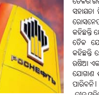
ରୁଷିଆରୁ ଜାରି ରହିବ ତେଲ ଯୋଗାଣ

ନୂଆଦିଲ୍ଲୀ, ୭।୬ (ଏକେନି): ପଶ୍ଚିମ ଏସିଆ ସଙ୍କଟ ଓ ବୈଶ୍ୱିକ ତେଲ ବଜାରରେ ଜାରି ଅନିଶ୍ଚିତତା ମଧ୍ୟରେ ଭାରତ ଲାଗି ଏକ ସକାରାତ୍ମକ ଖବର ଆସୁଛି । ରଷିଆ ସରକାର ତେଲ କମ୍ପାନୀ ରୋସ୍ନେଫ୍ ଏକ ବୟାନରେ ଭାରତକୁ ଅଗୋଧିଅଗ ତେଲ ଯୋଗାଣ ଜାରି ରହିବ ବୋଲି ପୁଷ୍ଟି କରିଛି । ବର୍ତ୍ତମାନ ସମୟରେ ଯେତେବେଳେ ଯୋଗାଣ ଓ ସିଫ୍ ମାର୍ଗକୁ ନେଇ ଚିନ୍ତା ଲାଗି ରହିଛି ସେଥିରେ ରଷିଆର ଏହି ଆଶ୍ୱାସନ ଭାରତର ଉର୍ଦ୍ଧା ସୁରକ୍ଷା ଦିଗରେ ଅତ୍ୟନ୍ତ ଗୁରୁତ୍ୱପୂର୍ଣ୍ଣ ମନେ କରାଯାଉଛି । ଏଥିରୁ ଦେଶକୁ ଏ ପର୍ଯ୍ୟନ୍ତ ଭାରତ ଓ ଚୀନ ରିହାତି ଦରରେ ରଷିୟା ତେଲ ମିଳିବାର ସମ୍ଭାବନା ରହିଛି ।