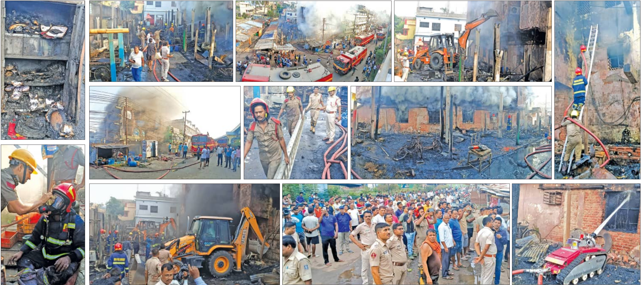
କଟକ, ୧।୬ (ସମିଧ):

ପ୍ରେକ୍ଷକ ମାଛ ମାର୍କେଟ ଓ ନିକଟସ୍ଥ ବିଜ୍ଞାନ ପରିଦର୍ଶନ ଥିବା ବ୍ୟାଙ୍କ ଅଞ୍ଚଳରେ ନିଆଁ ଲାଗିଲା ପରେ ଉଭୟ ମାଛ ବ୍ୟବସାୟ ଓ ବ୍ୟାଙ୍କ ଗ୍ରାହକଙ୍କ ମଧ୍ୟରେ ଆଶଙ୍କା ସୃଷ୍ଟି ହୋଇଛି । ମାଛ ବ୍ୟବସାୟ ଓ ବ୍ୟାଙ୍କ ଗ୍ରାହକଙ୍କ ମଧ୍ୟରେ ଆଶଙ୍କା ସୃଷ୍ଟି ହୋଇଛି । ମାଛ ବ୍ୟବସାୟ ଓ ବ୍ୟାଙ୍କ ଗ୍ରାହକଙ୍କ ମଧ୍ୟରେ ଆଶଙ୍କା ସୃଷ୍ଟି ହୋଇଛି ।