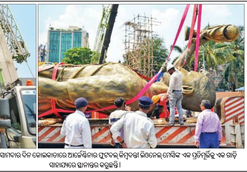
ପୂର୍ବ ବିଭାଗ କର୍ମଚାରୀମାନେ ସୋମବାର ଦିନ କୋଲକାତାରେ ଆଇସିଏମଆର ପୁସ୍ତକଲିପ୍ଟରକୁ ଲିଓନେଲ୍ ମେସିଙ୍କ ଏକ ପ୍ରତିମୂର୍ତ୍ତିକୁ ଏକ ବଡ଼ ସାହାଯ୍ୟରେ ସ୍ଥାନାନ୍ତର କରୁଛନ୍ତି ।

ଆମେରିକା ରାଷ୍ଟ୍ରପତି ଡୋନାଲ୍ଡ୍ ଟ୍ରମ୍ପ ସାମାଜିକ ଗଣମାଧ୍ୟମରେ କେନ୍ଦ୍ରରେ ଯେ ଇରାନ ପ୍ରକୃତରେ ଏକ ରୁଚ୍ଛି କରିବାକୁ ଚାହୁଁଛି, ଯାହା ଆମେରିକା ପାଇଁ ଭଲ ସାଧ୍ୟତା ହେବ । ଅନ୍ୟପକ୍ଷେ, ଇସ୍ରାଏଲ୍ ପ୍ରଧାନମନ୍ତ୍ରୀ ବେନ୍ୟାମିନ୍ ନେତନ୍ୟାହୁ ଏବଂ ପ୍ରତିରକ୍ଷା ମନ୍ତ୍ରୀ କେବୀନ ନର ଗୋଲାନ ବେନ୍ୟୁର ବରକିଶ ଉପକଣ୍ଠରେ ଥିବା ଇରାନ ସମର୍ଥକ ହିଜ୍‌ବୁଲ୍ଲା ଫରଠନର ଆଶ୍ଚା ଉପରେ ଆକ୍ରମଣକୁ ଆହୁରି ଜୋରଦାର କରିବାକୁ ସେମାନଙ୍କୁ ନିର୍ଦ୍ଦେଶ ଦେଇଛନ୍ତି ।