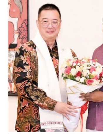
ମୁଖ୍ୟମନ୍ତ୍ରୀ ମୋହନ ଚରଣ ମାଝୀ ଲୋକସଭାରେ ଉପସ୍ଥାପିତ ସିଙ୍ଗାପୁରର ହାଇକମିଶନର ସାଙ୍ଗରେ ଭେଟାବସ୍ତା କରିଥିବା ଜଣାପଡ଼ିଛି।

ଭୁବନେଶ୍ୱର, ୧୭।୬ (ସମ୍ପାଦକ): ମୁଖ୍ୟମନ୍ତ୍ରୀ ମୋହନ ଚରଣ ମାଝୀ ଲୋକସଭାରେ ଉପସ୍ଥାପିତ ସିଙ୍ଗାପୁରର ହାଇକମିଶନର ସାଙ୍ଗରେ ଭେଟାବସ୍ତା କରିଥିବା ଜଣାପଡ଼ିଛି।