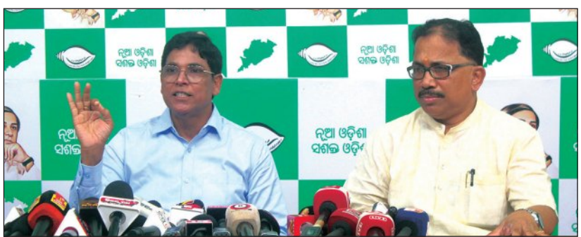
ଓଡ଼ିଶାକୁ କେନ୍ଦ୍ରୀୟ ଅନୁଦାନ ହ୍ରାସ ପାଇବାର ସମ୍ଭାବନା ରହିଛି।

ଭୁବନେଶ୍ୱର, ୧୭।୬ (ସମ୍ପାଦକ): ଓଡ଼ିଶାକୁ କେନ୍ଦ୍ରୀୟ ଅନୁଦାନ କମିବା ଉଦ୍ଦେଶ୍ୟରେ କେନ୍ଦ୍ର ସରକାରର ଉଦ୍ଦେଶ୍ୟରେ କେନ୍ଦ୍ରୀୟ ଅନୁଦାନ ହ୍ରାସ ପାଇବାର ସମ୍ଭାବନା ରହିଛି।