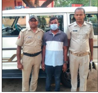
ଓଡ଼ିଆ ବିଧାନସଭାର ଉପବାଚସ୍ପତିକ ଜାଲ ଦସ୍ତଖତ କରି ବଦଳି ହେବା ସହକାରୀ ନିର୍ବାହୀ ଯନ୍ତ୍ରୀଙ୍କ ଲାଗି ମହତ୍ତ୍ୱପୂର୍ଣ୍ଣ ପଦକ୍ଷେପ ଗ୍ରହଣ କରାଯାଇଛି।

ଭୁବନେଶ୍ୱର ୧୭।୬ (ସମ୍ପାଦକ): ଓଡ଼ିଆ ବିଧାନସଭାର ଉପବାଚସ୍ପତିକ ଜାଲ ଦସ୍ତଖତ କରି ବଦଳି ହେବା ସହକାରୀ ନିର୍ବାହୀ ଯନ୍ତ୍ରୀଙ୍କ ଲାଗି ମହତ୍ତ୍ୱପୂର୍ଣ୍ଣ ପଦକ୍ଷେପ ଗ୍ରହଣ କରାଯାଇଛି।