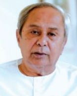
'ଓଡ଼ିଆ ଅସ୍ମିତା' ନାମା ଦେଇ ଶିକ୍ଷକ ହାସଲ ପରେ ଓଡ଼ିଆ ଭାଷା ଓ ଲିପିକୁ ସର୍ବାଧିକ କଦର୍ଥ କରାଯାଇଛି