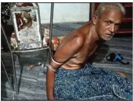
ଏହି ଗାଁର ପକ୍ଷାଘାତ ରୋଗୀ କୃଷକ ସାହୁଙ୍କୁ ଗୋଟିଏ ସାପ ଦାବୀ ୨ ଘଣ୍ଟା ଧରି ବାନ୍ଧି ରଖିଥିଲା। ସେ ଘରେ ଶୋଇଥିବା

ବୌଦ୍ଧ, ୩୧।୫ (ସମ୍ବିଧ): ବୌଦ୍ଧ ଜିଲ୍ଲା ହରଭଙ୍ଗା ବ୍ଲକ୍ ଆଡ଼େନିଗଡ଼ ଗ୍ରାମରେ ଏକ ଭୟଙ୍କର ଦୁଃଖ ଦେଖିବାକୁ ମିଳିଛି।