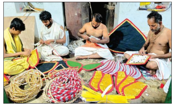
ପ୍ରସ୍ତୁତ ହୋଇଥାଏ। ବେଶ ପ୍ରସ୍ତୁତି ଲାଗି ଧନା, କଳା, ନାଲି, ହଳଦିଆ ଏବଂ ନେଲ ରଙ୍ଗର ପ୍ରାୟ ୨୦ରୁ ୩୦ ମିଟର କନା ଆବଶ୍ୟକ ହୋଇଥାଏ।