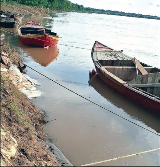
କାଳିପଦା, ୧୯।୬ (ସମିଧ)