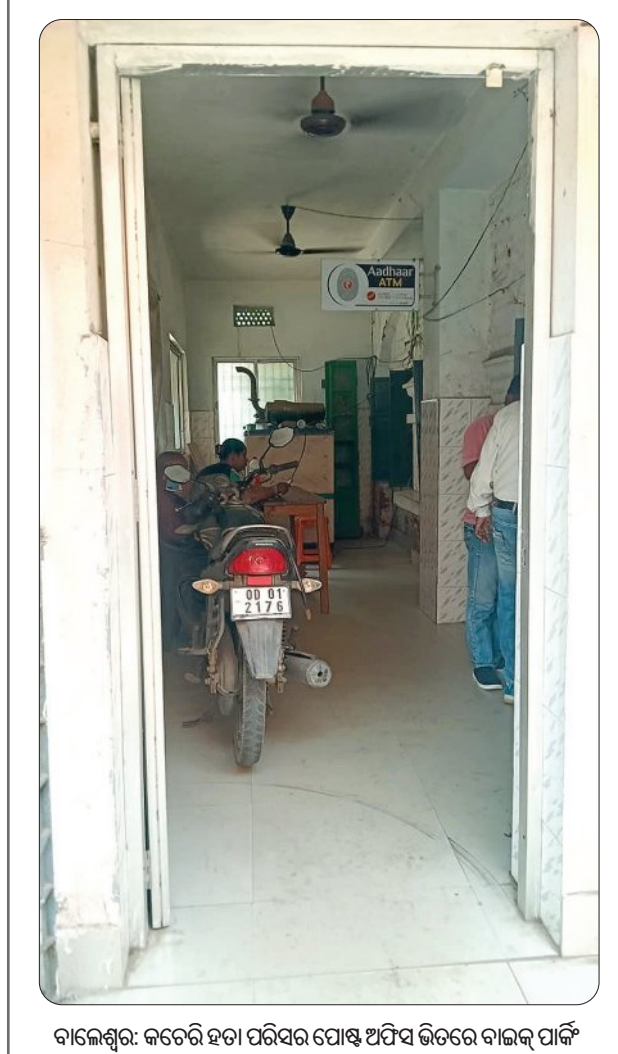
ବାଲେଶ୍ଵର: କଟକର ହତା ପରିସର ପୋଷ୍ଟ ଅଫିସ୍ ଭିତରେ ବାଇକ୍ ପାର୍କିଂ

କ୍ରିଲୋଚନ ଦାସ ଅଧିକାରୀଙ୍କ ଆବାହକରେ ଏବଂ ସମ୍ପାଦକ ରଞ୍ଜନ ଦାସଙ୍କ ସମ୍ପାଦନାରେ ସମ୍ପାଦିତ ପ୍ରକାଶିତ ଗ୍ରାମବାସୀ ଓ ଚାଷୀଙ୍କ ସମସ୍ୟା ସମ୍ପର୍କରେ ସର୍ବଶେଷ ଆଲୋଚନା ହୋଇଥିଲା।