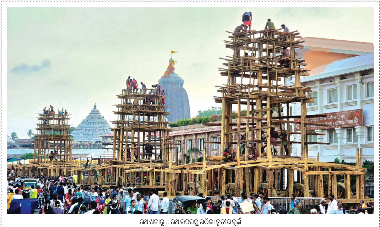
ରଥ ଖଳାରୁ... ରଥ ଉପରକୁ ଉଠିଲା ତୁଟାୟଭୂଇଁ