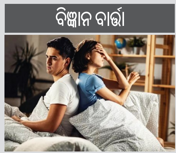
ସୁସ୍ଥିର ଭାବପାତି । ସ୍ଥାନ, କାଳ, ପାତ୍ର ନିର୍ଦ୍ଦିଷ୍ଟରେ ସବୁ ସାମାଜିକ ବ୍ୟବସ୍ଥା ପାଇଁ ଏହା ପ୍ରଯୁଜ୍ୟ । ବୟସ ବୃଦ୍ଧି ସଙ୍ଗେ ସଙ୍ଗେ ଏହା ଦୃଷ୍ଟି ପାଏ । ଉପରୋକ୍ତ ଅଧ୍ୟୟନ ଅନୁସାରେ ଏହାର କାରଣ ସମାନ ଅଂଶକୁ ପ୍ରଭାବିତ କରେ । ଅତଏବ ସେମାନଙ୍କ ମାନସିକତା ଏକାପ୍ରକାର ହେବାକୁ ଲାଗେ । ବିଶେଷ କରି, ମାନସିକ ବିଶ୍ୱାସନା । ପ୍ରଥମେ ଏହା କମ୍

ଶ୍ରୀମତୀ ପ୍ରଥମର ପ୍ରାୟ ସବୁ ସମାଜରେ ପତିପତ୍ନୀ ସଂପର୍କ ଅତିନିହିତ । ସେମାନଙ୍କ ମନ ଗୋଟିଏ ବୋଲି କୁହାଯାଏ । ଏହି ଉତ୍ତର ସତ୍ୟତା ଏବେ ପ୍ରମାଣିତ ହୋଇଛି ତାଲୁକା, ଚେନମାଳ ଓ ସ୍ୱିଡେନ୍‌ସରେ ଅନୁଷ୍ଠିତ ୫ ନିୟୁତରୁ ଅଧିକ ଦମ୍ପତିଙ୍କ ଉପରେ ହୋଇଥିବା ଏକ ଆନ୍ତର୍ଜାତିକ ଅଧ୍ୟୟନରୁ । ତହିଁରୁ ଜଣାପଡ଼ିଛି ଯେ ଅଧିକାଂଶ ସ୍ତ୍ରୀଙ୍କ ସେମାନଙ୍କ ମାନସିକ ବିଶ୍ୱାସନା ପ୍ରାୟ ଗୋଟିଏ ପ୍ରକାର । ନିକଟରେ (ସେପ୍ଟେମ୍ବର ୨୦୨୫) 'ନେଟର ହ୍ୟୁମାନ ବିହେଭିୟର' ପତ୍ରିକାରେ ପ୍ରକାଶିତ ଏହି ଗବେଷଣାର ପଞ୍ଚାଂଶକରେ ଏକଥା ସୂଚୀତ କରାଯାଇଛି । ତଦନୁଯାୟୀ ପତିପତ୍ନୀମାନଙ୍କ ମଧ୍ୟରୁ ଯଦି ଜଣେ କୌଣସି ପ୍ରକାର ମାନସିକ ବିଶ୍ୱାସନା ଭାଗେ ହେବେ ଅନ୍ୟଜଣକଠାରେ ତାହା କିମ୍ବା ସେଥିସହିତ ସଂପୃକ୍ତ ଅନ୍ୟ କୌଣସି ଲକ୍ଷଣ ପ୍ରକଟିତ ହେବାପରେ ଆଖ୍ୟାକ୍ତ ଏକ ଅଧିକ । ଏହି ମାନସିକ ବିଶ୍ୱାସନାଗୁଡ଼ିକ ମଧ୍ୟରେ ଅଛି ସିକୋପେଡ଼ିଆ, ମାନସିକ ଚାପ, ସ୍ମରଣଶକ୍ତି ହୀନତା,