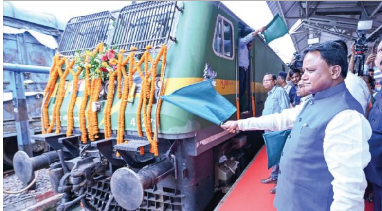
ରଙ୍ଗ ଯାତ୍ରା ନୁହେଁ, ବରଂ ଆତ୍ମର ଆସ୍ଥା, ଭକ୍ତି ଏବଂ ସାଂସ୍କୃତିକ ସାଭିମାନର ଏକ ମହାଯାତ୍ରା। ଏହି ଚାର୍ଯ୍ୟଯାତ୍ରା ସାରା ଦେଶରେ ଆୟୋଜିତ ହେଉଥିବା ମହାନ ରାଷ୍ଟ୍ରୀୟ ସଂକଳ୍ପ 'ସୋମନାଥ ସ୍ୱାଭିମାନ ପର୍ବ'ର ଏକ ଗୌରବପୂର୍ଣ୍ଣ ଅଂଶ, ଯାହା ଭାରତୀୟ ଇତିହାସର ଦୁର୍ଲଭ ପ୍ରମୁଖ।

■ ଭୁବନେଶ୍ୱର, ୧୫.୬ (ସଂକେନ୍ଦ୍ର): ମୁଖ୍ୟମନ୍ତ୍ରୀ ମୋହନ ଚରଣ ମାଝୀ ଆଜି (ସୋମବାର) ଭୁବନେଶ୍ୱରଠାରେ 'ସୋମନାଥ ସ୍ୱାଭିମାନ ଯାତ୍ରା-୨୦୨୬'ର ଶୁଭାରମ୍ଭ କରିଛନ୍ତି।