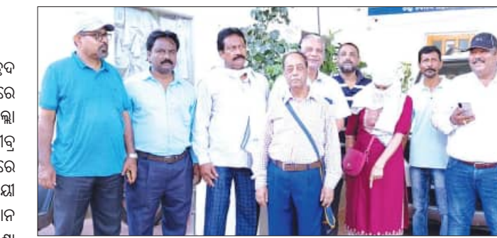
ବାଲେଶ୍ୱର, ୧୬