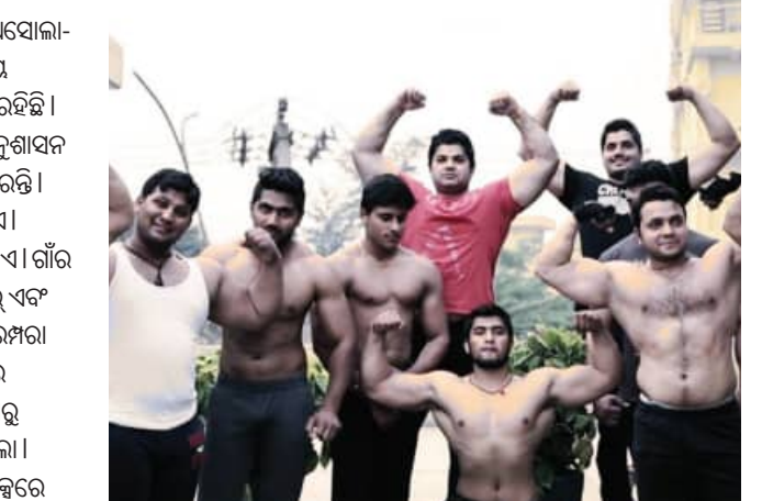
ପାଇବାକୁ ଅଳ୍ପକେ ବଞ୍ଚିତ ହୋଇଥିଲେ । ପରେ ସେ ଜଣେ ବାଉଁଶର ଭାବେ ନିଜ ଜୀବିକା ନିର୍ବାହ କରିଥିଲେ । ତାଙ୍କ ସଫଳତା ଗାଁର ଅନ୍ୟ ଲୋକଙ୍କୁ ପ୍ରେରଣା ଦେଇଥିଲା । ସେମାନେ ମଧ୍ୟ ବାଉଁଶର ଭାବେ କାର୍ଯ୍ୟ କରି ନିଜ ଶାରୀରିକ ଶକ୍ତିକୁ ଜୀବିକାରେ ପରିଣତ କରିବାକୁ ନିଷ୍ପତ୍ତି ନେଇଥିଲେ ।