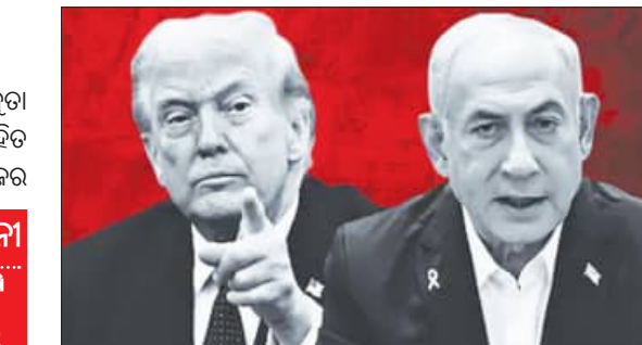
ନେତାମାନଙ୍କ ଉପରେ ଏବଂ ବାର୍ତ୍ତାଳାପ ଉପରେ ନଜର ରଖାଯାଉଥିବା ଅଭିଯୋଗ ହୋଇଛି । ଇସ୍ରାଏଲରେ କାର୍ଯ୍ୟରେ ଆମେରିକାର ପ୍ରତିରକ୍ଷା କର୍ମଚାରୀଙ୍କ ମୋବାଇଲ୍ ଫୋନ୍‌ରେ ବାର୍ତ୍ତାଳାପ ରେକର୍ଡ୍ କଲାଭଳି କିଛି ସନ୍ଦେହଜନକ ସମ୍ବନ୍ଧରେ ମିଳିବା ପରେ ଏହି ସନ୍ଦେହ ଆହୁରି ବୃଦ୍ଧ ହୋଇଛି । ଆମେରିକା ଓ ଇସ୍ରାଏଲ ପରସ୍ପର ବିଶ୍ୱସ୍ତରେ ସୂଚନା ସଂଗ୍ରହ କରୁଥିବା କଥା ପୂର୍ବରୁ ଜଣାଥିଲେ ମଧ୍ୟ ଚଳିତ ଥର ଇସ୍ରାଏଲ ସମସ୍ତ ସାମା ପାଠ କରିଥିବା ଆମେରିକା କିଛି ଅଧିକାରୀ ପ୍ରକାଶ କରିଛନ୍ତି । ପ୍ରକୃତରେ,