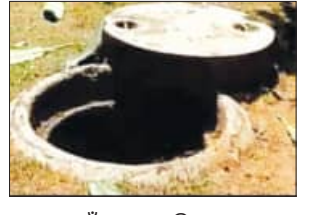
ନିୟମର ଉଲ୍ଲଙ୍ଘନ ଏବଂ କାହାର ଅବହେଳା ଯୋଗୁଁ ଏହି ଦୁର୍ଘଟଣା ଘଟିଲା, ଯେ ନେଇ ପୋଲିସ୍ ସିଭିଲିଟି ପୁଡ଼େଇ ଯାଞ୍ଚ କରିବା ଏବଂ ଅପମୃତ୍ୟୁ ମାମଲା ରୁକ୍ତ କରି ଅଧିକ ତଦନ୍ତ ଚଳାଇଛି ।

ସୁରଟ, ୭।୬ (ଏକେଡ଼ି): ଗୁଜରାଟର ସୁରଟ ସହରରେ ରବିବାର ସକାଳେ ଏକ ଆବାସନୀୟ ଘଟଣା ଘଟିଛି । ଅଗ୍ନିଶମ କ୍ରମରେ ଅଞ୍ଚଳରେ ଥିବା ଏକ ଅଲଙ୍କାର ନିର୍ମାଣ କାରଖାନାର ସେପ୍ଟିକ୍ ଟାଙ୍କି ସଫା କରିବାକୁ ଭିତରକୁ ଯିବାକୁ ଶକ୍ତି ହେବା ପରେ ୪ ଜଣଙ୍କ ମୃତ୍ୟୁ ହୋଇଛି । ପୋଲିସ୍ ଡିଭିଜନ୍ ଆଲୋକ କ୍ରମରେ ସୁରଟକୁ ଆସିଥିବା ସୁରଟରୁ ଜଣାପଡ଼ିଛି ଯେ ଶ୍ରମିକମାନେ କୌଣସି