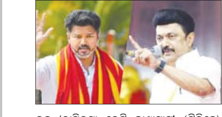
ଦଳ 'ତାମିଲନାଡୁ ଭେଟି କାୟାରାମ' (ଟିଭିକେ) ସରକାରଙ୍କ ସ୍ଵାୟତ୍ତ ଉପରେ ବଡ଼ ପ୍ରଶ୍ନବାଚୀ ସୃଷ୍ଟି କରିଛନ୍ତି । ବିଜୟଙ୍କ ସରକାର ୩ ମାସ ମଧ୍ୟ ଚାଲି ପାରିବ କି ନାହିଁ, ସେ ନେଇ ଜନସାଧାରଣଙ୍କ ମଧ୍ୟରେ ଆଲୋଚନା ଆରମ୍ଭ ହୋଇଗଲାଣି ବୋଲି

ଚେନ୍ନାଇ, ୭।୬ (ଏକେଡ଼ି): ତାମିଲନାଡୁ ରାଜନୀତିରେ ଏବେ ବାକ୍ସୁକ୍ତ ଚେନ୍ନାଇରେ ଲାଗିଛି । ତିଏକେ ସୁପ୍ରିମୋ ଏମକେ ସ୍ଵାଲିନ୍ ରବିବାର ଦିନ ଅଭିନେତାଙ୍କୁ ନେତା ସାଜିଥିବା ମୁଖ୍ୟମନ୍ତ୍ରୀ ବିଜୟଙ୍କ ସ୍ଵାଲିନ୍ କହିଛନ୍ତି । ସ୍ଵାଲିନ୍ କହିଛନ୍ତି ଯେ, ନୂଆ ସରକାର ଗଠନ ହେବା ପରେ ଆମେ ପ୍ରଥମ ୬ ମାସ ପର୍ଯ୍ୟନ୍ତ କୌଣସି ସମାଲୋଚନା ନକରିବାକୁ ନିଷ୍ପତ୍ତି ନେଇଥିଲୁ । କିନ୍ତୁ ସେହି ସମୟ ସରିବା ପୂର୍ବରୁ ହିଁ ରାଜ୍ୟରେ ଏଭଳି ପରିସ୍ଥିତି ସୃଷ୍ଟି ହୋଇଛି ଯେ, ଲୋକେ ଏହି ସରକାରର ଆତ୍ମସମ୍ପର୍କ ନେଇ ସନ୍ଦେହ କରୁଛନ୍ତି । ଏହାପୂର୍ବରୁ ମେ ମାସରେ ମଧ୍ୟ ସ୍ଵାଲିନ୍ ଅଭିଯୋଗ କରିଥିଲେ ଯେ, ଚିଲିକେ କୌଣସି ଦୁର୍ଘଟଣାରେ ଭିତ୍ତିଭୂମି ବିନା କେବଳ ଲନଶ୍ଵାଗ୍ରାମ ଭଳି ସୋସିଆଲ ମିଡିଆ ପ୍ଲାଟଫର୍ମ ବଳରେ କ୍ଷମତାକୁ ଆସିଛି । ସେମାନେ ଭୋଟରଙ୍କୁ ଭେଟିନାହାନ୍ତି କିମ୍ବା ବୁଦ୍ଧି ଏକେଶ ମଧ୍ୟ ନିମ୍ନକୁ ଭେଟିନାହାନ୍ତି, ତଥାପି ସରକାର ଗଢ଼ିଛନ୍ତି । ସ୍ଵାଲିନ୍ କହିଛନ୍ତି ଯେ, ତିଏକେ ୨୦୨୪ ଲୋକସଭା ନିର୍ବାଚନ ପରଠାରୁ ହିଁ ସମସ୍ତ ଗ୍ରାଉଣ୍ଡ ଓର୍ଡ୍ ଏବଂ କ୍ୟାମ୍ପେନ କାରି ରଖୁଥିଲୁ ।