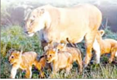
ପେରିବେ । ସିଂହମାନଙ୍କ ସ୍ୱରକ୍ଷା ପାଇଁ ଆଖପାଖ ଅଞ୍ଚଳର ପ୍ରାୟ ୬୦୦ ସିଂହଙ୍କୁ ପରଜାବା ମୁକ୍ତ ଅର୍ଥାତ୍ ତିଆରି କରାଯାଇଛି ।