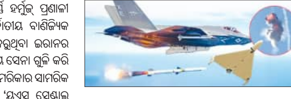
ଏବଂ କୁଏତ ଉପରକୁ ମଧ୍ୟ ଅନେକ ମିସାଇଲ ମାଡ଼ କରାଯାଇଛି । ମୁକ୍ତ ପୂର୍ବରୁ ବିଶ୍ୱର ପ୍ରାୟ ୨୦ ପ୍ରତିଶତ ତେଲ ପରିବହନ ଏହି ହର୍ମୁଜ୍ ପ୍ରଣାଳୀ ଦେଇ ହେଉଥିଲା । କିନ୍ତୁ ବର୍ତ୍ତମାନ ଇରାନ ଏହି ଗୁରୁତ୍ୱପୂର୍ଣ୍ଣ ଜଳପଥକୁ ସମ୍ପୂର୍ଣ୍ଣ ଅବରୋଧ କରି ରଖିଛି, ଯାହାକୁ ନେଇ ବିଶ୍ୱ ବଜାରରେ ଚିନ୍ତା ବଢ଼ିଛି । ଇରାନ ନିଜ ଉପକୂଳ ଆମେରିକାର କଟକଣା ହଟାଇବା, ବ୍ୟାନ୍ ହୋଇଥିବା ବିଲିୟନ ଡଲାର ତେଲ ରାଜସ୍ୱ ପେଟରୁ ପାଇବା ଏବଂ ଏହି ଜଳପଥ ଉପରେ ନିଜର ପ୍ରଭାବ ବିସ୍ତାର କରିବା ପାଇଁ ଚିନ୍ତା ରଖିଛି ।

ଦୁବାଇ, ୭।୬ (ଏକେଡ଼ି): ସଂଘର୍ଷପୂର୍ଣ୍ଣ ହର୍ମୁଜ୍ ପ୍ରଣାଳୀ ଦେଇ ଯାତାୟତ କରୁଥିବା ଆଡ଼ମ୍‌ଗ୍ରାଉଣ୍ଡ ବାଣିଜ୍ୟିକ ଜାହାଜଗୁଡ଼ିକ ପାଇଁ ବିପଦ ସୃଷ୍ଟି କରୁଥିବା ଇରାନର ଦୁଇଟି ଆତ୍ମୀୟ ଡ୍ରୋନ୍‌କୁ ଆମେରିକା ସେନା ଗୁଳି କରି ଖସାଇ ଦେଇଛି । ମଧ୍ୟ-ପ୍ରାନ୍ତ୍ୟରେ ଆମେରିକାର ସାମରିକ ଗତିବିଧି ଉପରେ ନଜର ରଖୁଥିବା 'ୟୁଏସ୍ ସେଣ୍ଟ୍ରାଲ କମାଣ୍ଡ' (ସେଣ୍ଟ୍ରାଲ) ଶନିବାର ବିକଳିତ ରାତିରେ ଏହି ସୂଚନା ଦେଇଛି । ଏହାପୂର୍ବରୁ ମଧ୍ୟ ଆମେରିକା ଇରାନର ୪ଟି ଡ୍ରୋନ୍‌କୁ ନଷ୍ଟ କରିବା ସହ ତା'ର ଉପକୂଳ ରାତାର କେନ୍ଦ୍ରକୁ ଖସି କରିଥିଲା । ବିଗତ ୩ ମାସ ହେବ ଚାଲିଥିବା ଏହି ମୁହୂର୍ତ୍ତ ରୋକିବା ପାଇଁ ଗୋଟିଏ ପଟେ 'ଓଷ୍ଟିନ' ଏବଂ ତେହେରାନ ମଧ୍ୟରେ ପରୋକ୍ଷ ଶାନ୍ତି ଆଲୋଚନା ଜାରି ରହିଛି, ହେଲେ ଅନ୍ୟପଟେ ଦୁଇ ଦେଶ ମଧ୍ୟରେ ସଂଘର୍ଷ ତେଜିବାର ଲାଗିଛି । ଶନିବାର ଦିନ ଇରାନ ପକ୍ଷରୁ ଆମେରିକାର ମିତ୍ର ଦେଶ ବାହାରିନ