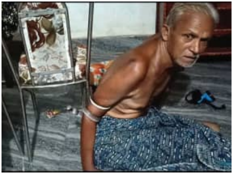
ଏହି ଗାଁର ପକ୍ଷାଘାତ ରୋଗୀ କୃଷକ ସାହୁଙ୍କୁ ଗୋଟିଏ ସାପ ଦାନ୍ତ ୨ ଘଣ୍ଟା ଧରି ବାନ୍ଧି ରଖିଥିଲା। ସେ ଘରେ ଶୋଇଥିବା

ବୌଦ୍ଧ, ୩୯।୫ (ସମ୍ପାଦକ): ବୌଦ୍ଧ ଜିଲ୍ଲା ହରଭଙ୍ଗା ବ୍ଲକ୍ ଆଡ଼େମିଟିଗଡ଼ ଗ୍ରାମରେ ଏକ ଭୟଙ୍କର ଦୃଶ୍ୟ ଦେଖିବାକୁ ମିଳିଛି।