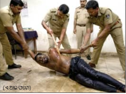
(ଏ ଆଇ ପଟେ)

ଆଇନଶୁଖିଲା ରକ୍ଷା କରିବା, ଅପରାଧ ନିୟନ୍ତ୍ରଣ କରିବାଠାରୁ ଆରମ୍ଭ କରି ଜନସାଧାରଣଙ୍କ ଜୀବନ ଓ ସମ୍ପତ୍ତି ସୁରକ୍ଷା ସୁନିଶ୍ଚିତ କରିବା ହେଉଛି ପୁଲିସର ଦାୟିତ୍ୱ। ଏହାସହ ଆନାକୁ ଆସୁଥିବା ଲୋକଙ୍କୁ ଉତ୍ତମ ବ୍ୟବହାର ସହ ସେମାନଙ୍କୁ ହରିତ ନ୍ୟାୟ ପ୍ରଦାନ ଦିଗରେ କାମ କରିବାକୁ ଉଚ୍ଚ ଅଧିକାରୀମାନେ ସହକେତେକ ନିର୍ଦ୍ଦେଶ ଦେଇ ଆସୁଛନ୍ତି। ନାଗରିକ ସେବାକୁ ଅଧିକ କ୍ରିୟାଶୀଳ କରିବା ଲାଗି ପ୍ରତ୍ୟେକ ଆନାକୁ ପ୍ରତି ମାସରେ ଟଙ୍କା ମଧ୍ୟ ଦିଆଯାଉଛି। ଏତେ ସବୁ ପରେ ମଧ୍ୟ ମଧ୍ୟ ଶୁଖିଲା ବିଭାଗରେ ବିଶୁଖିଲା ବଢ଼ିଚାଲିଛି। କେଉଁଠି ନ୍ୟାୟ ପାଇଁ ଆନାର ଦାବି ହୋଇଥିବା ମାଆ-ପୁଅଙ୍କୁ ପୁଲିସ୍ ଅମାନ୍ୟତା ଭାବେ ମାଡ଼ ମାରୁଛି ତ ଆଉ କେଉଁଠି ମିଛ ଉତ୍ତର ଦେବାକୁ ବାଧ୍ୟ କରି ସୁରକ୍ଷା ଆଡ଼ି ତିଗ୍ରିର ସମ୍ପର୍କ ଦେଉଛି। କେବଳ ସେତିକି ନୁହେଁ, ବିବାହ ସମାଧାନ ଆଣିବାକୁ ଆନାକୁ ଯାଇଥିବା ମହିଳାଙ୍କ ହାତ ଭାଙ୍ଗି ଦେଉଛି ପୁଲିସ୍। ଗତ କିଛି ମାସ ମଧ୍ୟରେ ରାଜ୍ୟର ବିଭିନ୍ନ ଆନାରେ ଆର୍ଡି ଡିଏଲ୍ ଭଳି ବିଭିନ୍ନ ଅମଳର କୁହୁଡ଼ି ପରମ୍ପରାର ଚିତ୍ର ସାମୁଦ୍ରିକ ଆସିଛି। ଠିକଣା ସମୟରେ ଏହାକୁ ନେଇ ପୁଲିସର ଅଚରଣ ସଂହିତା ଉପରେ ପ୍ରଶ୍ନ ଉଠିଛି।