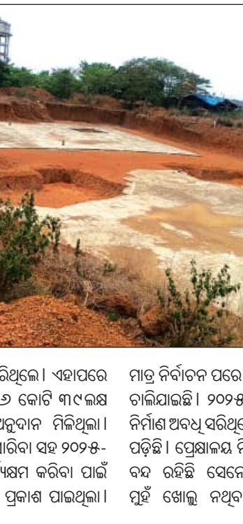
ଡକ୍ଟରୀନ ସହିତ ଯୋଷାଣା କରିଥିଲେ। ଏହାପରେ ଜିଏମ୍ କୋଠା ନିର୍ମାଣ ପାଇଁ ୨୬ କୋଟି ୩୯ ଲକ୍ଷ ୭୬ ହଜାର ୯୦୮ ଟଙ୍କା ଅନୁଦାନ ମିଳିଥିଲା। ୨୦୨୫ ମସିହାରେ ନିର୍ମାଣ କାର୍ଯ୍ୟ ଆରମ୍ଭ ହେବ। ୨୦୨୬ ମସିହାରେ ନିର୍ମାଣ କାର୍ଯ୍ୟ ସମାପ୍ତ ହେବ।

ଭୁବନେଶ୍ୱର, ୩୧।୫ (ସମ୍ବିଧା): ପ୍ରୋକ୍ଷାଳ ନିର୍ମାଣ ନିଅଁ ଫୁଲିକା; ଛଡ଼ ବନ୍ଧାହେଲା। ବ୍ରିଟିଶ୍ ବେଗରେ ନିର୍ମାଣ କାର୍ଯ୍ୟ ସାଧାରଣକୁ ଅଧିକାରୀମାନେ ଘନଘନ ସମାକ୍ଷା କଲେ। ମାତ୍ର ୨୦୨୪ ସାଧାରଣ ନିର୍ବାଚନ