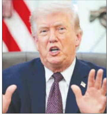
ଦେବ ବୋଲି ଆମେରିକା ମୁଖ୍ୟ ସର୍ବ ରଖିଛି । ଆମେରିକାର ଅଧିକାରୀଙ୍କ କହିବା ଅନୁଯାୟୀ, ଟ୍ରମ୍ପ କେବଳ ସେହି ଚୁକ୍ତିରେ ସାକ୍ଷର କରିବେ

ପ୍ରଶାକାକୁ ଅନ୍ତର୍ଜାତୀୟ ଜଳପଥ ପାଇଁ ସମ୍ପୂର୍ଣ୍ଣ ଭାବେ ଖୋଲିବାକୁ ହେବ ଏବଂ ସେଠାରେ ବିଜ୍ଞାପିତଥିବା ସମସ୍ତ ସାମୁଦ୍ରିକ ବୋମାକୁ ନଷ୍ଟ କରିବାକୁ ପଡ଼ିବ । ଏହା ସହିତ ଇରାନ କେବେ ମଧ୍ୟ ପରମାଣୁ ବୋମା ତିଆରି କରିବ ନାହିଁ ଏବଂ ନିଜ ପାଖରେ ଥିବା ସମସ୍ତ ଯୁଗ୍ମାୟମକୁ ଆମେରିକା ଦ୍ୱାରା ହଟାଇବାକୁ ଅନୁମତି