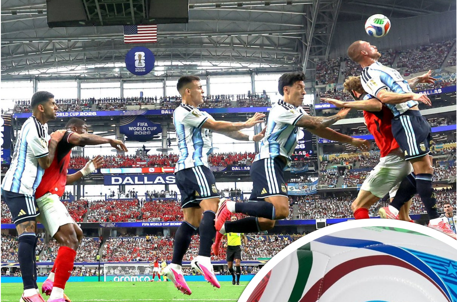
ଆଜେଣ୍ଡିନା-ଅଷ୍ଟିଆ ମ୍ୟାଚର ରୋମାଞ୍ଚକ ମୁହୂର୍ତ୍ତ