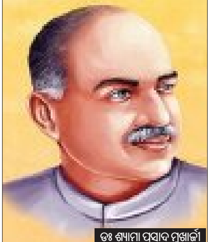
ଡଃ ଶାମା ପ୍ରସାଦ ମୁଖାର୍ଜୀ

ଡ. ଶାମାପ୍ରସାଦ ମୁଖାର୍ଜୀ ବିଚାରଧାରା ସର୍ବଦା ଦେଶପ୍ରେମ, ସାହସ ଓ ଆଦର୍ଶବାଦ ଉପରେ ପର୍ଯ୍ୟବସିତ ରହିଥିଲେ । ଦେଶ ବିଭାଜନ ପୂର୍ବରୁ ସେ ବଙ୍ଗର ହିନ୍ଦୁ ସର୍ବଦା ସାମ୍ବନ୍ଧିକ ଭାରତରେ ରଖିବା ପାଇଁ ଦୃଢ଼ ଭୂମିକା ଗ୍ରହଣ କରିଥିଲେ । ତାଙ୍କର ଉଦ୍ୟମ ପାଇରେ ପଶ୍ଚିମବଙ୍ଗ ଭାରତର ଅଂଶ ଭାବେ ରହିପାରିଥିଲା । ଏହା ହିଁ ତାଙ୍କ ଜୀବନର ସବୁଠାରୁ ବଡ଼ ରାଜନୈତିକ ଅବଦାନ । ସାଧାନ ଭାରତର ପ୍ରଥମ ମନ୍ତ୍ରୀମଣ୍ଡଳରେ ସେ ପଣ୍ଡିତ ଜବାହରଲାଲ ନେହେରୁଙ୍କ ନିମନ୍ତ୍ରଣରେ ଶିଳ୍ପ ଓ ଯୋଗାଣମନ୍ତ୍ରୀ ଭାବେ କାର୍ଯ୍ୟ କରିଥିଲେ । ଦେଶର ଔଦ୍ୟୋଗିକ ବିକାଶ ପାଇଁ ବିଭିନ୍ନ ପଦକ୍ଷେପ ଗ୍ରହଣ କରିଥିଲେ । ବିଭରଞ୍ଜନ ଲୋକାମୋଚିତ୍, ସିଡି ସାର କାରଖାନା ଓ ହିନ୍ଦୁସ୍ଥାନ ଏୟାରଲାଇନ୍ ସଂସ୍ଥାର ମୂଳଦୁଆ ପଡ଼ିଥିଲା । ପୂର୍ବ ପାକିସ୍ତାନରେ ହିନ୍ଦୁମାନଙ୍କ ଉପରେ ଅତ୍ୟାଚାର ଓ କେନ୍ଦ୍ର ସରକାରଙ୍କ ନୀତିକୁ ନେଇ ସେ ଅସନ୍ତୋଷ ପ୍ରକାଶ କରିଥିଲେ । ପଣ୍ଡିତ ନେହେରୁ ଓ ଲିଆକତ ଅଲ୍ଲାଇ ଦେଶ ବିରୋଧୀ ନୀତି ଯୋଗୁଁ ସେ ମନ୍ତ୍ରୀ ପଦକୁ ଇସ୍ତଫା ଦେଇଥିଲେ ।