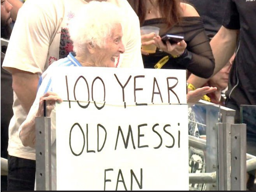
ଷ୍ଟାଡ଼ିୟମରେ ଉପସ୍ଥିତ ଶତାବ୍ଦୀ ପ୍ରଫ୍‌ଶକ