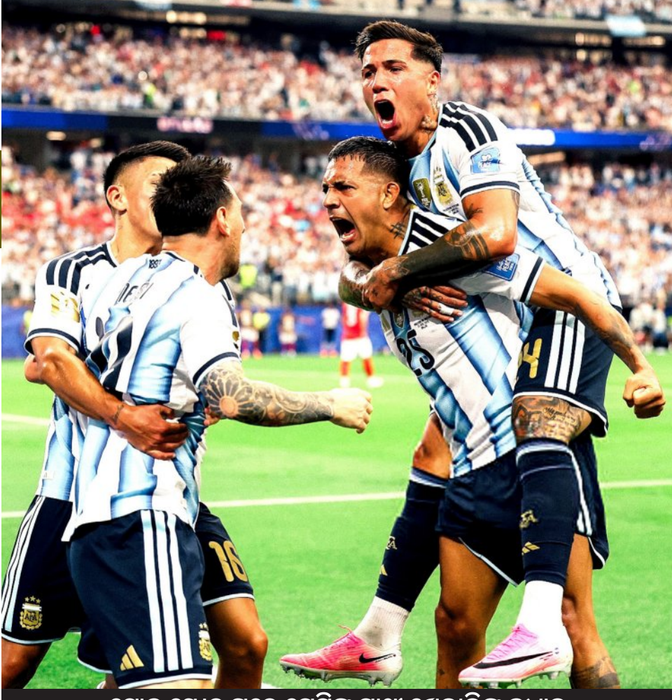
ଗୋଲ୍‌ସ୍କୋର ପରେ ମେସିଙ୍କୁ ସାଥୀ ଖେଳାଳିଙ୍କ ବଧାଇ

ମେସିଙ୍କ ଏହି ସର୍ବ ଗୋଲ୍‌ସ୍କୋର ବାହାରେ ପକାଇଥିଲା। ଯାହା ଷ୍ଟାଡ଼ିୟମରେ ଉପସ୍ଥିତ ହଜାର ହଜାର ଆଜେଣ୍ଡିନା ପ୍ରଫ୍‌ସଙ୍କୁ ନିରାଶ କରିଥିଲା। ମେସିଙ୍କ ଅନ୍ତର୍ଜାତୀୟ କ୍ୟାରିୟରରେ ଏହା ୧୪୫ତମ ପେନାଲ୍ଟି ଥିବାବେଳେ ସେ ୩୨ଥର ଲାଗି ସର୍ ମିସ୍ କରିଛନ୍ତି। ସେହିଭଳି ବିଶ୍ୱକପରେ ମେସି ୬ଥର ଲାଗି ପେନାଲ୍ଟି ସୁଯୋଗ ପାଇଥିଲେ। କିନ୍ତୁ ୩୨ଥର ପାଇଁ ସେ ମିସ୍ କରିଛନ୍ତି। ଫଳରେ ମେସି ବିଶ୍ୱକପରେ ସର୍ବାଧିକ ପେନାଲ୍ଟି କିମ୍ ମିସ୍ କରିଥିବା ଖେଳାଳି ହୋଇଛନ୍ତି।