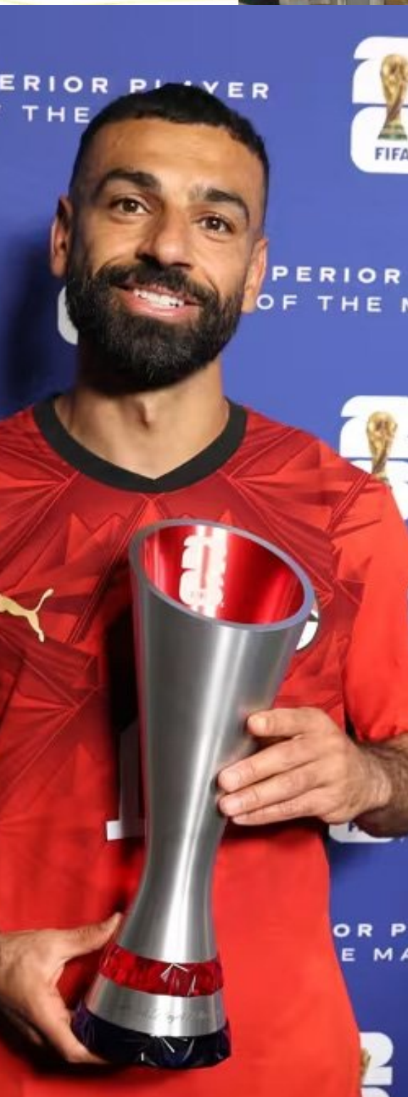
ଇଜିପ୍ଟର ମହମ୍ମଦ ସଲା