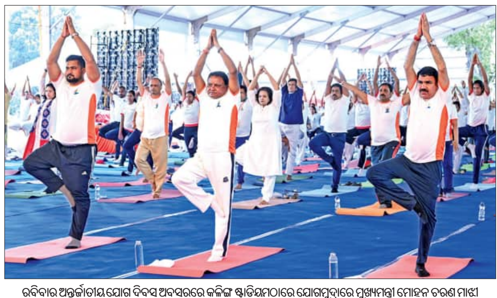
ରବିବାର ଅନ୍ତର୍ଜାତୀୟ ଯୋଗ ଦିବସ ଅବସରରେ କଳିଙ୍ଗ ଷ୍ଟାଡିୟମରେ ଯୋଗପ୍ରସାରଣ ମୁଖ୍ୟମନ୍ତ୍ରୀ ମୋହନ ଚରଣ ମାଝି