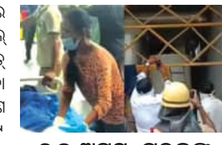
୬୭ ଅସୁସ୍ଥ, ମୃତକଙ୍କ ମଧ୍ୟରେ ୭ ଓଡ଼ିଆ ଶ୍ରମିକ

■ ବେଲୁଆ, ୨୧।୬ (ଏକେନ୍ଦ୍ର): ଚାମିଲନାଟୁର ତିରୁଲୁର ଜିଲ୍ଲାରେ ଥିବା ସେଣ୍ଟ ପିଟର୍ସ ପଲ୍ ସାମୁଦ୍ରିକ ଖାଦ୍ୟ (ମାଛ) ରସାୟନ କାରଖାନାରେ ହଠାତ୍ ଆମୋନିଆ ଗ୍ୟାସ୍ ଲିକ୍ ହେବା ଯୋଗୁଁ ୭ ଜଣ ମହିଳା ଶ୍ରମିକଙ୍କର ମୃତ୍ୟୁ ଘଟିଥିବା ବେଳେ ପ୍ରାୟ ୬୭ ଜଣ ଶ୍ରମିକ ଅସୁସ୍ଥ ହୋଇଛନ୍ତି । ଆହତମାନଙ୍କ ମଧ୍ୟରୁ ୯ ଜଣଙ୍କ ଅବସ୍ଥା ଅତ୍ୟନ୍ତ ସଙ୍କଟାପନ୍ନ ଥିବାରୁ ସେମାନଙ୍କୁ ଭେଣ୍ଟିଲେଟରରେ ରଖାଯାଇଛି । ମୃତ୍ୟୁର ମଧ୍ୟରେ ଲିକ୍ ଓଡ଼ିଆ ଶ୍ରମିକ ରହିଥିବା ଜଣାପଡ଼ିଛି । ଏହି ଦୁର୍ଘଟଣା