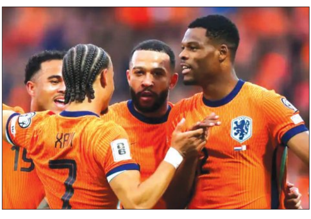
ନେଦରଲ୍ୟାଣ୍ଡସ୍ ଟିମ୍ ଖେଳାଳିମାନେ ଚାମ୍ପିଅନ ହେବା ପରେ ଉତ୍ସାହରେ ଖେଳୁଛନ୍ତି।