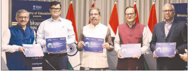
ଜୁନ ୧୫ରୁ ୧୬ ପ୍ରାନ୍ତରେ ହେବ 'ଭାରତ ଇନୋଭେଟ୍‌ସ୍'ର ଆନ୍ତର୍ଜାତୀୟ ପ୍ରଦର୍ଶନୀ

ଜୁନ ୧୫ରୁ ୧୬ ପ୍ରାନ୍ତରେ ହେବ 'ଭାରତ ଇନୋଭେଟ୍‌ସ୍'ର ଆନ୍ତର୍ଜାତୀୟ ପ୍ରଦର୍ଶନୀ। ଏହା ନୂଆଦିଲ୍ଲୀ, ୧୨।୬ (ଏକେନି): ଭାରତରେ ବହୁଥିବା ଇନୋଭେସନ୍ ଓ ଟେକ୍ନୋଲୋଜି ସମ୍ପର୍କରେ ବିଶ୍ୱ ସରକାରରେ ପ୍ରଦର୍ଶିତ କରିବା ପାଇଁ ଏକ ବଡ଼ ପଦକ୍ଷେପ ନିଆଯାଇଛି। ପ୍ରାନ୍ତ ନିର୍ବାହୀ ସହକାରୀ ଆୟୋଜିତ ହେବାକୁ ଥିବା ଏହି ପ୍ରମୁଖ ଆନ୍ତର୍ଜାତୀୟ ପ୍ରଦର୍ଶନୀ ପୂର୍ବରୁ ଆଜି ନୂଆଦିଲ୍ଲୀ ଠାରେ କେନ୍ଦ୍ର ଶିକ୍ଷାମନ୍ତ୍ରୀ ଧର୍ମେନ୍ଦ୍ର ପ୍ରଧାନ 'ଭାରତ ଇନୋଭେଟ୍‌ସ୍'ର ରଣନୀତିକ ଦସ୍ତାବିଜ୍ ଉନ୍ମୋଚିତ ଆନୁଷ୍ଠାନିକ ଭାବେ ଉନ୍ମୋଚିତ କରିଛନ୍ତି। ଉନ୍ମୋଚନ ସମୟରେ କେନ୍ଦ୍ରମନ୍ତ୍ରୀ ଶ୍ରୀ ପ୍ରଧାନ କହିଛନ୍ତି, ଆସନ୍ତା ଜୁନ ୧୫ ତାରିଖରେ ପ୍ରାନ୍ତ ନିର୍ବାହୀ ସହକାରୀ ଦେଶର ପ୍ରଧାନମନ୍ତ୍ରୀ ନରେନ୍ଦ୍ର ମୋଦୀ ଏବଂ ପ୍ରାନ୍ତର ରାଷ୍ଟ୍ରପତି