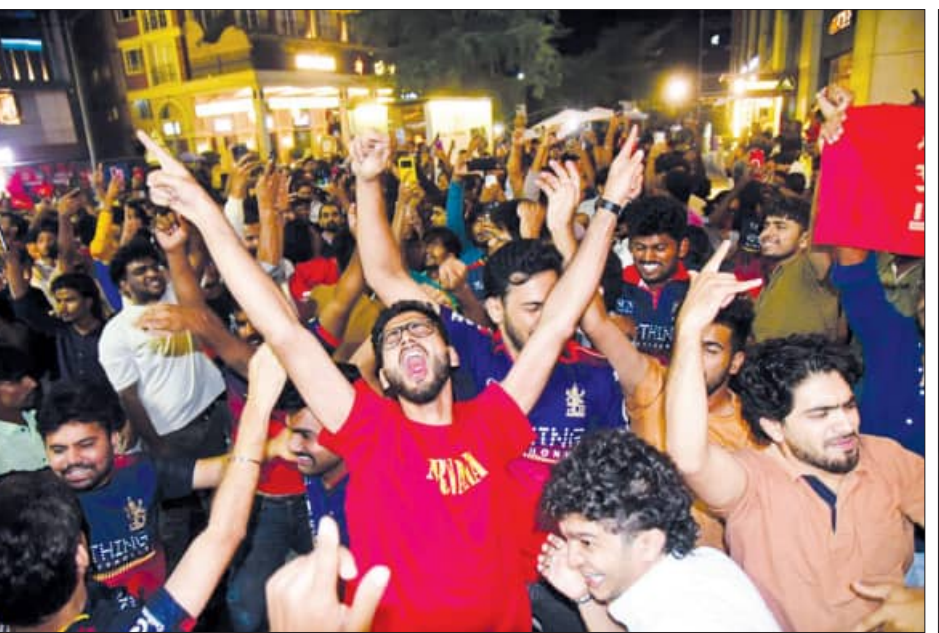
ବେଙ୍ଗାଲୁରୁରେ ଆର୍ଦ୍ଧିକ ସମର୍ଥକଙ୍କ ବିଜୟ ଉତ୍ସବ