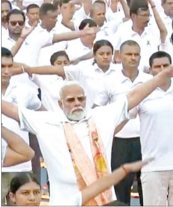
ଅନ୍ତର୍ଜାତୀୟ ଯୋଗ ଦିବସ ଅବସରରେ କୋଲକାତାର ରେଭୁ ଭୋଡ଼ରେ ପ୍ରଧାନମନ୍ତ୍ରୀ ନରେନ୍ଦ୍ର ମୋଦୀଙ୍କ ଯୋଗାବଲୀ